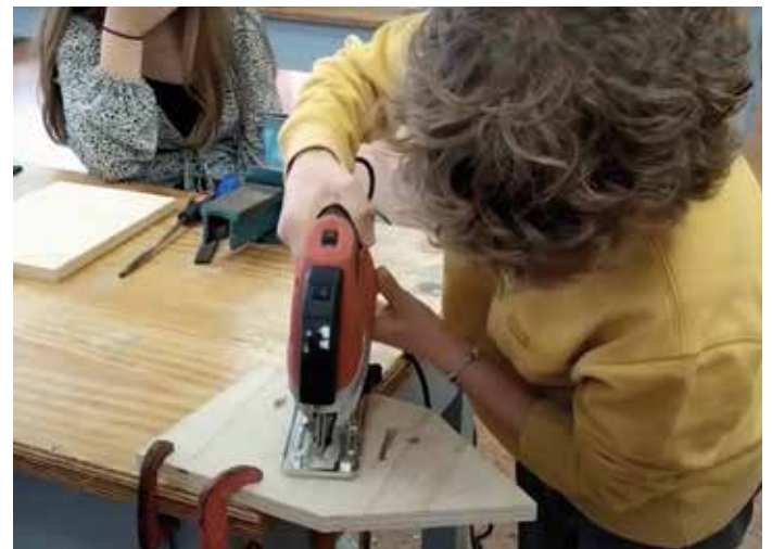
La actual es la tercera edición de STEMotiv.

ESTA NUEVA EDICIÓN SE CENTRará EN LA ETAPA DE PRIMARIA. EL OBJETIVO DEL PROYECTO ES COMPRENDER E INCIDIR EN EL INTERÉS Y MOTIVACIÓN DEL ALUMNADO DE FP POR LAS ASIGNATURAS STEM.