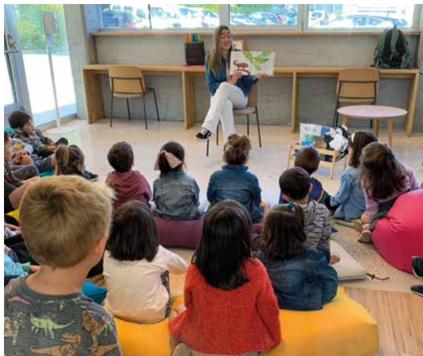
Una jornada organizada por el proyecto Murmurikan .

EL PROYECTO MURMURIKAN CUYO OBJETIVO ES EL DE CONTAR CUENTOS A NIÑOS Y NIÑAS SE ESTABILIZA EN LA FACULTAD DE HUMANIDADES Y CIENCIAS DE LA EDUCACIÓN