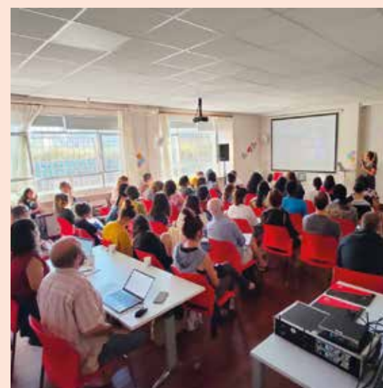
Evento celebrado en Hernani

Las jornadas fueron organizadas por las tres entidades que participan en el proyecto KoopFabrika, como Olaturkoop, el Centro de Investigación en Cooperativismo LANKI de Mondragon Unibertsitatea y GEZKI, el Instituto de Economía Social y Derecho Cooperativo de la EHU/UPV. El programa incluye una subvención del Departamento de Promoción Económica, Turismo y Medio Rural de la Diputación Foral de Gipuzkoa.