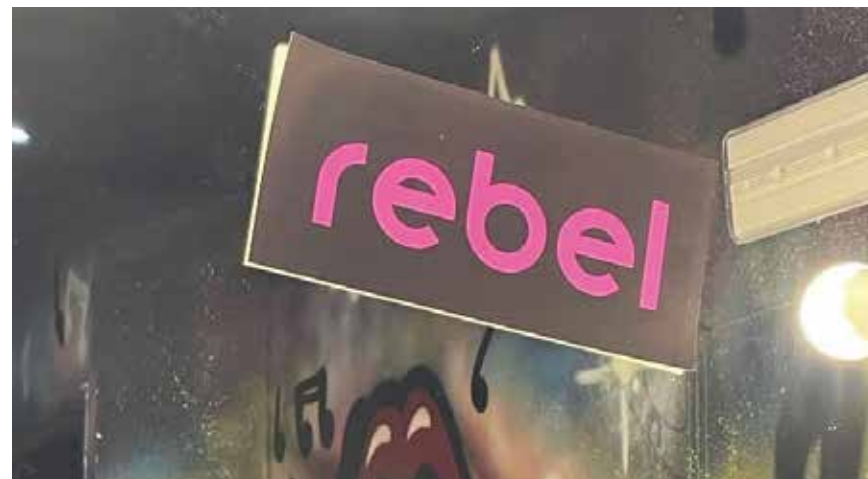
Imagen de Rebel, nueva app de ticketing.

Se podrán comprar y vender sus entradas de ocio nocturno en Bilbao, Barcelona y Madrid.