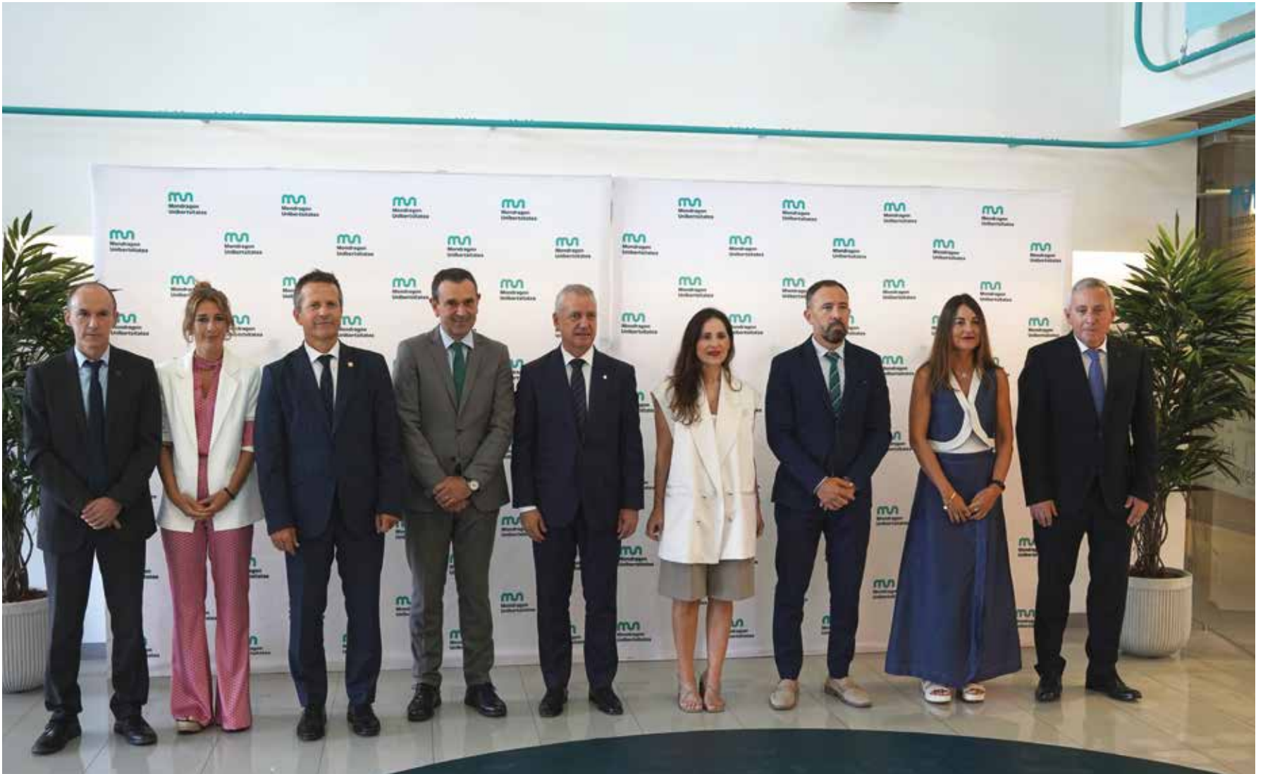
Ordezkaritza zabala gerturatu zen ikasturte hasiera ekitaldira.