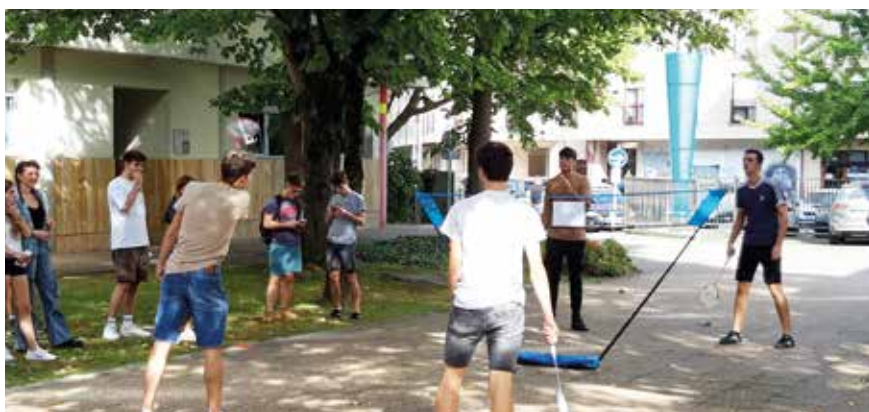
Alumnos practicando deporte de bádminton en el campus de Arrasate.

LA ORGANIZACIÓN MUNDIAL DE LA SALUD (OMS), LA ESCUELA AMERICANA DE MEDICINA DEL DEPORTE Y LA RED DE INVESTIGACIÓN SOBRE EL COMPORTAMIENTO SEDENTARIO CONSIDERAN AL SEDENTARISMO EL PRINCIPAL RESPONSABLE DEL CRECIMIENTO DE DOLENCIAS DE LA POBLACIÓN ADULTA EN LOS ÚLTIMOS 30 AÑOS.