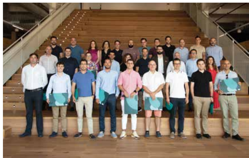
Bilbao As Fabrik acogió la graduación de una treintena de estudiantes.

El programa se dirige a profesionales interesados en formarse en tecnologías del hidrógeno y sus aplicaciones, y está impulsado y coordinado por 5 universidades estatales: Mondragon Unibertsitatea, universidad que lo lidera; la Universidad del País Vasco, la Universitat Politècnica de Catalunya, la Universitat Rovira i Virgili y la Universidad de Zaragoza. Además, otros 6 centros formativos y de investigación participan en el desarrollo del máster, tratándose de una colaboración sin precedentes de entidades de referencia del mundo industrial, universitario y de formación profesional, con el objetivo de acelerar el desarrollo efectivo de las tecnologías del hidrógeno en la industria.