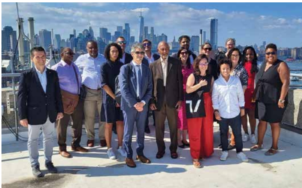
Representación de la Facultad de Empresariales y diversos agentes en New York.

LA FACULTAD DE EMPRESARIALES DE MONDRAGON UNIBERTSITATEA REFUERZA LA COLABORACIÓN CON DISTINTAS ENTIDADES DE NUEVA YORK PARA IMPULSAR EL EMPRENDIMIENTO Y LA INNOVACIÓN EN LA CIUDAD