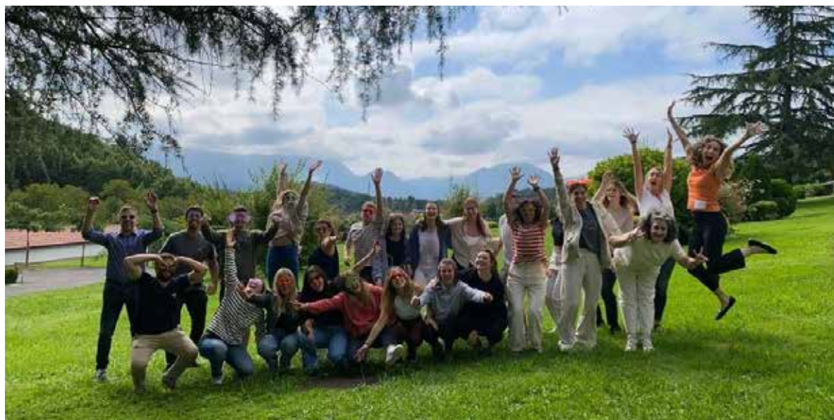
Estudiantes de los másteres de Empresariales cuentan con novedades.

ENTRE SEPTIEMBRE Y OCTUBRE HAN DADO COMIENZO LOS MÁSTERES UNIVERSITARIOS DE LA FACULTAD DE EMPRESARIALES CON UN TOTAL 136 ESTUDIANTES