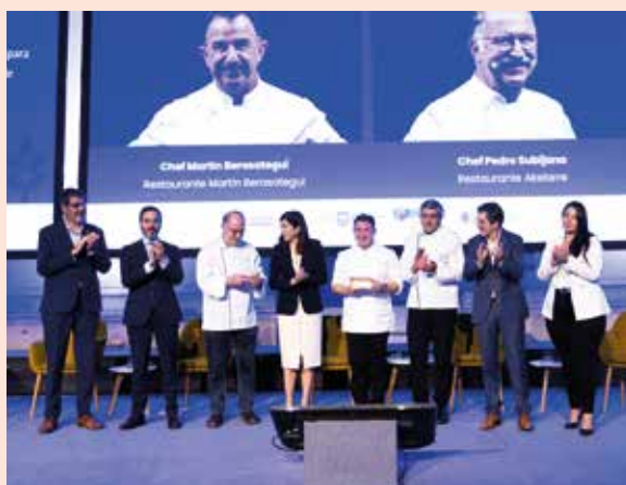
Reconocidos chefs se reunieron en Donostia.

EL FORO MUNDIAL SOBRE TURISMO GASTRONÓMICO VOLVIÓ A CELEBRARSE EN DONOSTIA ENTRE EL 5 Y 7 DE OCTUBRE, CONGREGANDO A MÁS DE 300 PROFESIONALES DE LA INDUSTRIA, EXPERTOS Y REPRESENTACIÓN INSTITUCIONAL Y FORTALECIÓ LOS VÍNCULOS ENTRE LA AGRICULTURA, LA GASTRONOMÍA Y EL TURISMO