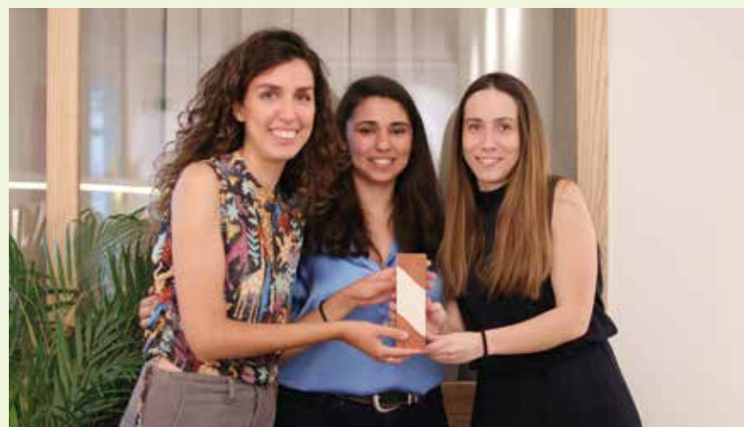
Alumnas y exalumnas del del Máster Universitario en Diseño Estratégico han sido premiada con el LAUS de Bronce.

NAIHA, EL SOFTWARE SOCIOSANITARIO DESARROLLADO POR LA EMPRESA VASCA UBIKARE, HA SIDO PREMIADO CON EL LAUS DE BRONCE, LOS GALARDONES NACIONALES MÁS DESTACADOS DE DISEÑO GRÁFICO