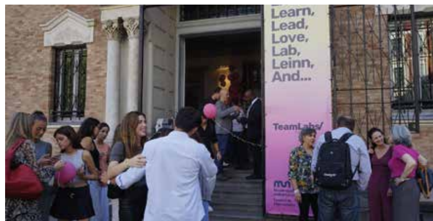
Acto de inauguración de la nueva sede LEINN en Madrid

CIENTOS DE PERSONAS DESCUBRIERON EL NUEVO ESPACIO Y CELEBRARON EL 15 ANIVERSARIO DE MONDRAGON TEAM ACADEMY