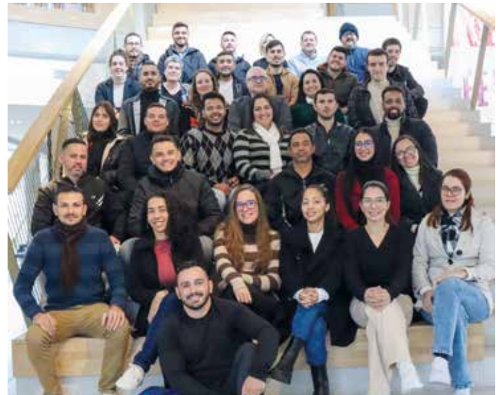
Eskoriatzako campusean egindako harrera ekitaldia.

LAU ASTEZ IZANGO DIRA HUMANITATE ETA HEZKUNTZA ZIENTZIEN FAKULTATEAN, PRESTAKUNTZA JASOTZEAZ ETA TITULU AMAIERAKO PROIEKTUA AURRERATZEAZ GAIN, HAINBAT ERAKUNDE ETA ENPRESA BISITATU DITUZTE.