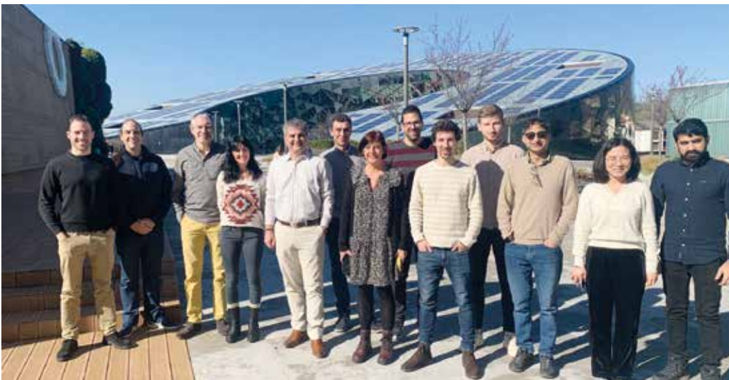
Proiektuko kideen bilkura Hernanin.

APLIKAZIO EZBERDINEN EGUNERATZE PROZESUETAN ERAGITEKO HELBURUA ZUEN PROIEKTUAK BALORAZIO POSITIBOA JASO DU IKERKETA TALDE ETA ENPRESA KOLABORATZAILEEN ESKUTIK.