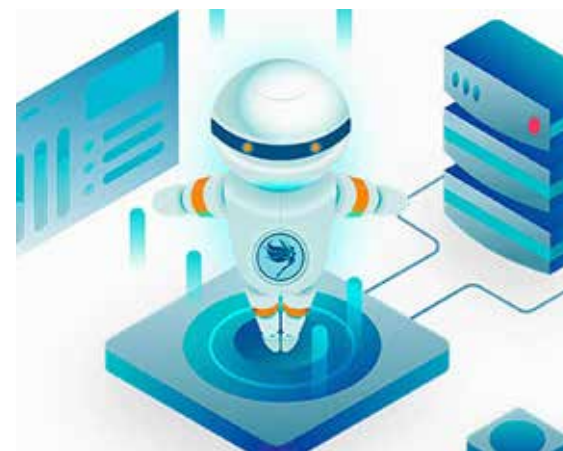
Una nueva plataforma monitoriza la ejecución del modelo.

ANJANA DATA Y LA FACULTAD DE EMPRESARIALES UNEN FUERZA PARA OFRECER FORMACIÓN EN GOBIERNO DE DATOS APLICADA AL ÁREA DE NEGOCIO, A LOS ALUMNOS Y ALUMNAS DEL GRADO EN BUSINESS DATA ANALYTICS Y DEL MÁSTER DE ANÁLISIS DE DATOS PARA LA INTELIGENCIA DE NEGOCIO