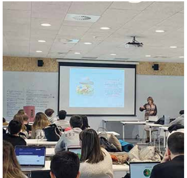
Estudiantes de myGADE trabajan en nuevas soluciones.

ESTUDIANTES DE myGADE DESARROLLAN PROYECTOS CON EL OBJETIVO DE REDUCIR EL DESPILFARRO ALIMENTARIO EN EUSKADI