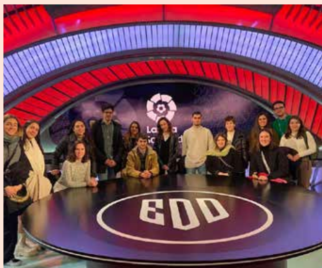
Estudiantes posan en un plató de Movistar+.