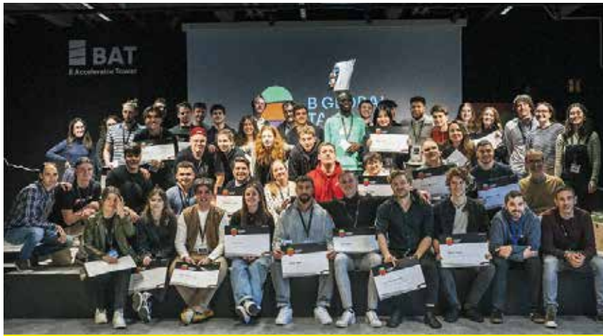
Gente proveniente de 12 países han compartido sus experiencias.

B GLOBAL TALENT, UNA INICIATIVA IMPULSADA POR LA DIPUTACIÓN DE BIZKAIA Y DESARROLLADA POR MONDRAGON TEAM ACADEMY, PROMUEVE LA ATRACCIÓN Y DESARROLLO DE TALENTO A ESCALA LOCAL Y NACIONAL DE LA MANO DE EMPRESAS COMPROMETIDAS CON LA INNOVACIÓN