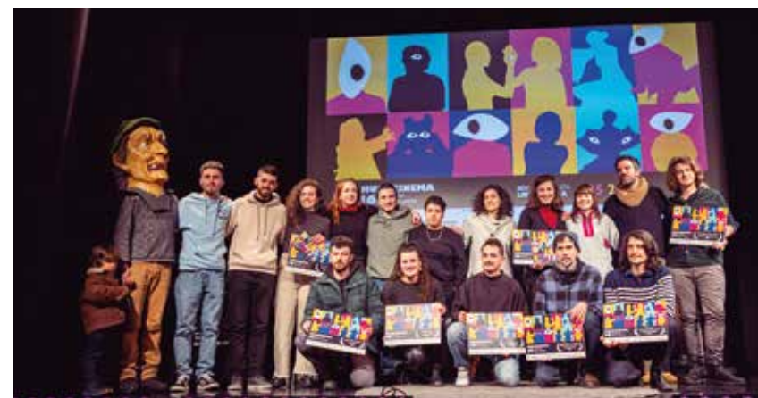
16. edizioko irabazle guztiak.

Huhezinema Euskal Film Laburren Jaialdia ez da ohiko lehiaketa bat, izan ere, irakasleen laguntzarekin eta graduko Kultur ekitaldiak antolatu eta ekoiztu izeneko proiektuaren barruan, Mondragon Unibertsitateko Ikus-entzunezko Komunikazioa graduko 4. mailako ikasleek antolatzen dute sariketa. Aurten, 14 lagunekoko talde batek antolatu du Huhezinema.