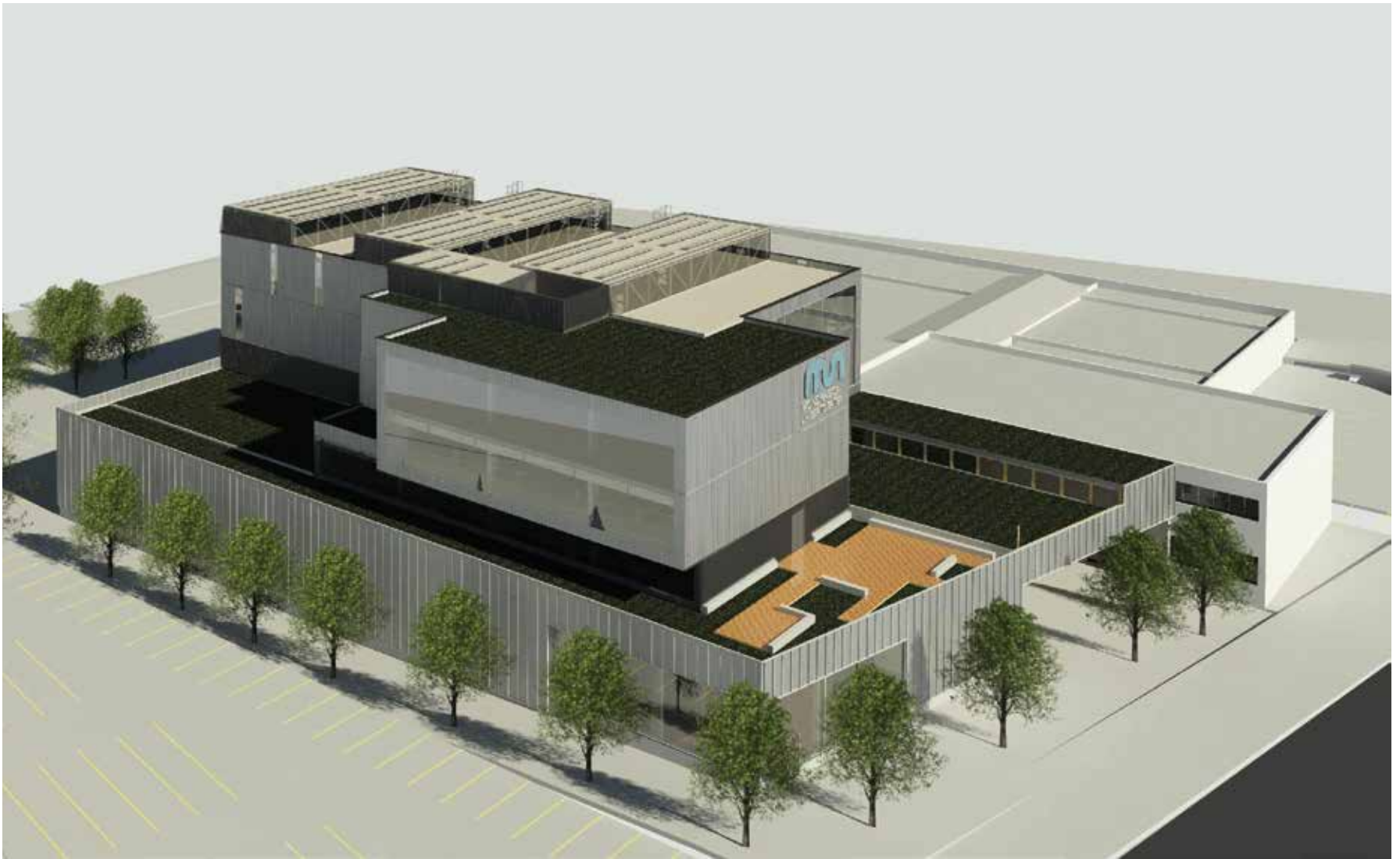
HIREKIN eraikin berriaren 3D proiektzioa