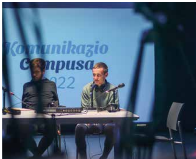
Bigarren edizioko gazteak, lanean.

ASTE BETEKO IRAUPENA IZANGO DU, UZTAILAREN 3TIK 7RA. AURTEN, BIDEO-PODCAST SAIOA SORTU ETA ZABALDU BEHARKO DUTE SAREETAN DBH-4KO ETA BATXILERGOKO LEHEN MAILAKO IKASLEEK.