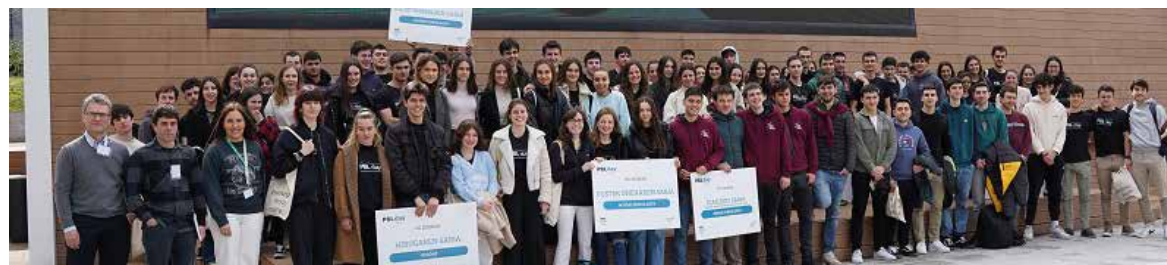
Galarretako Campusean ospatu zen PBL Day 2023.