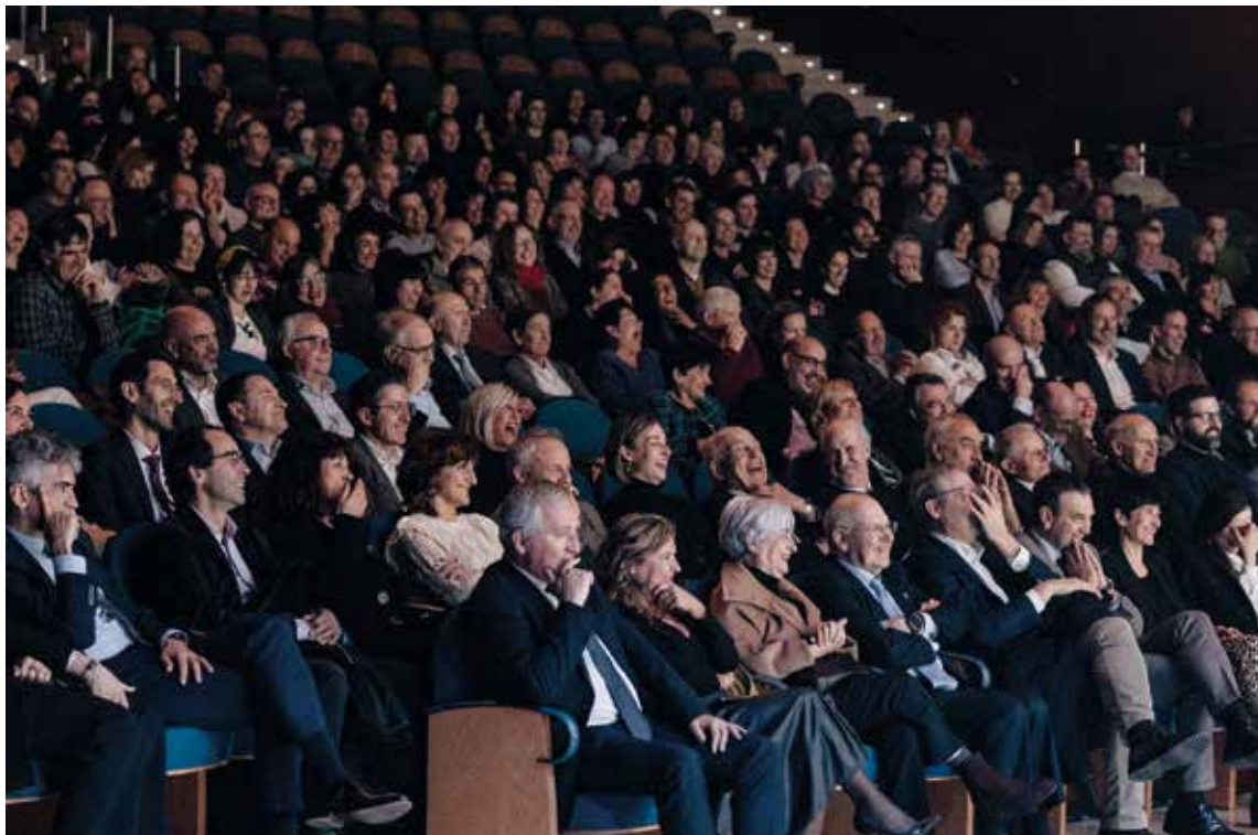
Mondragon unibertsitateak lagun artean ospatu zuen 25. urteurrena.

EHUNKA LAGUN BILDU ZIREN OTSAILAREN 24AN KURSAALEAN MONDRAGON UNIBERTSITATEAK BERE 25. URTEURRENA OSPATZEKO ANTOLATUTAKO EKITALDIAN.