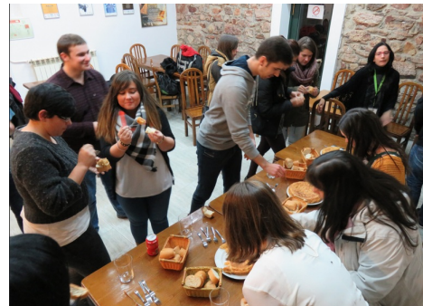
lazko edizioako partehartzaik lana entregatu ondorengo luntxean.

Gainera, aurreko ikasturtean bezala, aurten ere, fakultatean barne lehiaketa ere egin dute eta 13ko zerrenda horretan sartu diren beste hiru bideoak saritu dituzte. Hemen, hiru bideo aukeratuak: