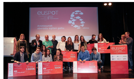
Ganadores de Euspot 2017.

En la presente edición, se han presentado a concurso un total de 51 trabajos. Euspot está organizado por el Ayuntamiento de Aretxabaleta, Arteman Komunikazioa, Arizmendi Ikastola y Mondragon Unibertsitatea, y cuenta con la colaboración de la Diputación Foral de Gipuzkoa.