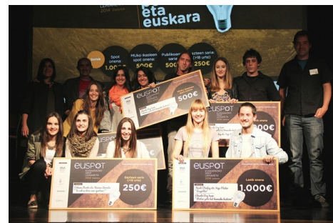
Euspot lehiaketaren hirugarren edizioko irabazleak, sariak jasotzen.

Lehiaketan aurkeztutako lana MUko graduaren 2. mailako Publizitate kanpaina proiektuan egin dute eta iragarkirako propio egindako abesti edo jingle bat du ardatz.