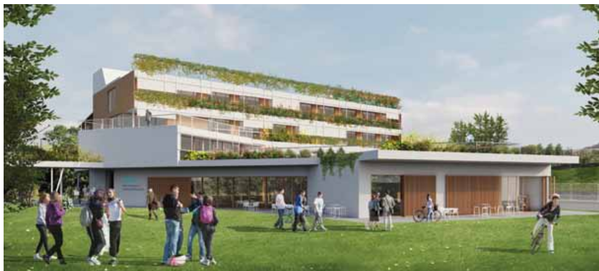
Eskoriatzako campuseko proiektua.

IRAILAREN 21EAN AURKEZTU ZEN HUMANITATE ETA HEZKUNTZA ZIENTZIEK FAKULTATEAREN ESKORIATZAKO CAMPUSA BERRITZEKO PROIEKTU ARKITEKTONIKOA. OBRAK 2019KO URTARRILEAN HASIKO DIRA ETA BUKATUTA EGONGO DIRA 2020-2021 IKASTURTERAKO.