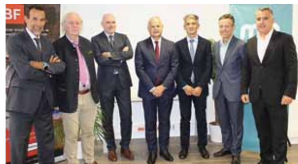
Representantes de APD (Asociación para el progreso de la Dirección), CEBEK (Confederación Empresarial de Bizkaia), el Colegio de Ingenieros Industriales de Bizkaia, el Ilustre Colegio de Abogacía de Bizkaia, el Colegio Vasco de Economistas y Gecemat (Red Profesional de Directivos y Empresarios) y Mondragon Unibertsitatea.

El Máster se centrará en activar los tres ejes de crecimiento de la empresa: clientes, nuevos negocios y estrategia financiera a través de metodologías avanzadas donde se aprenderá haciendo. Asimismo, se trabajarán aspectos relacionados con el talento y las alianzas estratégicas, favoreciendo el intercambio de experiencias reales a través de herramientas diseñadas por Mondragon Unibertsitatea.