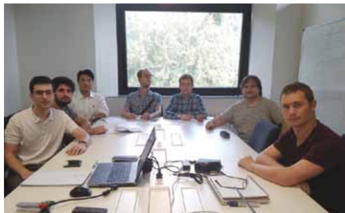
Mondragon Unibertsitatea y DeustoTech colaboran en el proyecto COSNET.

Este proyecto de investigación que se extenderá hasta finales del año 2020 y cuenta con financiación del Ministerio de Economía y Empresa, tiene como objetivo desarrollar herramientas de análisis de estabilidad y técnicas de control que aseguren la estabilidad y la respuesta inercial de las redes híbridas ac/dc del futuro. El consorcio formado por Deusto Tech y Mondragon Unibertsitatea combina una amplia experiencia en los campos de la ingeniería y las matemáticas aplicadas, lo que garantiza un alto impacto socioeconómico de la investigación realizada, así como la experiencia en las herramientas más recientes y competitivas de análisis matemático, control y simulación numérica.