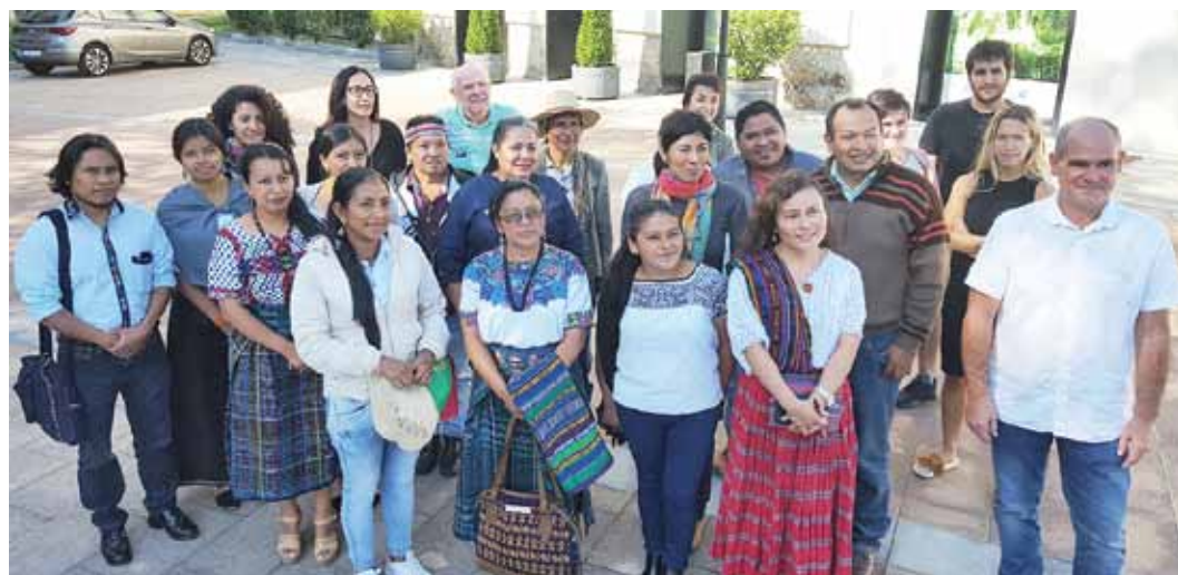
ARGAZKIAN, ikastaroan, parte hartu duten 12 hizkuntza gutxiagotutako 20 ordezkariak.

HASI DA, ARETXABALETAKO CAMPUSEAN, GARABIDE ELKARTEAK ETA MONDRAGON UNIBERTSITATEKO HUMANITATE ETA HEZKUNTZA ZIENTZIEN FAKULTATEAK 4. ALDIZ ANTOLATUTAKO HIZKUNTZA BIZIBERRITZEKO ESTRATEGIAK ADITU TITULUA IKASTAROA.