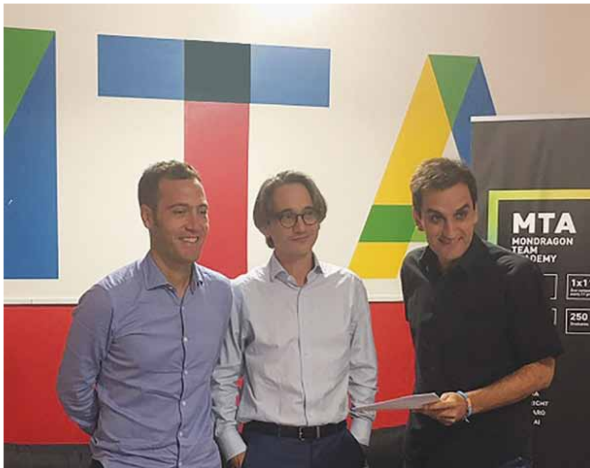
Representantes de MTA en la presentación del proyecto África Basque Challenge.