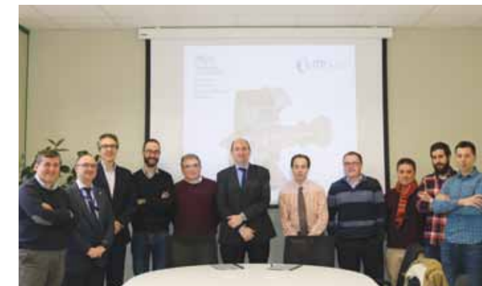
GEPEko eta ITP-AERO enpresako ordezkariak sinaduran.

Además ambos recibieron el reconocimiento como personas referentes por su labor en la red en los últimos 10 años. Asimismo, en la tarde-noche del 20 de enero se celebró la fiesta de gala del 25 aniversario donde en un formato más distendido se acercaron más de 300 personas. 2018 es un año muy especial para Mondragon Team Academy ya que se celebran 10 años desde su inicio. Por lo tanto habrá una programación especial.