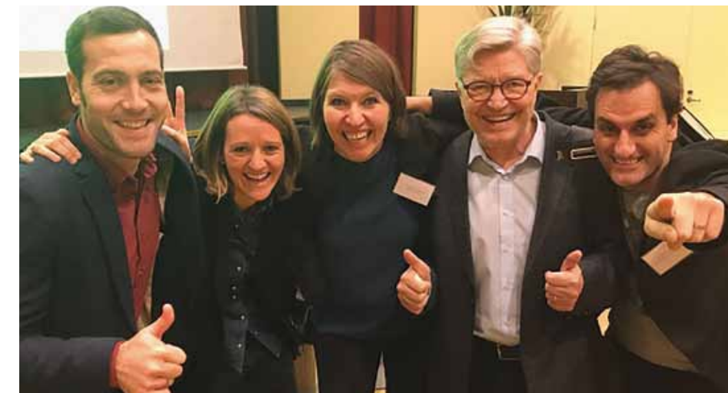
El equipo de Finland Team Academy, en el 25º aniversario.

LOS DÍAS 19 Y 20 DE ENERO DE 2018 SE HA CELEBRADO EN JYVÄSKYLÄ EL 25 ANIVERSARIO DE TEAM ACADEMY FINLAND. UN EQUIPO DE 13 PERSONAS DE LA COMUNIDAD DE MONDRAGON TEAM ACADEMY HAN PARTICIPADO EN LOS EVENTOS PROGRAMADOS.