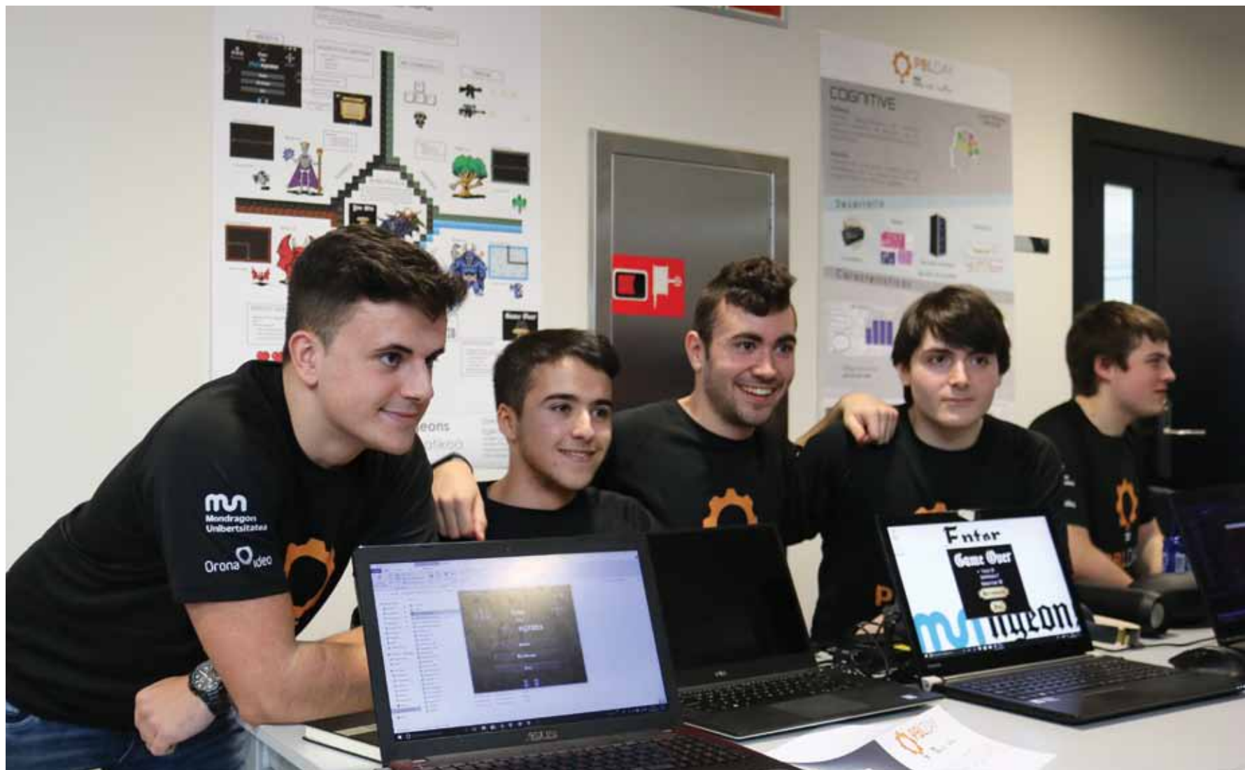
Ikasleek egindako 446 proiektuetatik, 27 PBL aukeratu dira finalista bezala.