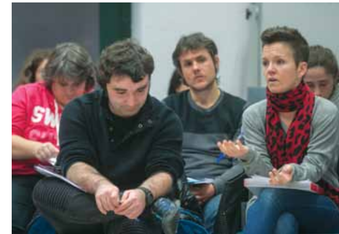
KoopFabrikako parte-hartzaileak hasiera ekitaldian.

KoopFabrika lankidetzan sortuta dago hurrengo erakundekin batera: Olatukoop sarea, Bagara, EHUko GEZKI Gizarte Ekonomia Zuzenbide Kooperatiboaren Institutua eta Deba-goienako Garapen Agentzia, Beterrri-Buruntzako Udalak eta Oarsoaldegarapen agentzia. Gainera, Gipuzkoako Foru Aldundiko Ekonomia Sustapeneko, Landa ingurune eta Lurralde Orekarako Departamentuak babestu eta finantzatu.