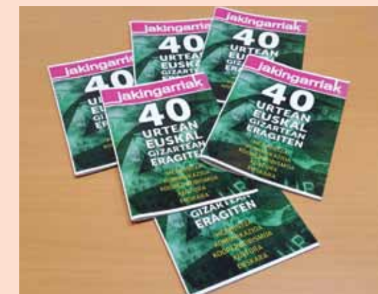
‘Jakingarriak’ es una publicación anual y gratuita.

La revista se creó en 1985, es gratuita y está publicada en euskera. El presente número ha tenido una tirada de 1.300 ejemplares que ya han sido distribuidos a lo largo de todo Euskal Herria. La revista está disponible en la página web de la universidad.