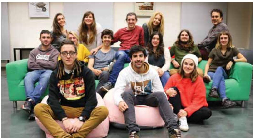
Ikasle taldea irakasle-koordinatzailearekin batera.

Hiru multzotan banatu dira antolaketa arduratuko diren 14 ikasleak: programazio, finantziario eta komunikazio taldea. Oraingo edizioan, 5.000 eurotik gora banatu dituzte saritan.