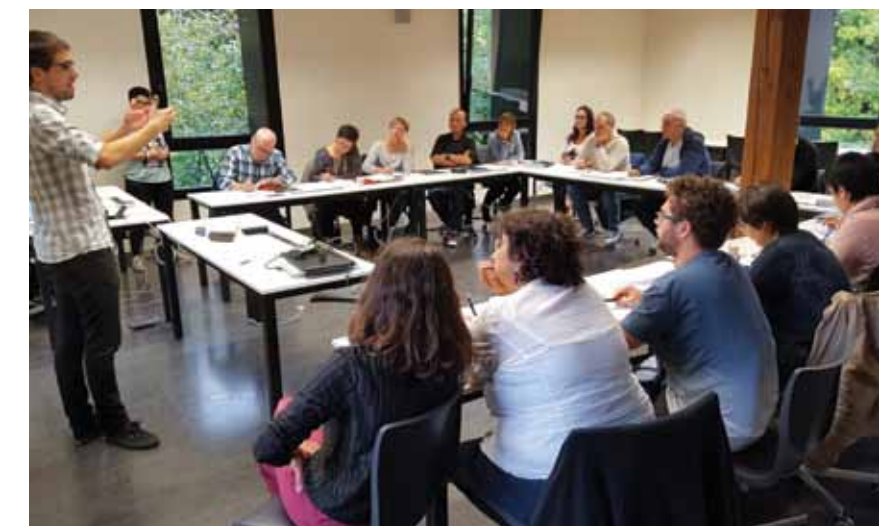
Ikastolen elkarteko taldea komunikazioaren gaineko prestakuntza saioan.

Ikastaroa hasi zen 2017ko urrian eta, guztira, arratsalde osoko bost saio egin zituzten. Humanitate eta Hezkuntza Zientzien Fakultateak antolatutako ikastaroan, AZK komunikazio taldeak ere parte hartu du.