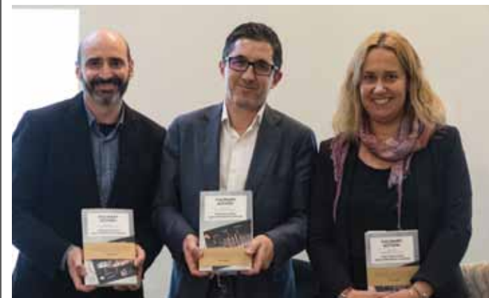
Ekintzaile Gastronómikoen Kasu Errealak aurkeztu dituzte Planeta Gastron.

Ekimen honen bitartez, Basque Culinary Centerrek ekintzaileak elikadura, gastronomiaren sektoreko enpresa proiektu berrien abiaraztean sentsibilizatu, formatu eta babestu nahi ditu. Ideia honetatik abiatu, Culinary Action! talerrek sukaldari eta ostalaritzako beste zenbait profesionalen negozio ezberdinen sustapenean izandako esperientziak jasotzen dituzte.