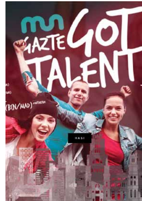
Ehun bat ikasle batu ditu aurtengo lehiaketak.

tzako gradu bakarra Estatuan, eta ikasleek konpetentziak bai unibertsitatean bai enpresan eskuratzeko gaitasuna lantzen dute.