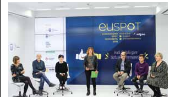
Euspot-en aurkezpen ekitaldia Foru Aldundian.

Euspot lehiaketaren helburua da euskarazko sormena bultzatzea eta ikus-entzunezko publizitate arloan euskararen erabilera sustatzea.