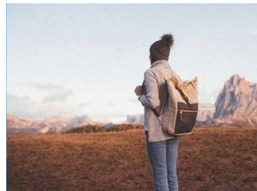
Las mochilas están hechas a mano, en Nepal y con telas ecológicas.

LA MARCA DE MOCHILAS SOSTENIBLES HEMPER, CREADA POR JÓVENES EMPRENDEDORES DE TEAMLABS, HA GANADO LA EDICIÓN ESPAÑOLA DEL GLOBAL STUDENT ENTREPRENEUR AWARDS (GSEA), LA MAYOR COMPETICIÓN MUNDIAL DE EMPRENDEDORES UNIVERSITARIOS, ORGANIZADA POR ENTREPRENEUR'S ORGANIZATION (EO).