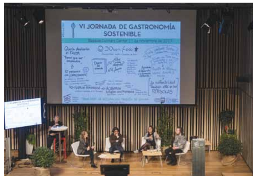
Erreferente diren kasu desberdinak aurkeztu ziren.

Basque Culinary Center - Gastronomía Zientzien Fakultatea | Basque Culinary Centerrek Gastronomia Jasangarriaren VI. jardunaldia ospatu zuen. Jardunaldiaren helburua gastronomia eta sukaldaritza sektoreak suspertu eta hauen prozesuetan jasangarritasun irizpideak gehitzea izan zen. Honen bitartez etorkizuneko chef-ek sukaldaritza jasangarriaren gizarte, ingurugiro eta ekonomia onurak aurkeztu nahi izan zitzaizkien.