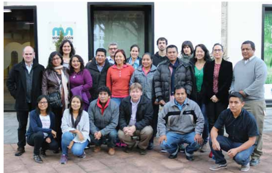
Ikastaroko parte-hartzaileak eta antolatzaileak.

LATINOAMERIKAKO ZORTZI HERRIALDETATIK ETORRITAKO 16 LAGUNEK EGIN DUTE EKONOMIA SOLIDARIOA IKASTAROA. HUMANITATE ETA HEZKUNTZA ZIENTZIEK FAKULTATEKO LANKI KOOPERATIBAGINTZA IKERTEGIAK ETA ALBOAN FUNDAZIOAK ANTOLATU DUTE IKASTAROA.