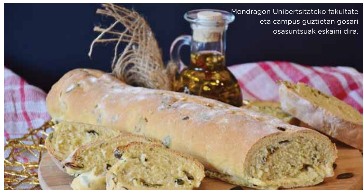
Mondragon Unibertsitateko fakultate eta campus guztietan gosari osasuntsuak eskaini dira.

APIRILAREN HASIERAN, JARDUERA FISIKOAREN ETA OSASUNAREN MUNDU MAILAKO EGUNAK OSPATUKO DIRA, HORI DELA ETA, MONDRAGON UNIBERTSITATEKO KIROL ZERBITZUAK BAT EGINGO DU EGUN HAUEKIN. UNIBERTSITATEKO IKASLE ETA LANGILEENGAN OSASUN OHITURA OSASUNTSUAK SUSTATZEKO ASMOAREKIN, EKIMEN EZBERDINAK ANTOLATUKO DIRA