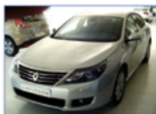
RENAULT LATITUDE dci 150cv Año 2011. 0 Km