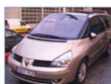
RENAULT GRAND ESPACE dci 175cv Año 2007. 133.000 Km