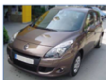
RENAULT SCÉNIC EMOTION dci 105cv Año 2012. 0 Km

Cualquiera de nuestros Vehículos de Ocasión que tenga máximo 24meses: FINÁNCIALO al 0% de interés