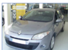
RENAULT MÉGANE DYNAMIQUE 1.9 130cv Año 2011. 13.700 Km