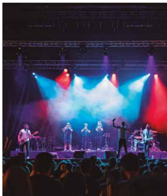
Skakeitan taldea zuzenekoan.

Iluntze gogoangarri bat bizitzeko aukera izan zuten bertaratutako guztiek, eta taldeen jarrera paregabeak ere horretara lagundu zuen. Eskerrik asko guztioi!