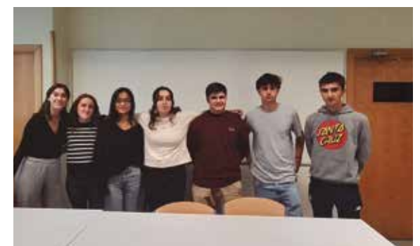
Birziklapena lantzen dabilen taldea.

2024erako birziklapen tasa totala lortzea dugu helburu nagusizat, eta hori bete ahal izateko urtez urte helburu txikiagoak jarri dizkiogu gure buruari, epe motzean egingarriagoak direnak.