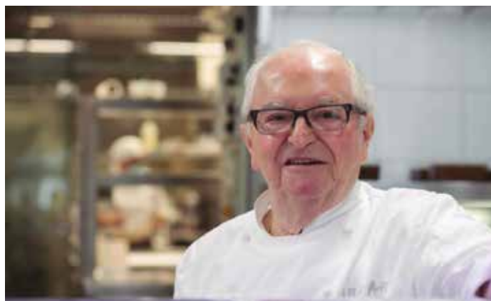
Juan Mari Arzak, ohorezko patroia berria.