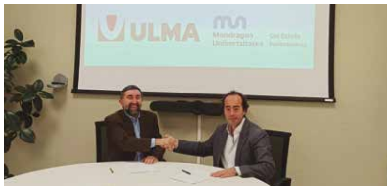
ULMAko eta Goi Eskola Politeknikoko ordezkariak akordioa sinatu dute.

Goi Eskola Politeknikoa | Goi Eskola Politeknikoak eta ULMA Taldeak epe luzerako lankidetzaz zientifiko-teknologikorako hitzarmena sinatu dute, prestakuntza, ikerketa eta transferentzia programa bat abian jartzeko. Akordio horrek ezagutza teknologikoaren, ezagutzaren trukearen eta transferentziaren arloetan lankidetzaz sustatzen du, bai eta ULMAREN eraginkortasuna eta lehiakortasuna epe labur eta luzera hobetzeko elkarlaneko jardueren sustapena ere. Testuinguru horretan, talentua kudeatzeko jarduerak eta programak jarriko dira abian, eta ULMAREN eta Eskola Politeknikoaren arteko jarduerak koordinatuak