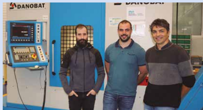
EKOPROP proiektuko partaideak.

Errendimendu Handiko Mekanizazio ikerketa taldeak ibilbide luzea du aeronautika sektoreko ikerketa eta transferentzia proiektuetan. Haien ibilbideak legitimatzen ditu EKOPROP proiektuaren funtsezko atal bihurtzeko, eta proiektu hori funtsezkoa izango da aeronautika industriaren etorkizun iraunkorrean.