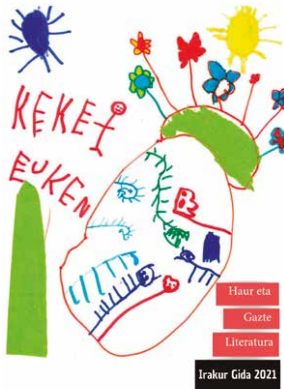
2021eko gidaren azala.

1990. urtean hasi ziren Mondragon Unibertsitateko Humanitate eta Hezkuntza Zientzien Fakultateko Haur Liburu Mintegiko kideak literatura gida kaleratzen. Proiektua elkarlanean egiten dute fakultateko arduradunek, Debagoieneko udal liburutegiko eta ibarreko ikastetxeetako irakasleekin batera. 2001. urtetik aurrera argitaratutako zenbaki guztiak daude sarean, denon eskura.