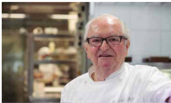
Juan Mari Arzak, el nuevo patrono de honor.