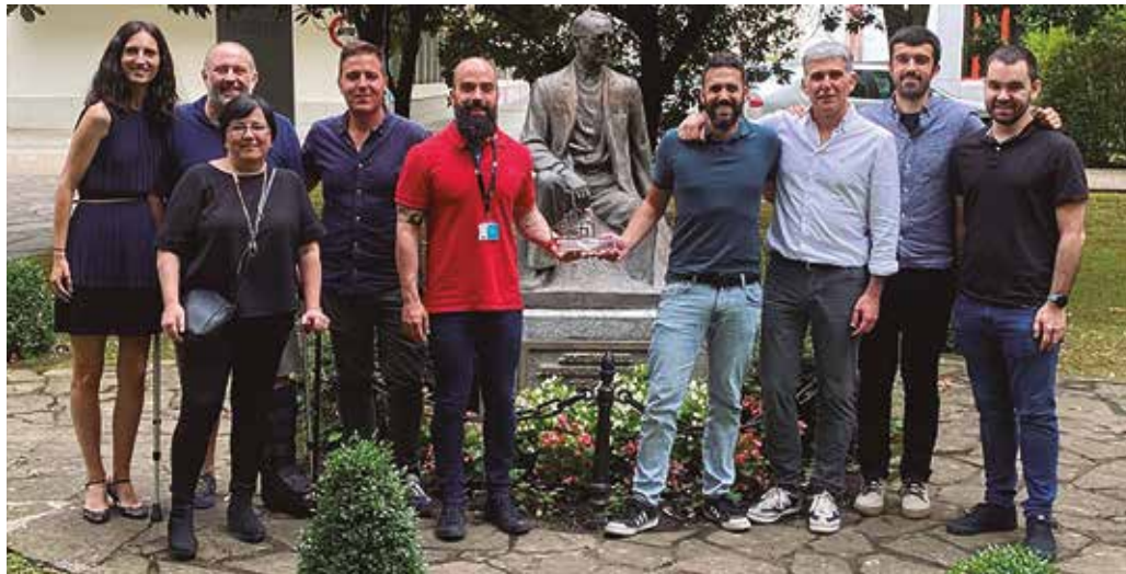
Robtrusion osatzen duen taldeak pozik jaso du saria.

GOI ESKOLA POLITEKNIKOAK ETA IRURENA GROUPEK ELKARREKIN GARATZEN ARI DIREN PROIEKTUA TORIBIO ECHEVERRIA SARIETAN AITORTUA IZAN DA. IKEKERTA POROIEKTU BAT BEZALASA MARTXAN AJRRI ZENA ZAZPI PERTSONEK OSATUTAKO STARTUP BAT DA GAUR EGUN