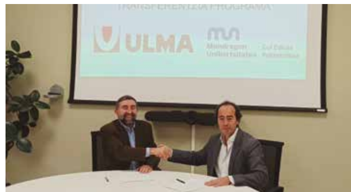
Representantes de ULMA y la Escuela Politécnica Superior han formalizado el acuerdo.

Escuela Politécnica Superior | La Escuela Politécnica Superior y el Grupo ULMA han firmado un acuerdo de colaboración científico-tecnológica a largo plazo, para la puesta en marcha de un programa de formación, investigación y transferencia. Dicho acuerdo promueve la colaboración en los campos del conocimiento tecnológico, el intercambio y la transferencia de conocimiento y la promoción de actividades conjuntas que redunden en la mejora a corto y largo plazo de la eficiencia de ULMA y de su competitividad. En dicho contexto se pondrán en marcha actuaciones y programas para la gestión del talento y se fomentarán actividades coordinadas entre ULMA