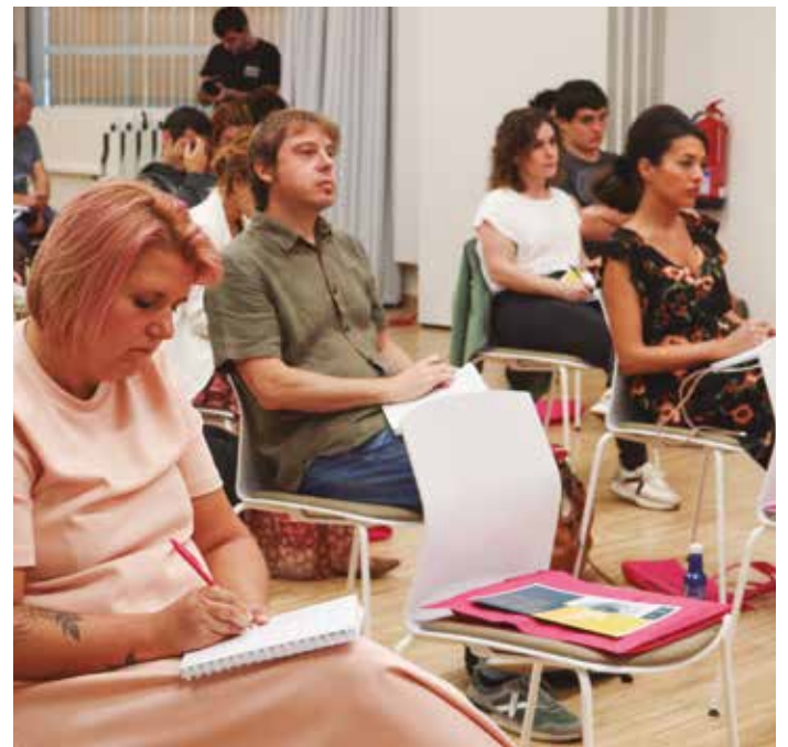
Jardunaldia Eskoriatzako campusean egin zen.

'HAU DA MARKA! NOLA BEREIZTU ZURE IKASTETXEAREN MARKA?' JARDUNALDIAN, PARTE-HARTZAILEEK JORRATU DITUZTE MARKAK IKASTETXEETAN DUEN GARRANTZIAREKIN LOTUTAKO HAINBAT ALDERDI.