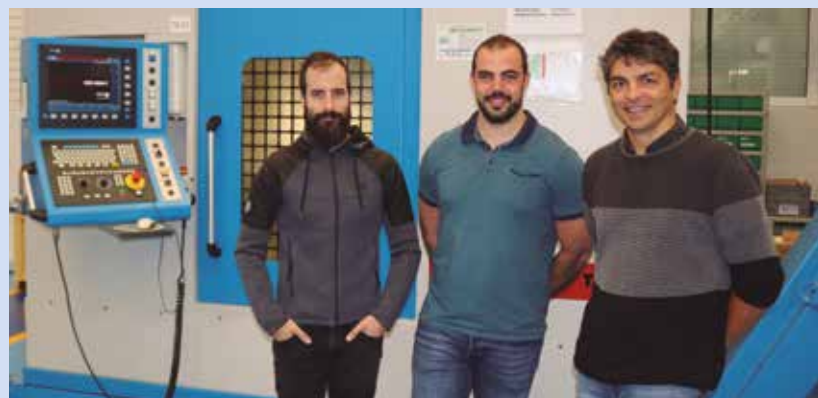
Los participantes del proyecto EKOPROP.

El grupo de investigación de Mecanizado de Alto Rendimiento tiene una larga trayectoria en proyectos de investigación y transferencia en el sector aeronáutico. Su trayectoria les legitima para convertirse en una parte fundamental del proyecto EKOPROP, que está llamado a ser clave en el futuro sostenible de la industria aeronáutica.