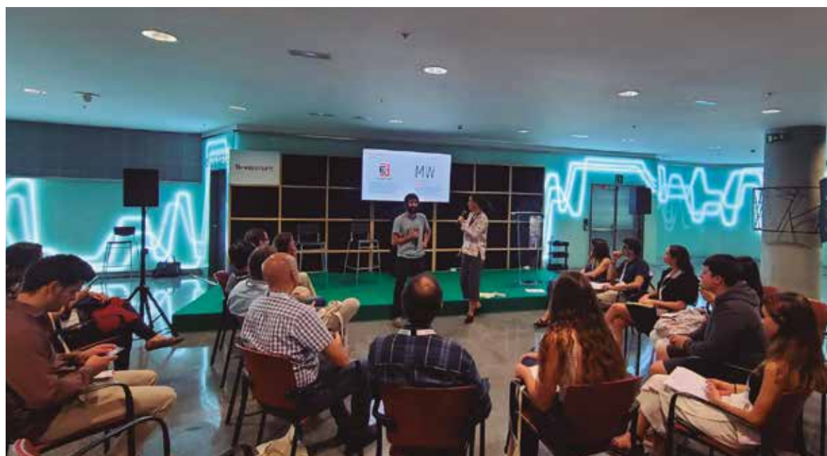
Euskaldunan egindako ekitaldiren argazki bat.

URRIAREN 18 ETA 19AN EGIN ZEN B-VENTUREREN 2022KO EDIZIOA BILBOKO EUSKALDUNA JAUREGIAN. TAILER, STAND, PONENTZIA ETA MAHAI-INGURU EZBERDINAK IZAN ZIREN, EMAKUME EKINTZAILE INBERTSORE ETA ERAKUNDEEN TOPALEKU BILAKATUZ.