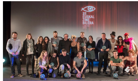
Ganadores del certamen Zinebilera 2014