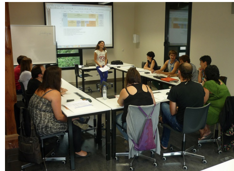
El curso tendrá lugar en el Bilbao Berrikuntza Faktoria.

Después de dos ediciones impartidas en Debagoiena, Gipuzkoa, el curso experto se desplazará a Bilbao. Más concretamente, a la sede que Mondragon Unibertsitatea tiene en pleno centro de la capital, en la calle Uribitarte 6. Las clases presenciales que se impartirán en Bilbao Berrikuntza Faktoria, comenzarán el 2 de octubre del presente 2014.