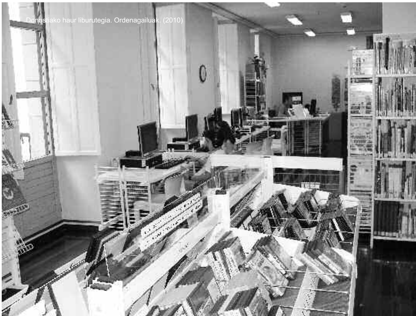
Donostiako haur liburutegia. Ordenagailuak. (2010)

Euskaraz eta gaztelerazko funtsak ugariak izaki, bada dira obrak beste hainbat hizkuntzetan ere: katalanez, galegoz, ingelesez, frantsesez, alemanez, italieraz, portugesez, errumanieraz, txinerak eta arabieraz, alegia. Horiek, liburutegiak kulturarteko zerbitzu izateko duen asmoa agerian uzten dute