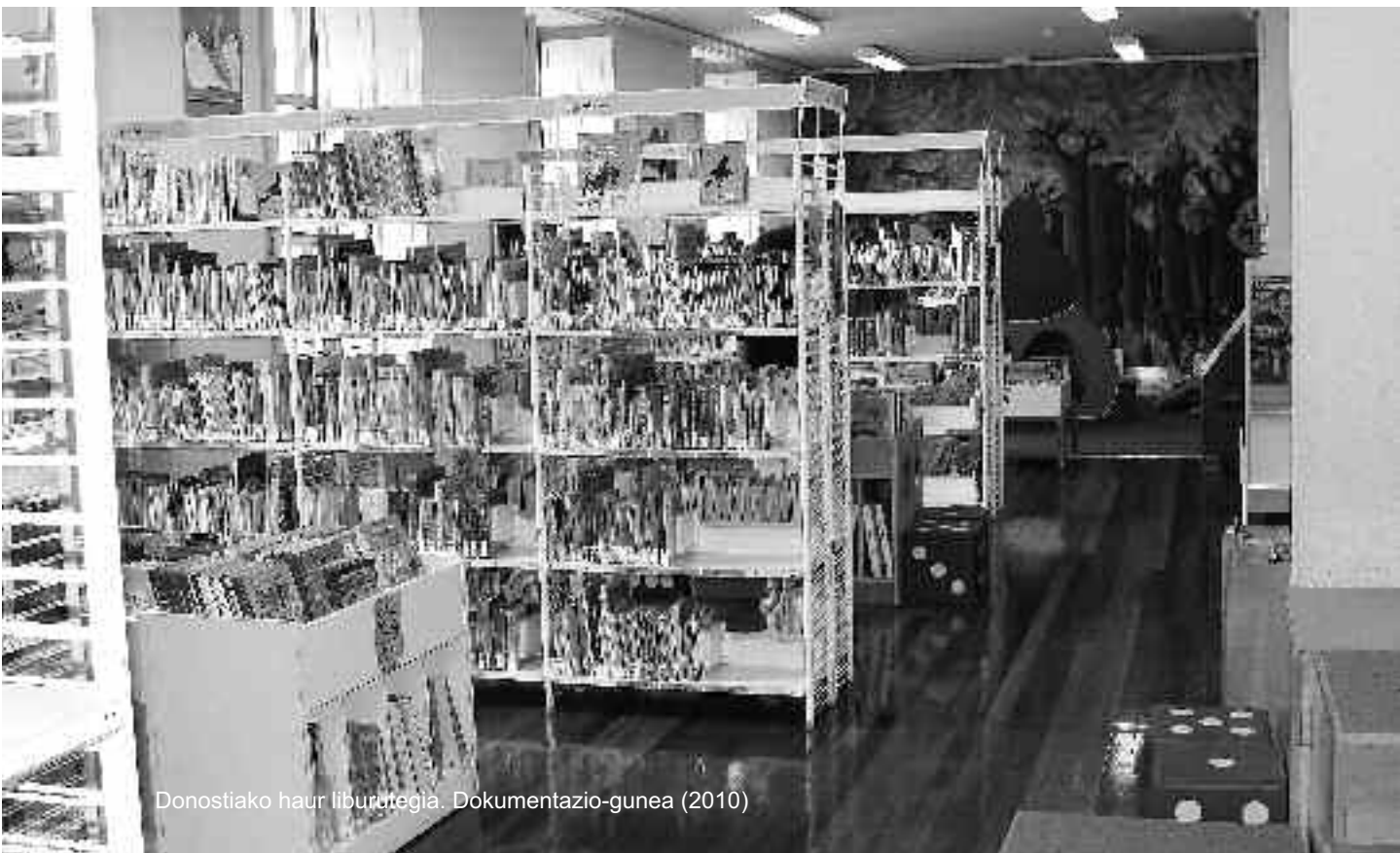
Donostiako haur liburutegia. Dokumentazio-gunea (2010)