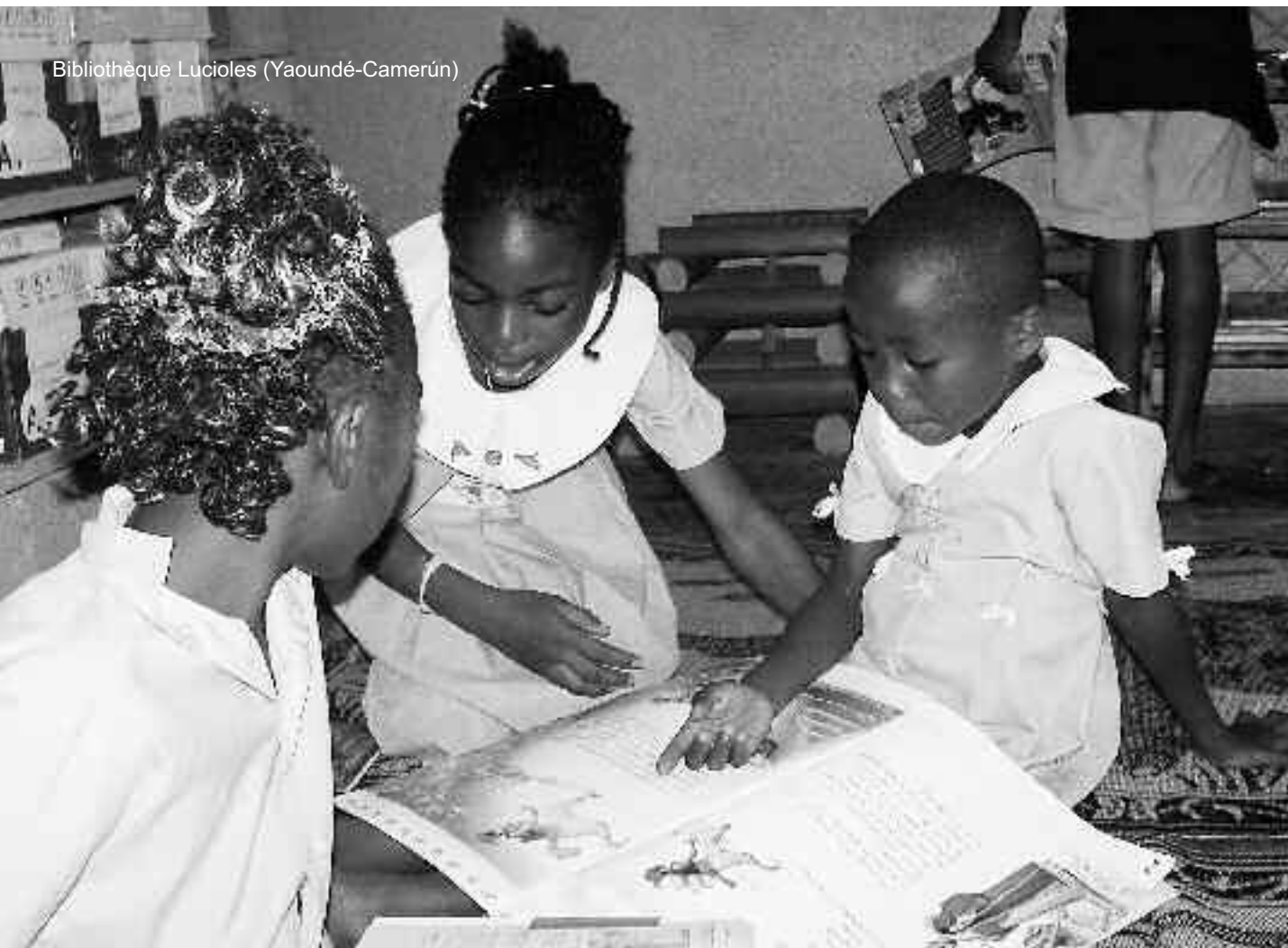
Bibliothèque Lucioles (Yaoundé-Camerún)

pizten nire barnean. Etxean ere, egia esan, gurasoek ez zuten asko irakurtzen, eta horrek imajinatzen dut nigan eragina izango zuela.” (Julene Etxedona)