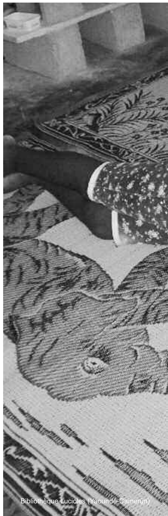
Bibliothèque Lucioles (Yaoundé-Camerún)

Lola Lara; Carbonell (2010). Entrevista a Ángel Gabilondo. Cuadernos de Pedagogía , 399, 49. or.