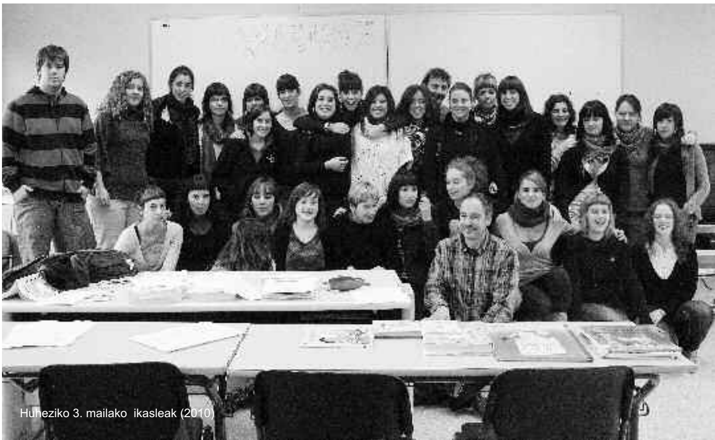
Huheziko 3. mailako ikasleak (2010)

Etxean hainbat liburu nituen eta mota guztietakoak ziren. Batzuk hitzez beteriko liburuak ziren, beste batzuek marrazki gutxi batzuk ere bazituzten, baina niri gehien gustatzen zitzaizkidanak hiru dimentsioko liburuak ziren. Lehen aldiz horrelako liburu bat zabaldu eta bertatik irteten zen objektuak aurpegian laztan egin zidanean, inoiz ikusiriko libururik zoragarrienak zirela pentsatu nuen