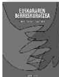
Garabide Elkarte (2010). Euskararen berreskuratzea: Hizkuntzak biziberritzeko gako batzuk. Donostia: Garabide Elkarte.

Mondragon Unibertsitateko Humanitate eta Hezkuntza Zientzien Fakultatea