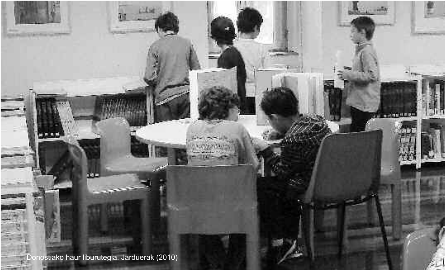
Donostiako haur liburutegia. Jarduerak (2010)