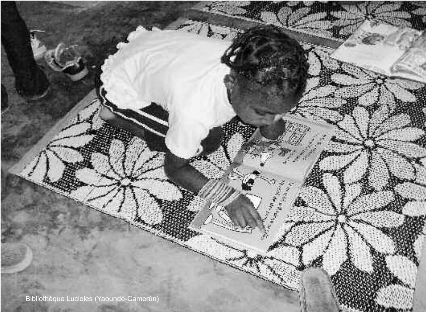
Bibliothèque Lucioles (Yaoundé-Camerún)