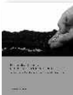
Azkarraga, J. (2010). Hezkuntza, gizartea eta eraldaketa kooperatiboa. Zenbait gogoeta, Gizabidea Fundazioaren hausnarketa estrategikorako.

Jada topikoa da hezkuntzaren krisiaz hitz egitea. Badira gutxienez bi hamarkada krisi horretaz hitz egiten dela. Berdin hitz egiten dute horretaz hezkuntza-munduz kanpoko eragileek eta hezkuntzako eragileek beraiek. Gai horrek hamaika analista, pedagogo, soziologo, politikoa eta psikologori eman dio jaten.