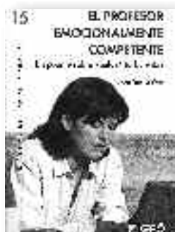
Vaello Orts, J. (2009). El profesor emocionalmente competente. Un puente sobre "aulas" turbulentas. Barcelona: Graó

Irakaslearen rolaz mintzo garenean, nabarmendu ohi dugu lan konplexu, aberatsa, grinatsua, gero eta konplexuagoa, aberatsagoa eta grinatsuagoa dela. Hain zuzen, lan honen xede nagusia ikasleen trebakuntza integrala lortzea da, etengabe aldatzen ari den XXI. mendeko gizartearen baitan, horrek eskola-markoan isla zuzena duela: ikasle ezberdinak, jatorri anitzekoak, nahi, aspirazio, kompetentzia eta aurreko esperientzia desberdinak dituztenak, eta, gainera, ingurune ezberdinetan biziko direnak.