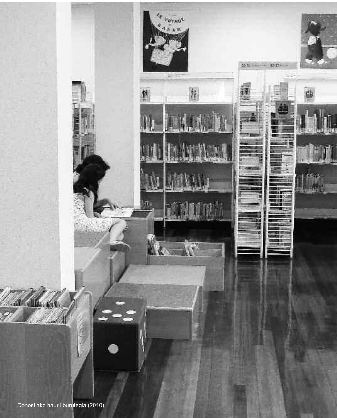
Donostiako haur liburutegia (2010)