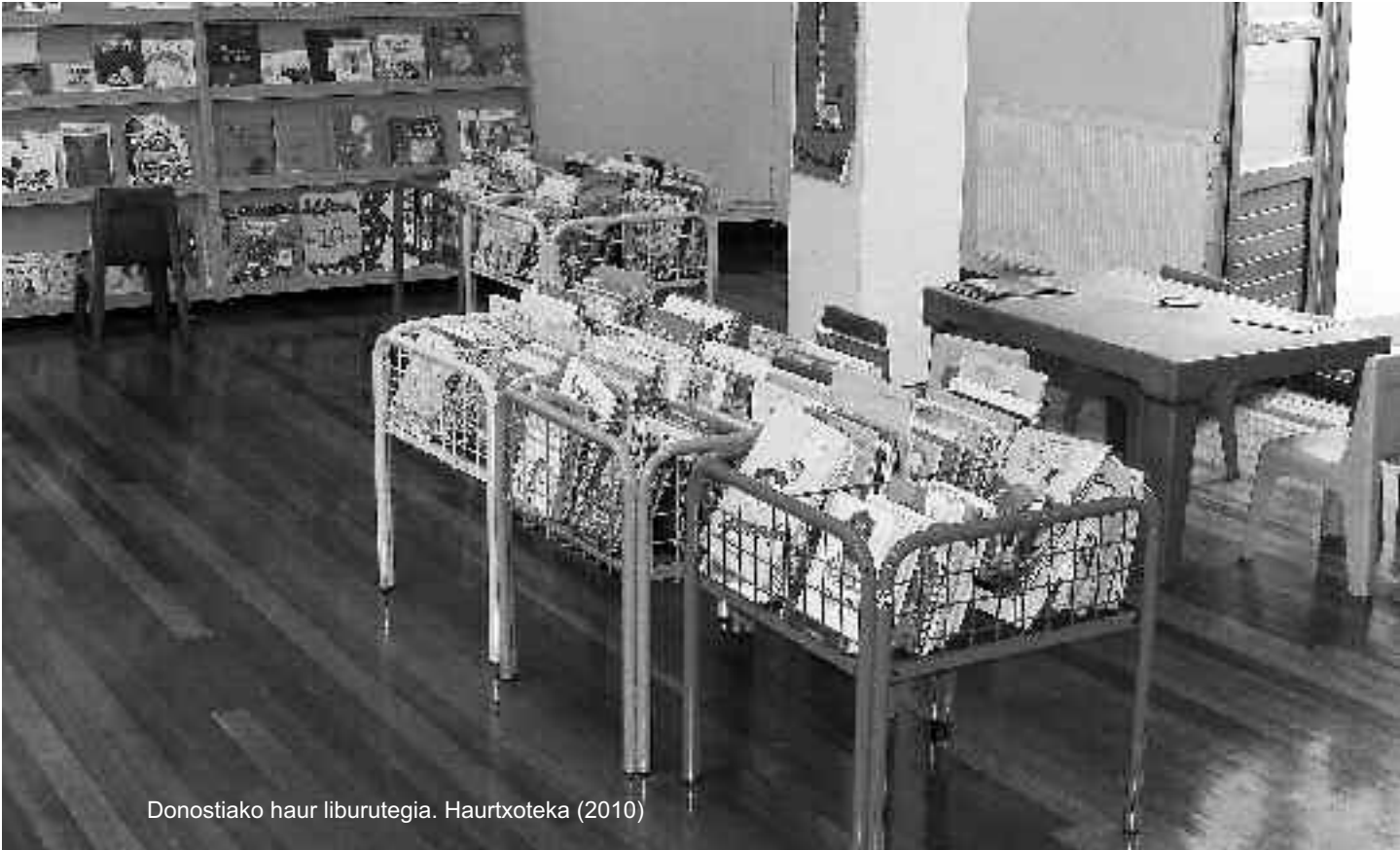
Donostiako haur liburutegia. Haurtxoteka (2010)