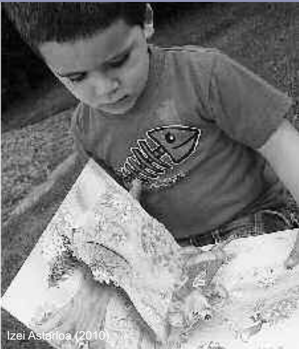
Izei Astarloa (2010)