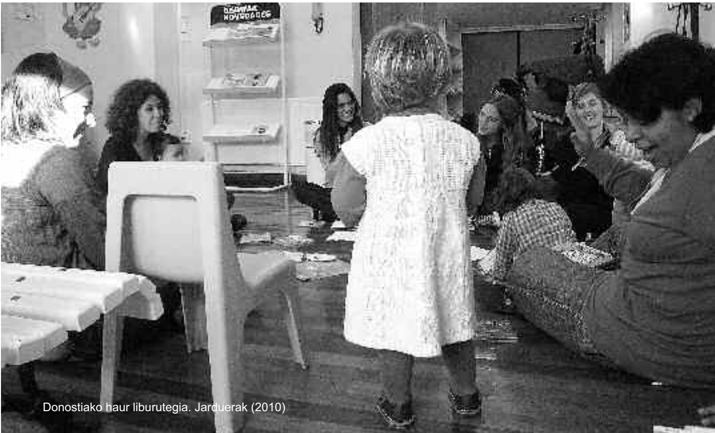
Donostiako haur liburutegia. Jarduerak (2010)