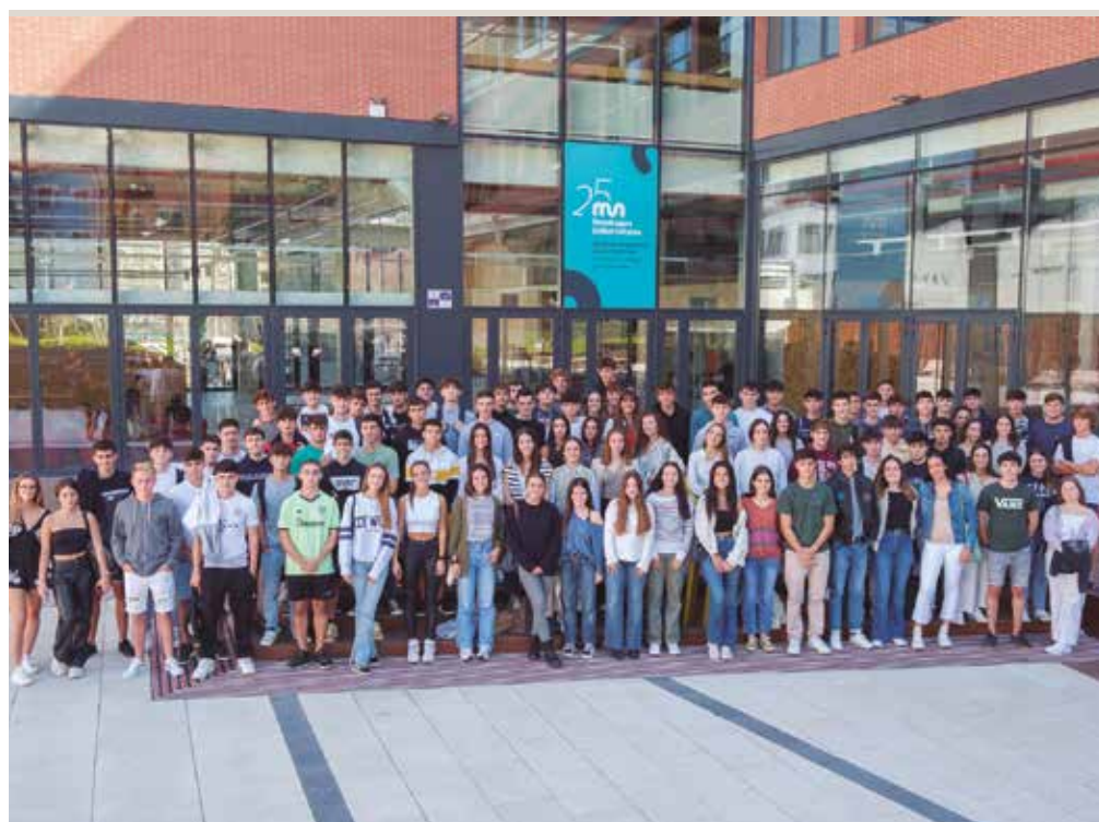
Alumnos y alumnas de gestión del talento de la Facultad de Empresariales.

LA FACULTAD DE EMPRESARIALES DE MONDRAGON UNIBERTSITATEA ARRANCA EL CURSO CON ALREDEDOR DE 360 NUEVOS ALUMNOS Y ALUMNAS EN EL ÁMBITO DE TALENTO PARA LA GESTIÓN, CORRESPONDIENTES A ESTUDIOS DE GRADO Y MÁSTER