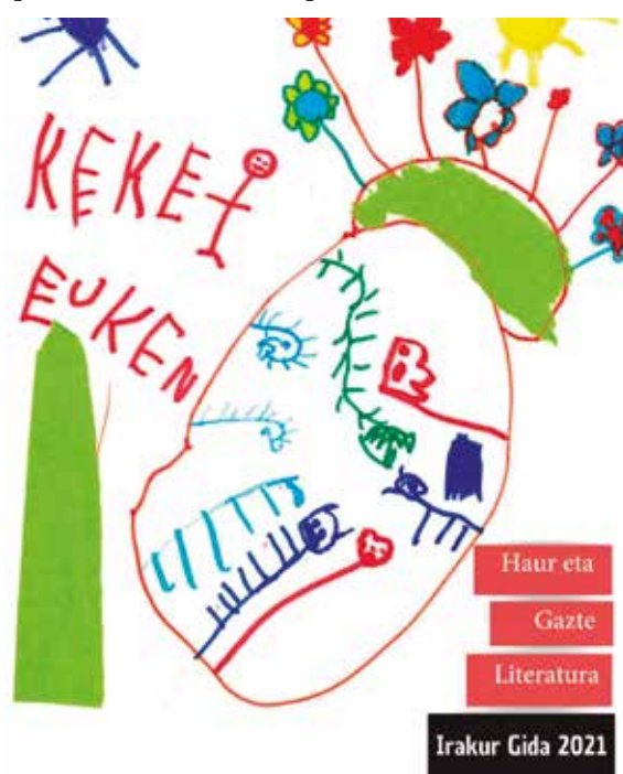
Portada de la guía de 2021.

bibliotecas municipales y los centros escolares de Debagoiena. Todos los números publicados a partir de 2001 están disponibles en la red.