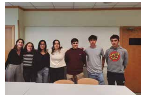
El grupo que trabaja en el reciclaje.

¿Cómo será esta nueva estructura? Nuestro principal objetivo es mejorar el reciclaje y creemos que para ello tenemos que poner en marcha una nueva normativa. Todavía tenemos algunas cosas por definir y ese es el trabajo que tenemos por hacer hasta enero. Nuestro objetivo principal es alcanzar una tasa total de reciclaje para 2024, y para poder cumplirlo nos hemos marcado año tras año unos objetivos menores, más factibles a corto plazo.