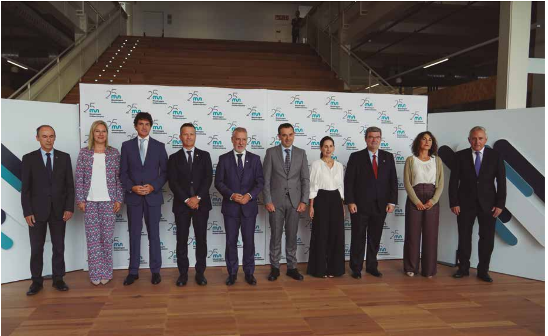
En el acto que se celebró en el campus de Bilbao AS Fabrik participaron diferentes representantes.