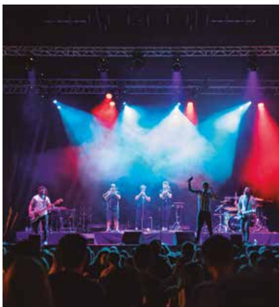
El grupo Skakeitan en el directo.

Todos los presentes tuvieron la oportunidad de vivir una velada memorable, a la que también contribuyó la actitud impecable de los grupos. ¡Gracias a todos!