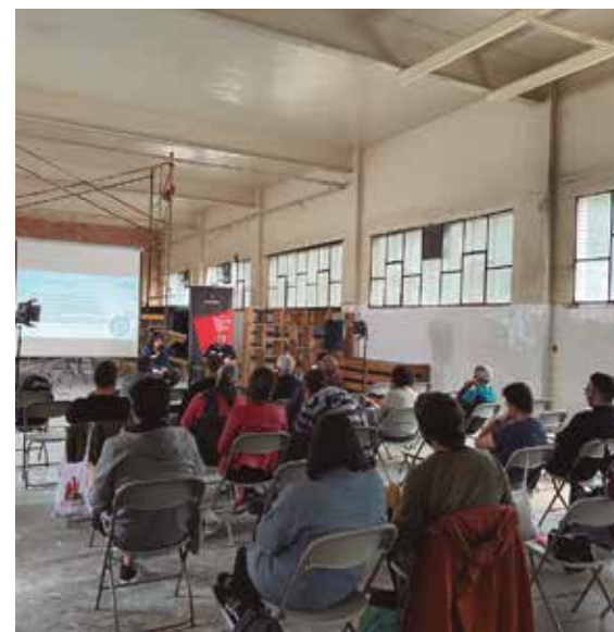
Jornada celebrada en Biziola de Lazkao.