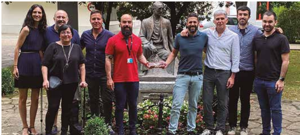
El equipo que forma Robtrusion ha recibido el premio con satisfacción.

EL PROYECTO QUE ESTÁN DESARROLLANDO CONJUNTAMENTE LA ESCUELA POLITÉCNICA SUPERIOR E IRURENA GROUP HA SIDO RECONOCIDO EN LOS PREMIOS TORIBIO ECHEVERRÍA. LO QUE SE PUSO EN MARCHA COMO UN PROYECTO DE INVESTIGACIÓN ES UNA STARTUP FORMADA POR SIETE PERSONAS