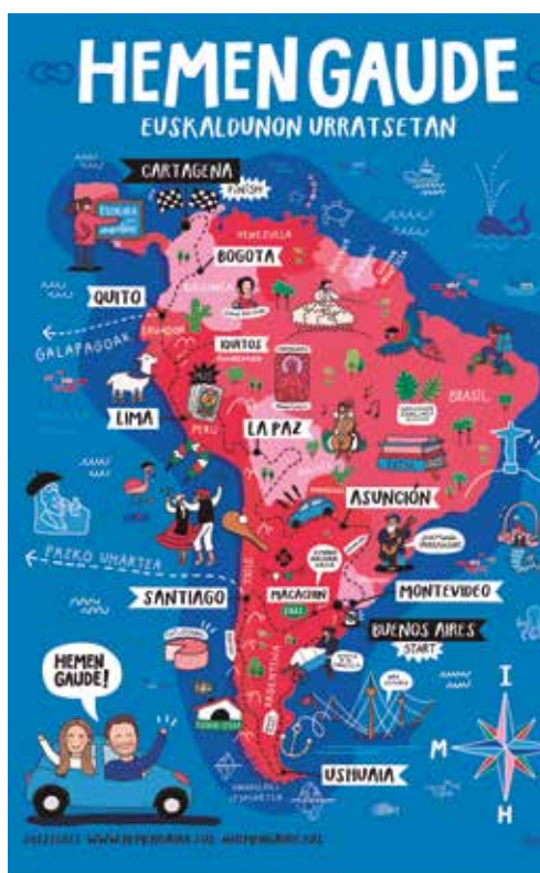
El cartel de la aventura.