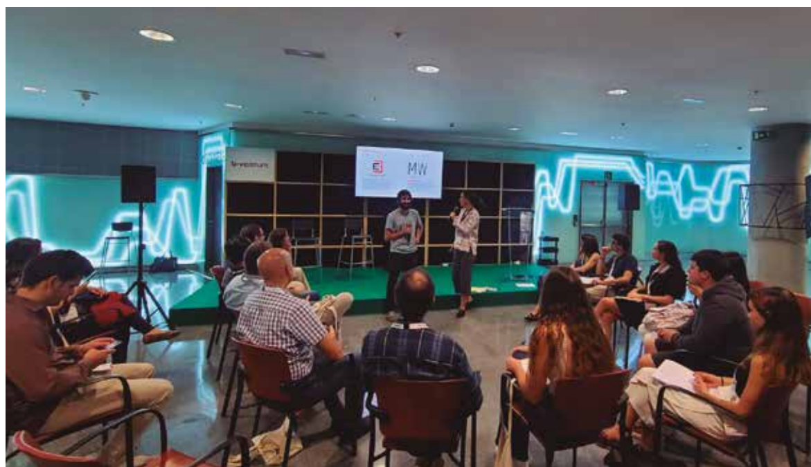
Una foto de los actos celebrados en el Euskalduna.

LOS DÍAS 18 Y 19 DE OCTUBRE SE CELEBRÓ LA EDICIÓN 2022 DE B-VENTURE EN EL PALACIO EUSKALDUNA DE BILBAO. SE CELEBRARON TALLERES, STANDS, PONENTIAS Y MESAS REDONDAS, CONVIRTIÉNDOSE EN UN LUGAR DE ENCUENTRO DE MUJERES EMPRENDEDORAS INVERSORAS E INSTITUCIONES.