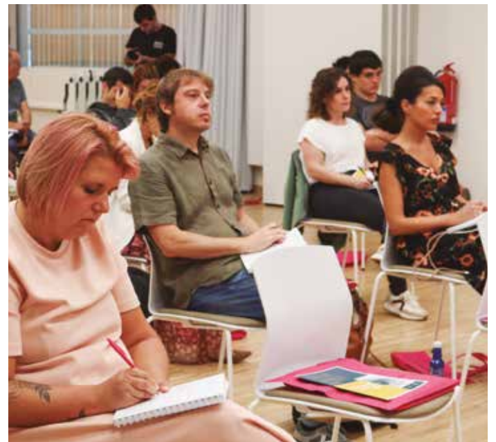
La jornada se desarrolló en el campus de Eskoriatza.

EN LA JORNADA '¡ESTE ES EL RETO! CÓMO DIFERENCIAR LA MARCA DE TU CENTRO ESCOLAR', LOS PARTICIPANTES HAN ABORDADO DIFERENTES ASPECTOS RELACIONADOS CON LA IMPORTANCIA DE LA MARCA