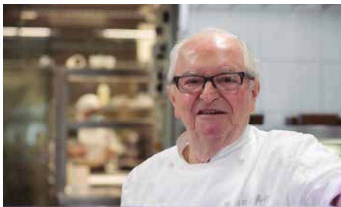
Juan Mari Arzak, el nuevo patrono de honor.