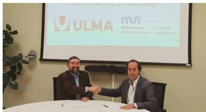
Representantes de ULMA y la Escuela Politécnica Superior han formalizado el acuerdo.

Escuela Politécnica Superior | La Escuela Politécnica Superior y el Grupo ULMA han firmado un acuerdo de colaboración científico-tecnológica a largo plazo, para la puesta en marcha de un programa de formación, investigación y transferencia. Dicho acuerdo promueve la colaboración en los campos del conocimiento tecnológico, el intercambio y la transferencia de conocimiento y la promoción de actividades conjuntas que redunden en la mejora a corto y largo plazo de la eficiencia de ULMA y de su competitividad. En dicho contexto se pondrán en marcha actuaciones y programas para la gestión del talento y se fomentarán actividades coordinadas entre ULMA