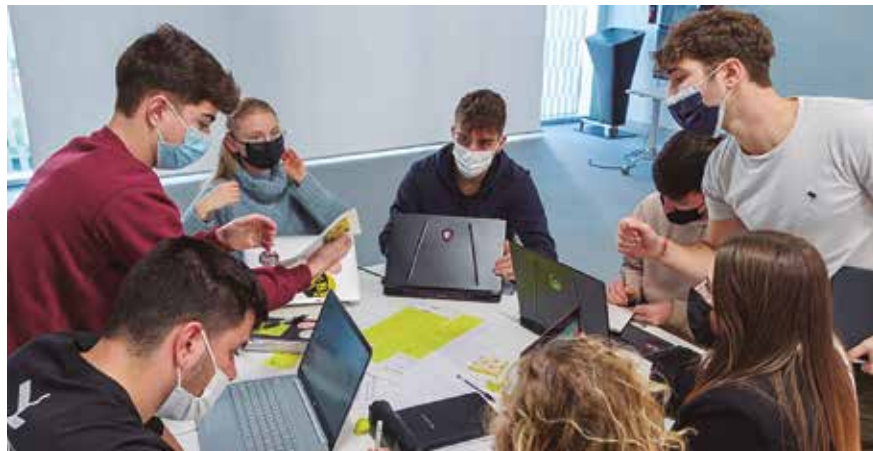
Leinners del laboratorio de Irun.

Un total de 70 personas emprendedoras en equipo de diferentes laboratorios del LEINN conocieron de primera mano el caso de la empresa Koiki: que actualmente se encuentra presente en 18 provincias españolas, con 60 microcentros