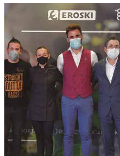
Tres alumni fueron premiados.