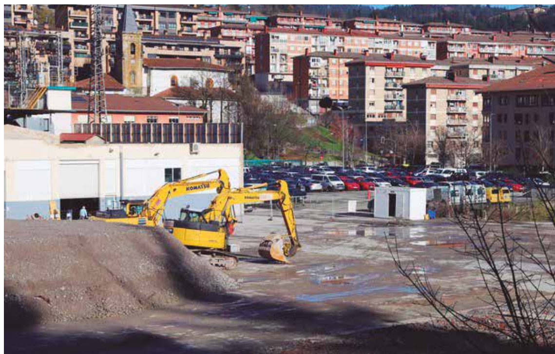
Gautxori eremuko lanak.

GAUTXORI EREMUAREN URBANIZAZIO LANAK AURRERA DIHARDUTE, 2023KO IRAILERAKO BUKATZEKO AURREIKUSPENAREKIN. BERTAN KOKATUKO DA MONDRAGON UNIBERTSITATEAREN HIREKIN PROIEKTUA, EKINTZAILETZA TEKNOLOGIKOAREN BITARTEZ INDUSTRIAREN EMISIOAK MURRIZTERA BIDERATUTAKO DA PROIEKTU BERRIA.