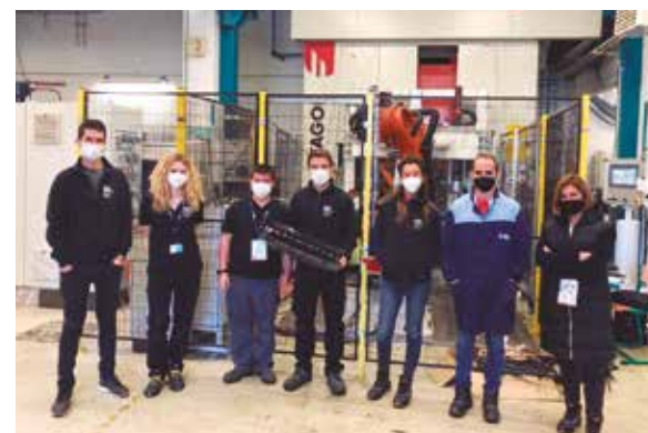
Elkarlanean ari da garatzen proiektua.

LAY2FORMeko diziplina anitzeko bazkideen osagarritasuna lau dimentsioetan lan egiteko erabili da; materialen, prozesuen, sistemen eta produktuen ingeniaritzan.