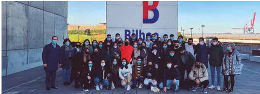
Estudiantes del grado Business Data Analytics en el Puerto de Bilbao.

ALUMNADO DEL GRADO EN BUSINESS DATA ANALYTICS (BDATA) PRESENTAN SUS PREDICCIONES AL PUERTO DE BILBAO SOBRE LA ACTIVIDAD EN 2022