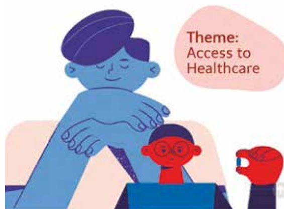
Imagen del evento Africa Basque Challenge.