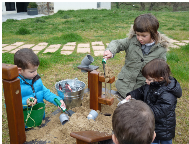
Irudia ~ Haurrak elementu naturalekin jolasten. Iturria ~ Mondragon Unibertsitatea - HUHEZI.

Rubin, K.H. (2001): The P-lay Observation Scale (POS) (Revised) , University of Maryland, College Park, MD.