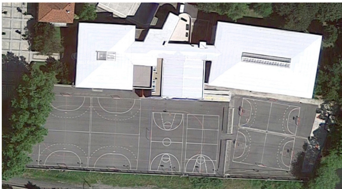
Irudia - Eskoletako ohiko kanpo-espazioa.

Ikerlan honetako lehenengo helburua zen Haur Hezkuntzako kanpo-espazioaren diseinua ezagutzea eta kalitate orokorraren lehen hurbilpen bat egitea. Horretarako, lehenik eta behin, ikastetxeetako kanpo-espazioaren analisi deskriptiboa egin zen. Kanpo-espazioko jolastokiaren diseinua batez ere gehiengoaren kiroletara bideratua zegoen eta futbol eta saskibaloiko zelaiak (% 68) nabarmentzen ziren. Batez ere mutilek, futboleko jolasean ari zirenean, sarri jolastokiaren zatirik handiena erabiltzen zuten gainerako haurrei erakargarritasun gutxiago zuten eremuetan jolastera behartuz, jolas ezberdinetarako baliabide eta aukera eskasekin. Kanpo-espazio batzuek ematen zuten aukera bestelako materialekin jolasteko (% 55.6). Hala ere, gutxitan aurkitu ziren haurren interesari erantzuteko material osagarriak, hondarrarekin jolasteko (% 5.6) edo marrazkiak egiteko (% 5.6) esaterako. Era berean, oso gutxitan (% 16.7) ikusi ziren elementu naturalekin aritzeko aukerak.