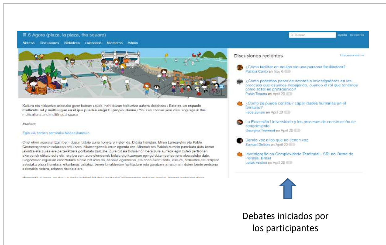
Figura 2. Un espacio emergente en el que seguir escribiendo el libro