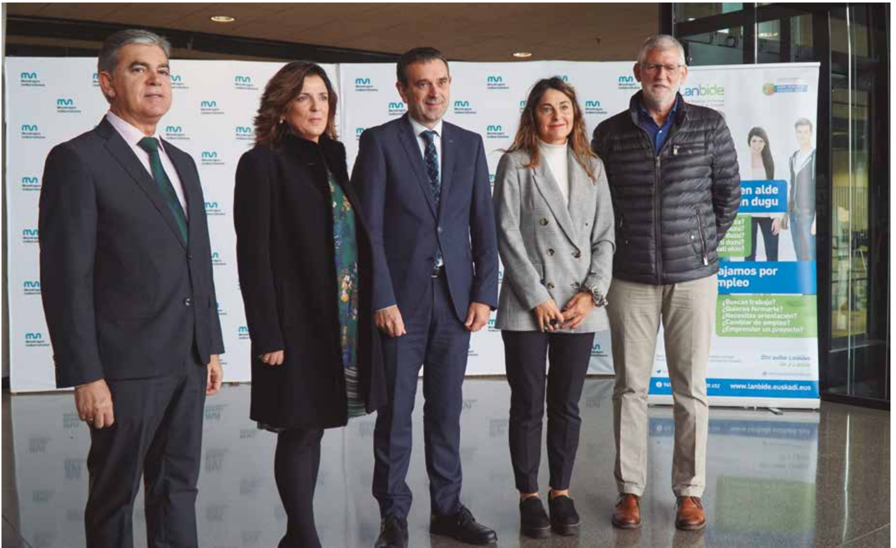
Mondragon Unibertsitateko eta Lanbideko ordezkariak