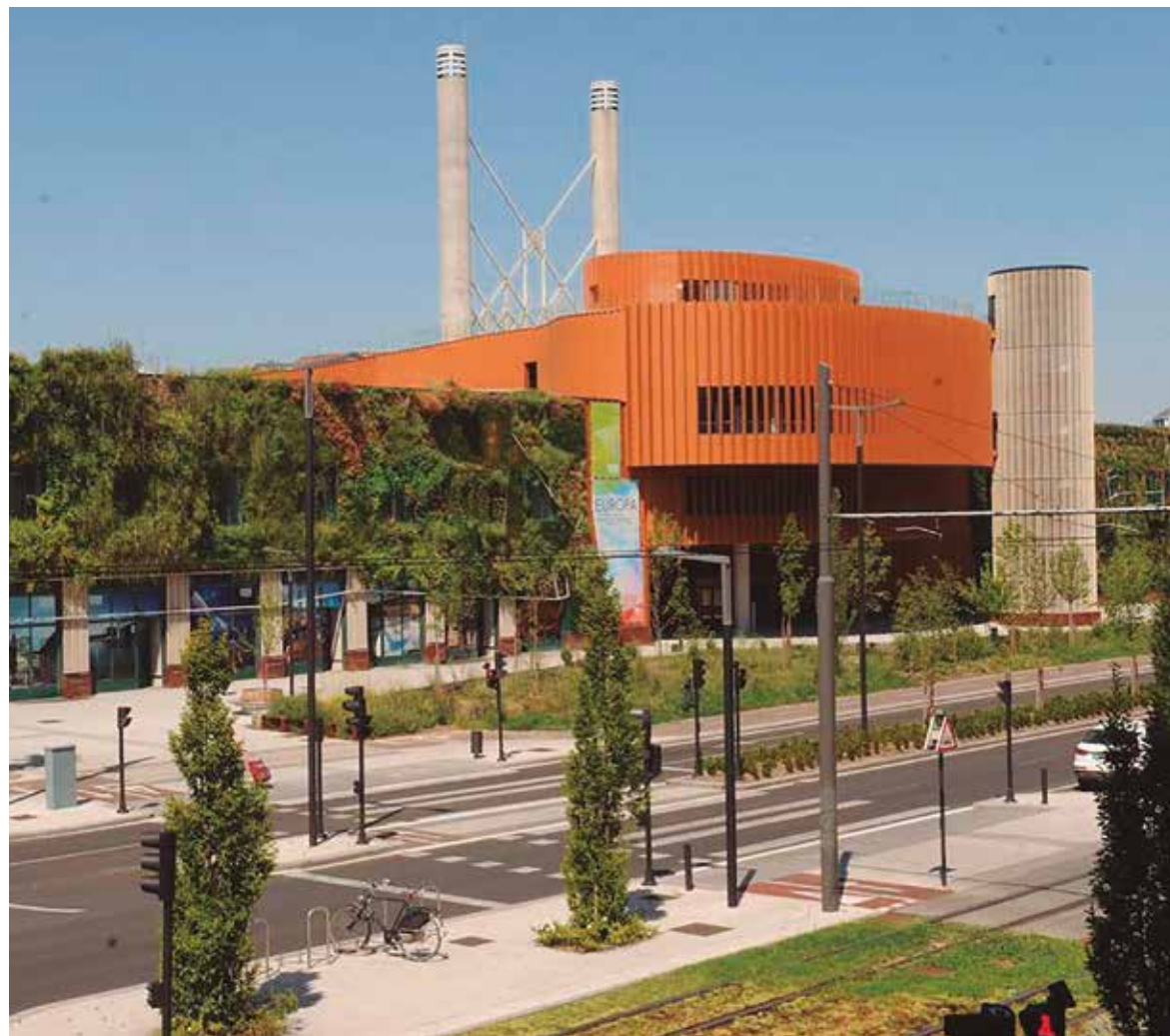
Gasteizko Europa Jauregiak jasoko du CIRP.

Este segundo reto ha permitido que los bdaters comprendan y analicen los indicadores macro, meso y microeconómicos básicos de los países y las regiones de la Unión Europea, mejorando sus habilidades en la identificación de economías sólidas. Analizando una gran cantidad de datos económicos y competitivos de las regiones que han sido previamente etiquetadas como avanzadas y líderes en innovación, los bdaters han sido capaces de ayudar a Innobasque a generar un conocimiento más profundo que nos ayude a aumentar las probabilidades de hacer de Euskadi una región cada vez más competitiva y líder en innovación.