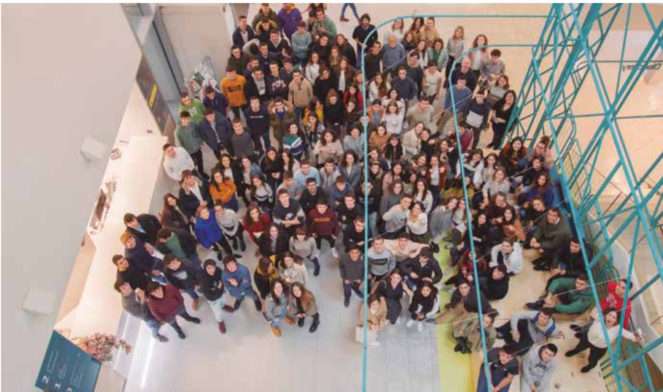
myGADEko ikasleak gogoz hartu dute elkarlana.

MUNDUKIDE ERAKUNDEAK ETA ENPRESAGINTZAKO FAKULTATEAK PROIEKTU BERRITZAILE BAT ELKARBANATU DUTE, ERRONKA EZBERDINAK GAINDITUZ, UNIBERTSITATEKO IKASLEEK MUNDUAN ZEHAR AURRERA ERAMATEN DIREN PROIEKTU EZBERDINAK EZAGUTU AHAL IZAN DITUZTE.