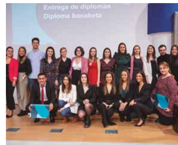
El acto de entrega de diplomas en Bilbao.

EL ALUMNADO DEL MÁSTER EN MARKETING DIGITAL Y EL DEL MÁSTER EN INTERNACIONALIZACIÓN DE ORGANIZACIONES CELEBRÓ EL EVENTO DE ENTREGA DE DIPLOMAS.