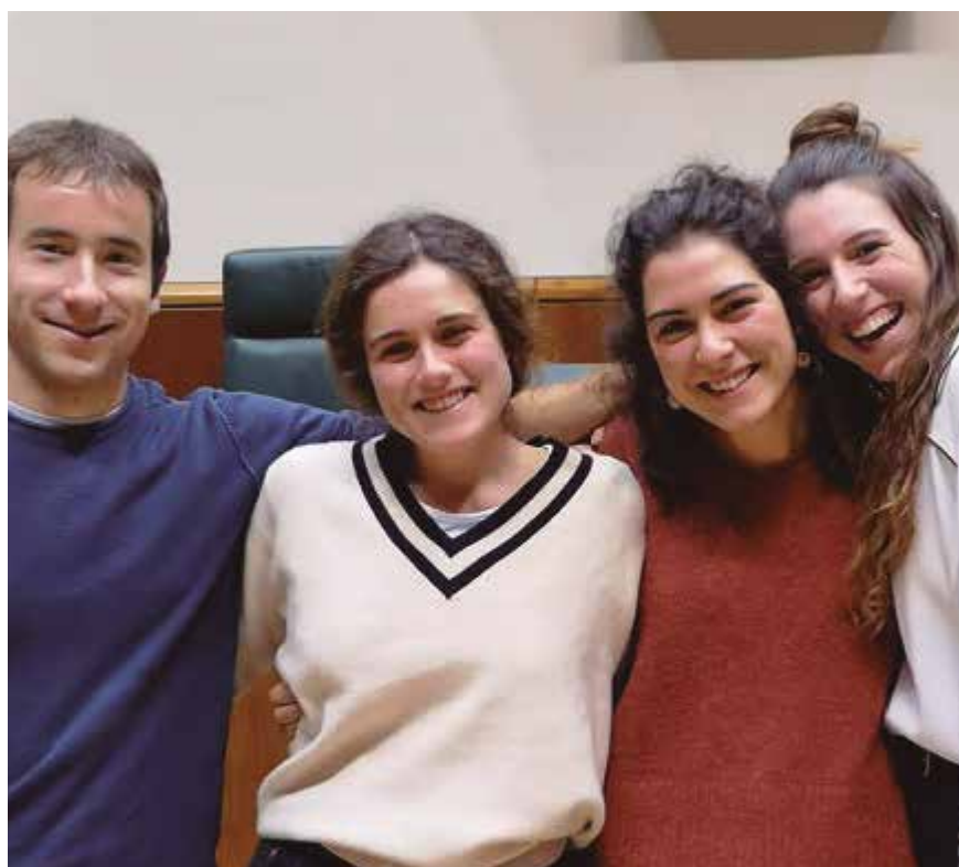
ARGAZKI OINA Izenak eta azalpena emanaz.