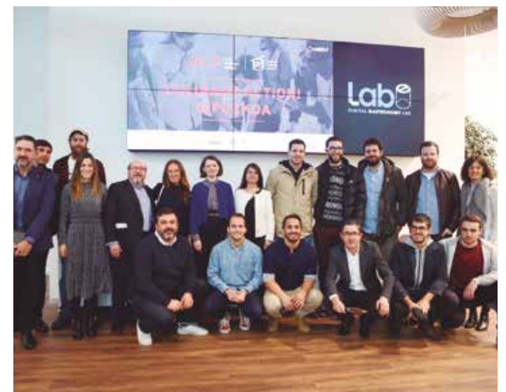
'Culinary Action!'-eko parte-hartzaileak.

Bigarren mahai-inguruan, probintziako ekoizpen-kateko beste eragile batzuek gastronomía sortzeko modu berriak eta kontsumo-eredu berriak izan dituzte ardatz. Hirugarrena aldiz, parrilaren teknikari buruzkoa izan da. Horrez gain, jardunaldia sukaldaritza eskaintzen dituzten bestelako aukera ezberdinak ezagutu eta hauei buruz aritzeko baliagarria izan da.