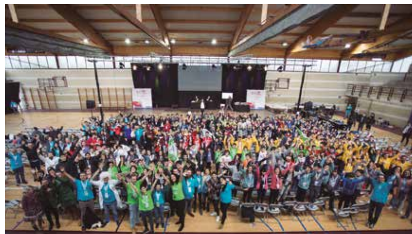
FLL Euskadi-MONDRAGON lehiaketako argazkia.

Basque Culinary Centerrek, prestakuntza gastronomikoan erakunde akademiko aitzindaria den aldetik, kalitatezko hezkuntza ezarri du lehenetsunezko ekintza-ildo gisa. Hala ere, Planaren gainerako alderdian eragina duten zeharkako ekintza batzuk definitu dira ere. Hondakinak murriztearen, sailkatzearen, kudeatzearen eta baliatzearen alde egiten da, baita iraunkortasunaren arloko profesionalak erakartzearen alde edo gai bera ardatz duten hainbat ekitaldi antolatzearen alde ere. Gauzak horrela, datozen lau urteetan garatuko diren 82 ekintza eta neurrik osatzen dute Garapen Iraunkorreko 20/24 Plan Estrategiko berria.