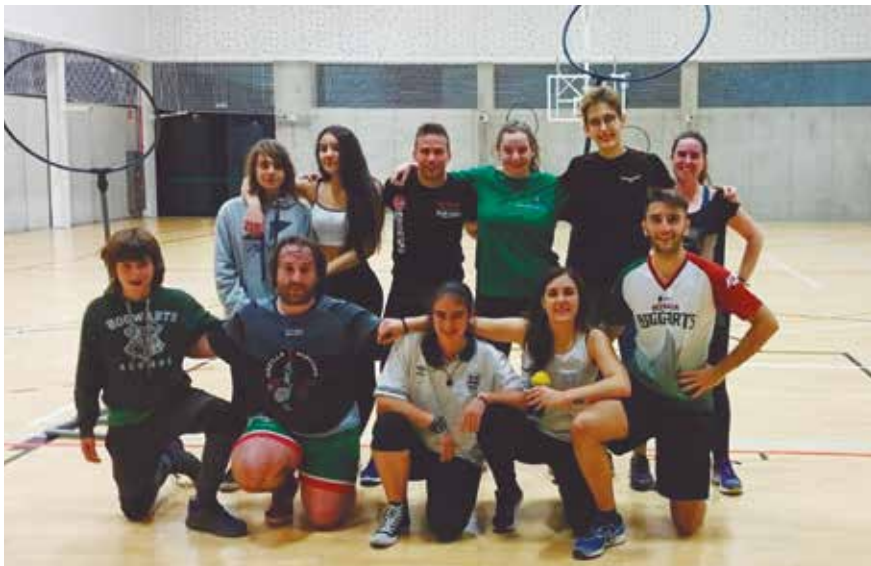
Mondragon Unibertsitateko Quidditch taldea.

KIROL ZERBITZUAREN HELBURUA, MONDRAGON UNIBERTSITATEKO IKASLE ZEIN LANGILEEN OSASUNA HOBETZEN LAGUNTZEA IZANIK, JARDUERA MOTA EZBERDINAK ANTOLATZEN DITU DENON BEHAR ETA GUSTUEI EGOKITUZ.