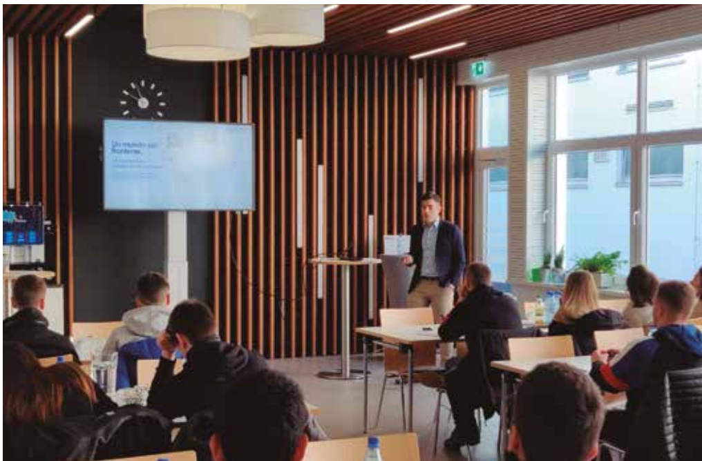
Programa osatu duen jardunaldietako bat.

myGADE GRADUKO LEHEN MAILAKO IKASLEEK ASTEBETEKO EGONALDIA EGIN DUTE EUROPAN ZEHAR. HIRU CAMPUSETAKO IKASLEEK PARTE HARTU DUTELARIK, GRADUAN ZEHAR LANDUKO DITUZTEN EDUKIAK ERREALITATEAN KOKATU AHAL IZAN DITUZTE.