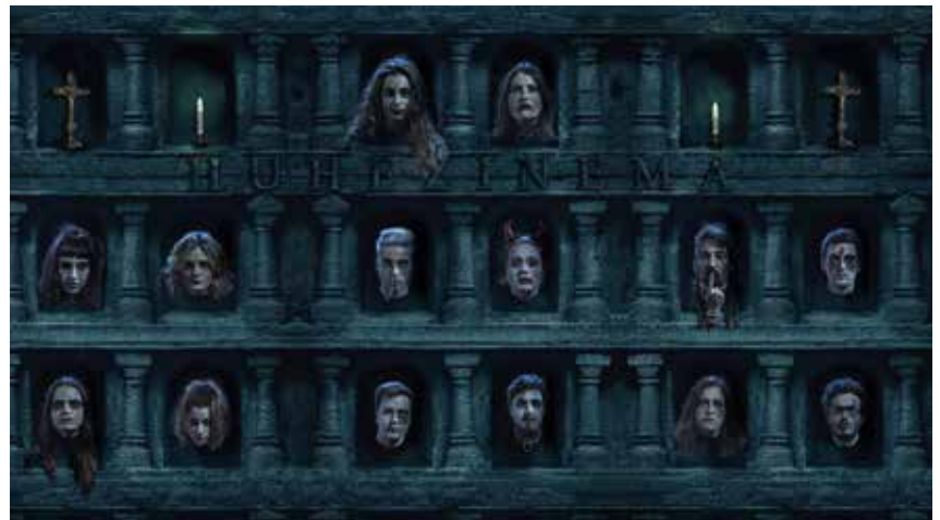
Ikasle antolatzaileen aurpegiekin egindako fotomuntaketa.

Humanitate eta Hezkuntza Zientzien Fakultatea | Martxoan, Ikus-entzunezko Komunikazioko Gradu ikasleek Huhezinema Euskal Film Laburren Jaialdiaren 13. edizioa dute. Euskal zinemazaleen ezinbesteko hizordua bilakatu da Aretxabaletan egiten den jaialdia.