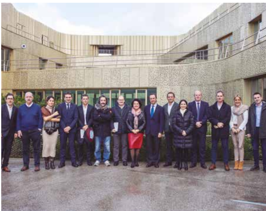
Basque Culinary Center erakundearen Patronatua.

BASQUE CULINARY CENTERREK HURRENGO URTEETAN AURREIKUSTEN DITUEN ERRONKA ETA JARDUERAK AURKEZTU DITU. 2020-2024 PLAN ESTRATEGIKO BERRIAK 82 NEURRI KONKRETU BILTZEN DITU IRAUNKORTASUNERANZKO BIDEAN.