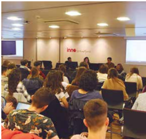
Estudiantes en la sede de Innobasque en Zamudio.

LOS Y LAS ESTUDIANTES DEL GRADO EN BUSINESS DATA ANALYTICS TRABAJAN JUNTO A INNOBASQUE CON EL OBJETIVO DE MEJORAR LA COMPETITIVIDAD DE LAS REGIONES