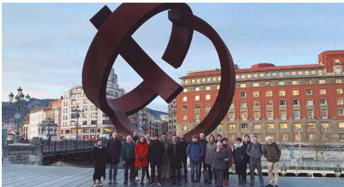
Bilbao Berrikuntza Faktorian egin zen jardunaldia.

BILBON IZANDAKO MINTEGIAN, BILDU DIRA NAZIOARTETIK ETORRITAKO ANTROPOLOGO, SOZIOLOGO ETA HEZITZAILEAK ETA BILBOKO GIZARTE-ERAGILEAK.