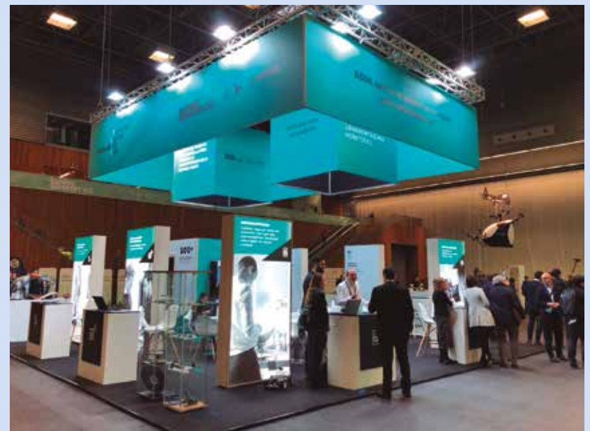
Puesto de información del BDIH.

La estructura de BDIH está compuesta por 21 agentes, entre los que se encuentran importantes organizaciones como Tecnalia, IK4 Tekniker, UPV/EHU, Ikerlan o Mondragon Unibertsitatea. Entre todos sus miembros, se han contabilizado más de 100 activos tecnológicos de última generación, infraestructuras que facilitarán al tejido industrial vasco subirse al tren de la Industria 4.0.