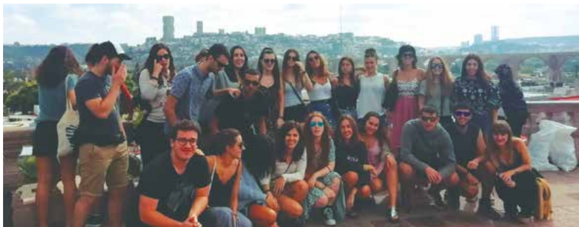
Alumnado de la universidad disfruta de la experiencia internacional.

MONDRAGON UNIBERTSITATEA HA OBTENIDO EL RECONOCIMIENTO INTERNACIONAL EN CUATROS GRADOS Y DOS MÁSTERES. LA EVALUACIÓN REALIZADA POR UNIBASQ, AGENCIA DE CALIDAD DEL SISTEMA UNIVERSITARIO VASCO, REFUERZA LA APUESTA DE LA UNIVERSIDAD POR LA INTERNACIONALIZACIÓN EN SU AMPLIO SIGNIFICADO, UNO DE SUS PRINCIPALES RETOS ESTRATÉGICOS.