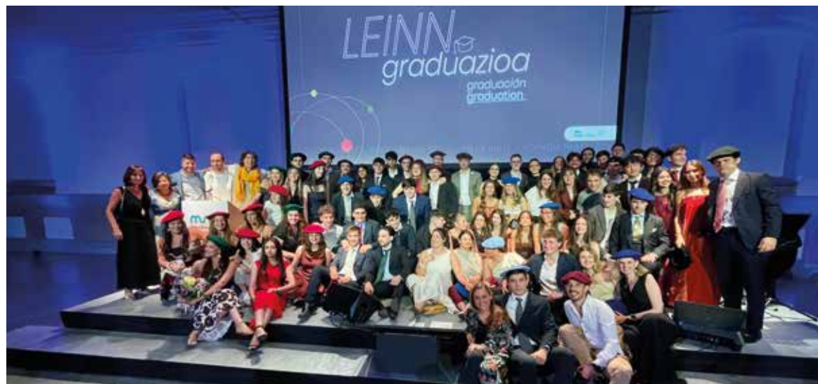
) LEINNeko Bilbo, Irun, Oñatiko eta LEINN Internacional-eko ikasleak.