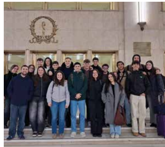
Teknologia Biomedikoko masterraren ikasleak.

TEKNOLOGIA BIOMEDIKOETAKO MASTERREKO IKASLEEK LEARNING JOURNEY BAT EGIN DUTE MADRILEN, OSASUN-EREMUARI APLIKATUTAKO NEUROZIENTZIA, BIOTEKNOLOGIA ETA 3D FABRIKAZIOA UZTARTZEN DITUENA.