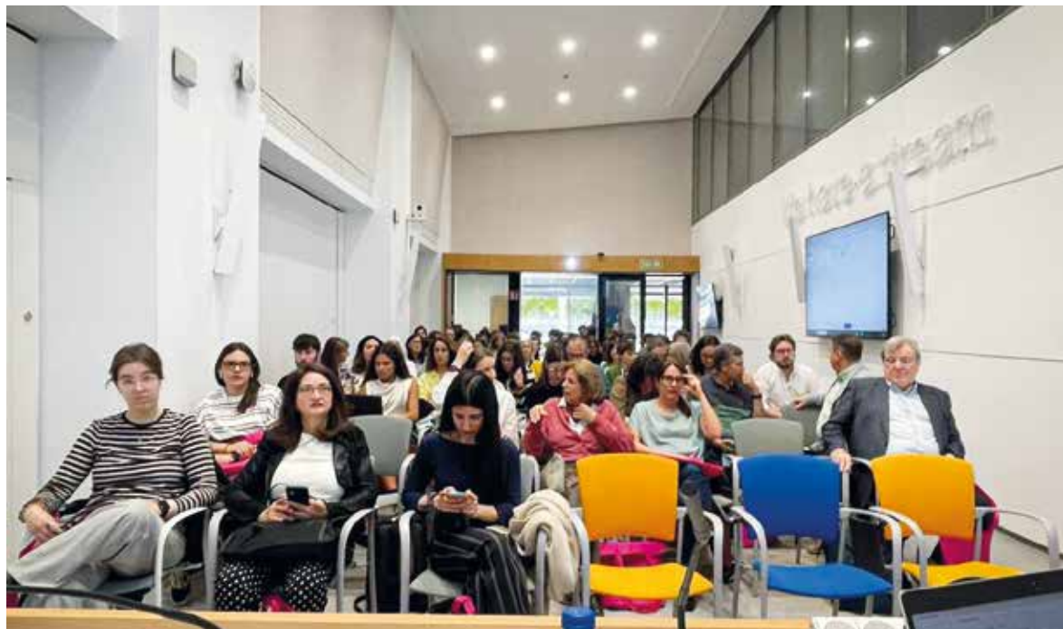
Bilbon egindako ekitaldia.

APIRILEAN BILBON EGIN ZUTEN BILKURAN, PARTEKATU ZITUZTEN ESPERIENTZIAK, AURKEZTU ZITUZTEN PONENTZIAK ETA AZPIMARRATU ZUTEN ZAINZTA PSIKOLOGIKOAREN BALIO SOZIALA. HUMANITATE ETA HEZKUNTZA ZIENTZIEN FAKULTATEAK 2021EAN SORTU ZUEN ARRETA PSIKOLOGIRAKO ZERBITZUA.