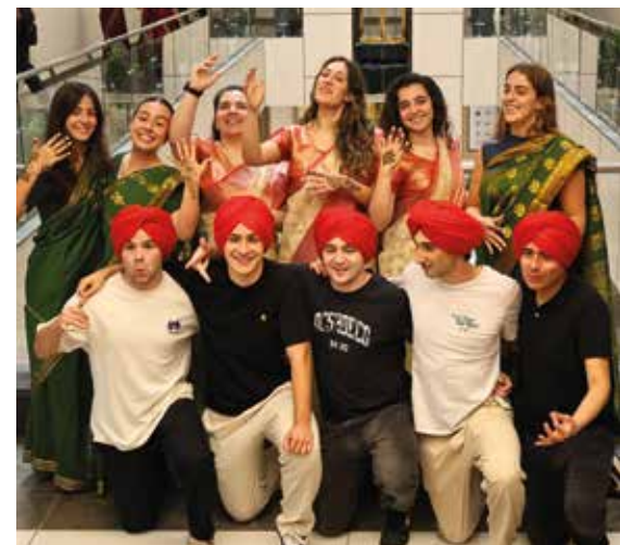
myGADEko ikasleak Indian.

NAZIOARTEKOTZEA MONDRAGON UNIBERTSITATEKO ENPRESAGINTZA FAKULTATEKO ENPRESA DUALEN ADMINISTRAZIO ETA ZUZENDARITZAKO GRADUAREN (MYGADE) ZUTABEETAKO BAT DA.