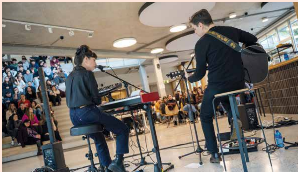
Fakultatearen 50. urteurrenaren harira, Eskoriatzan egindako ekitaldia.

Proiektuak Europako hainbat unibertsitate eta erakun-deren parte-hartzea du, besteak beste, Dublin City Univer-sity (Irlanda), University of Bergamo (Italia), Université de Tours (Frantzia), University of Ioannina (Grezia), Gebze Tech-nical University (Turkia), University of East Sarajevo (Bosnia eta Herzegovina) eta Mondragon Unibertsitatea, Vode-