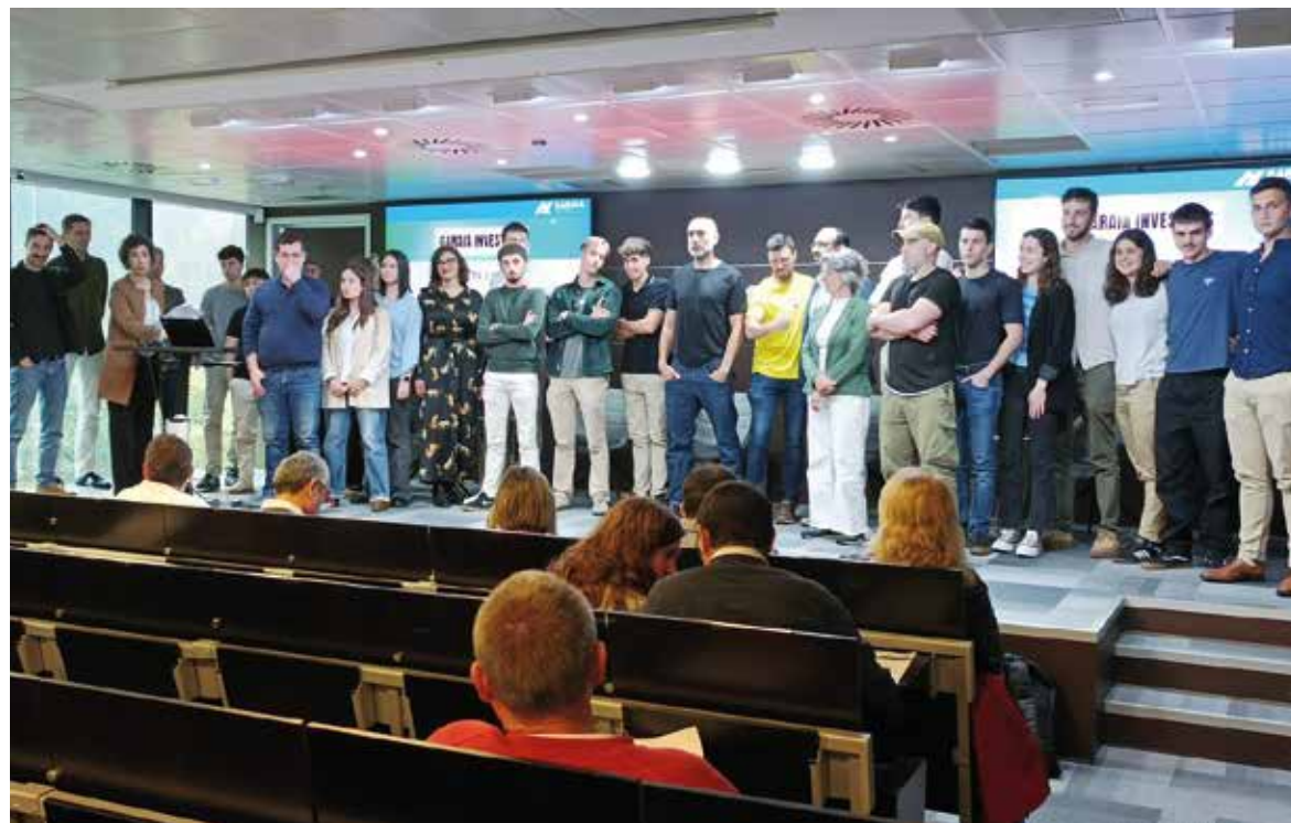
14 ikaslek proiektuak aurkeztu eta 26k ekintzailtza proiektuetan parte hartzeko interesa erakutsi dute.