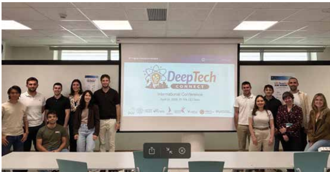
Deep Tech Connect konferentzian parte hartutako taldea.

DUELA GUTXI, DEEPTech CONNECT KONFERENTZIAREN LEHEN EDIZIOA EGIN ZEN. KONFERENTZIA ALDI BEREAN ANTOLATU ZEN EUROPAKO 8 HERRIALDETAN. EKITALDIAK 77 HITZALDI BILDU ZITUEN GUZTIRA, ETA BERRIKUNTZA TEKNOLOGIKOAREN ETA EKINTZAILETZAREN ESPARRUAN EZAGUTZA TRUKATZEKO GUNE GARRANTZITSU GISA FINKATU ZEN.