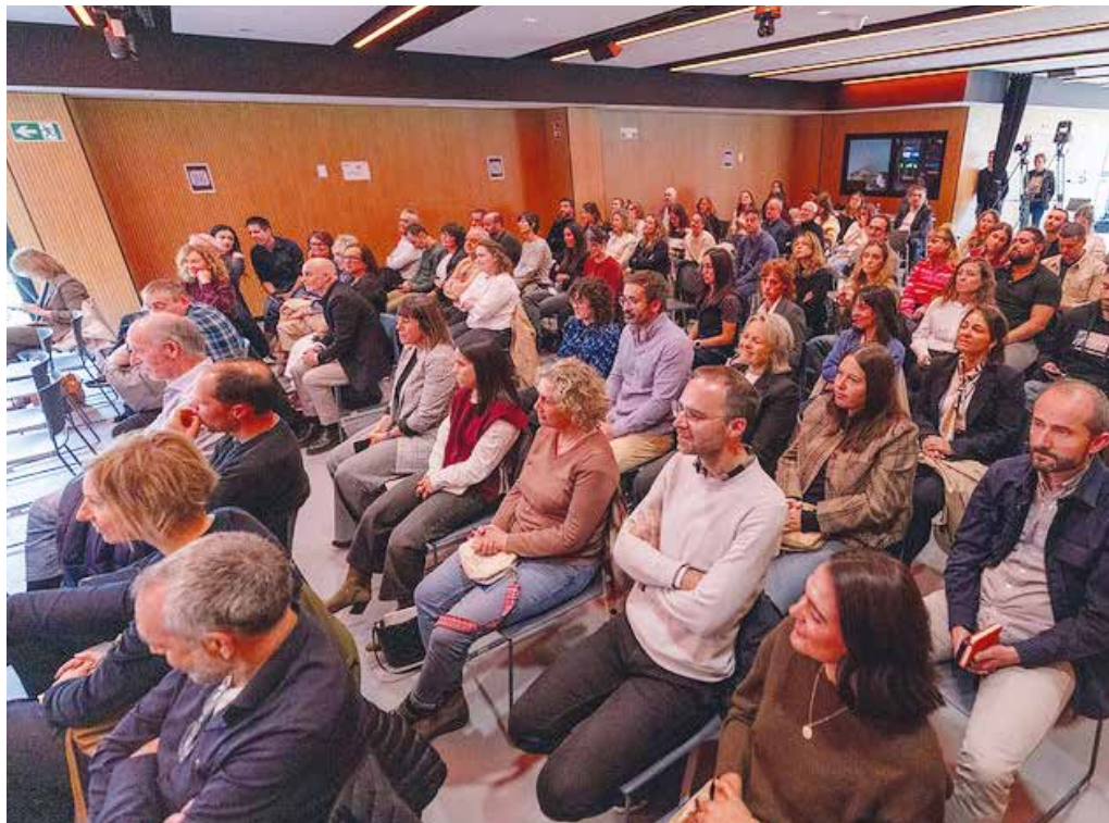
Aretxabaletako campuseko IdeiEnean egin zen K-Foroaren 8. edizioa.

ORAINGO EDIZIOAN, NARRATIBAREN GAIA ETA INDARRA IZAN DUTE HIZPIDE KOOPERATIBETATIK ETORRITAKO KOMUNIKAZIO TALDEETAKO ORDEZKARIEK. ARETXABALETAKO CAMPUSEAN DAGOEN IDEIENEAN EGIN DA 8. FOROA.