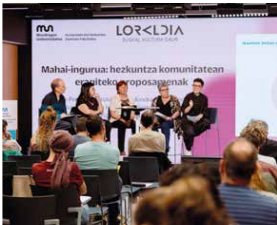
Aretxabaletako campusean egindako ekitaldia.

HEZKUNTZA KOMUNITATEAREN INTERES ETA BEHARREI ZUZENDUTAKO LORALDIA ESKOLAREN LAUGARREN TOPAKETA EGIN DUTE ARETXABALETAKO CAMPUSEAN.