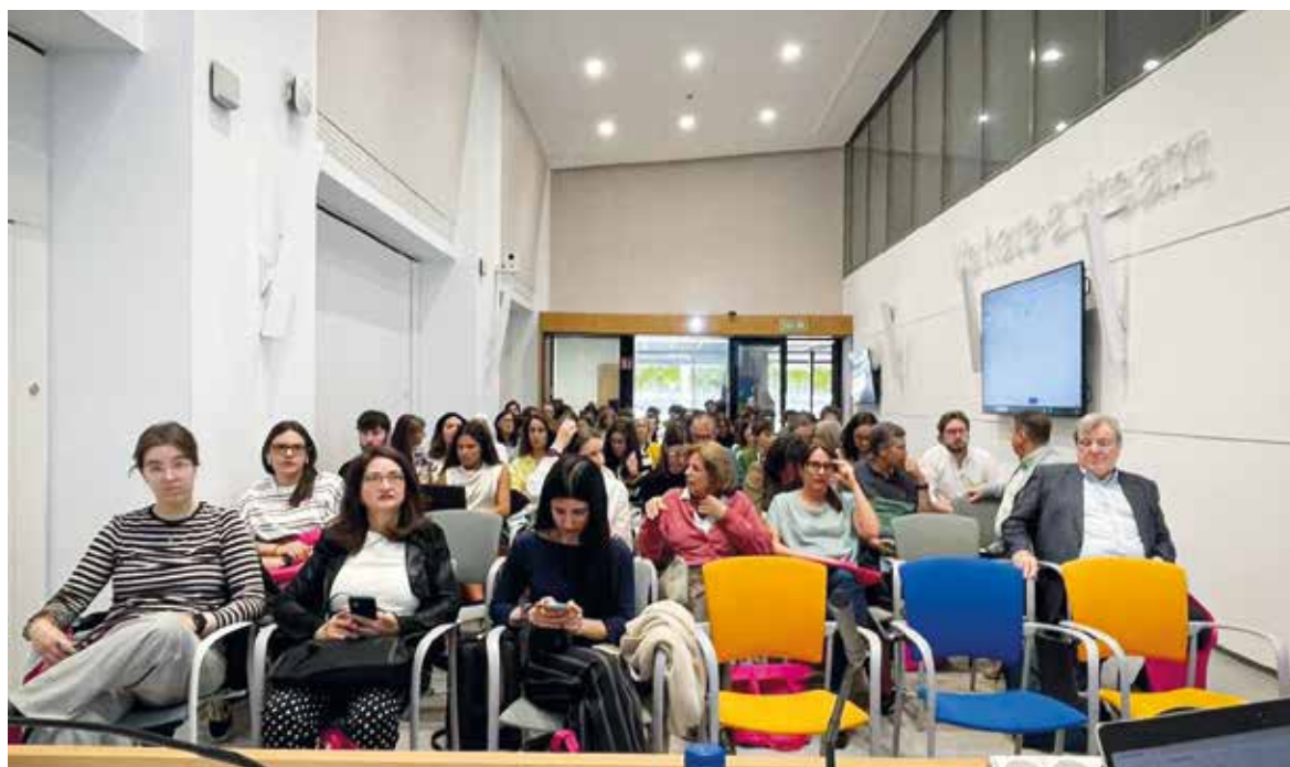
Imagen de las jornadas celebradas en Bilbao.

EN LA SESIÓN DE ABRIL CELEBRADA EN BILBAO, COMPARTIERON EXPERIENCIAS, PRESENTARON PONENCIAS Y SUBRAYARON EL VALOR SOCIAL DEL CUIDADO PSICOLÓGICO. LA FACULTAD DE HUMANIDADES Y CIENCIAS DE LA EDUCACIÓN CREÓ EL SERVICIO DE ATENCIÓN PSICOLÓGICA EN 2021.