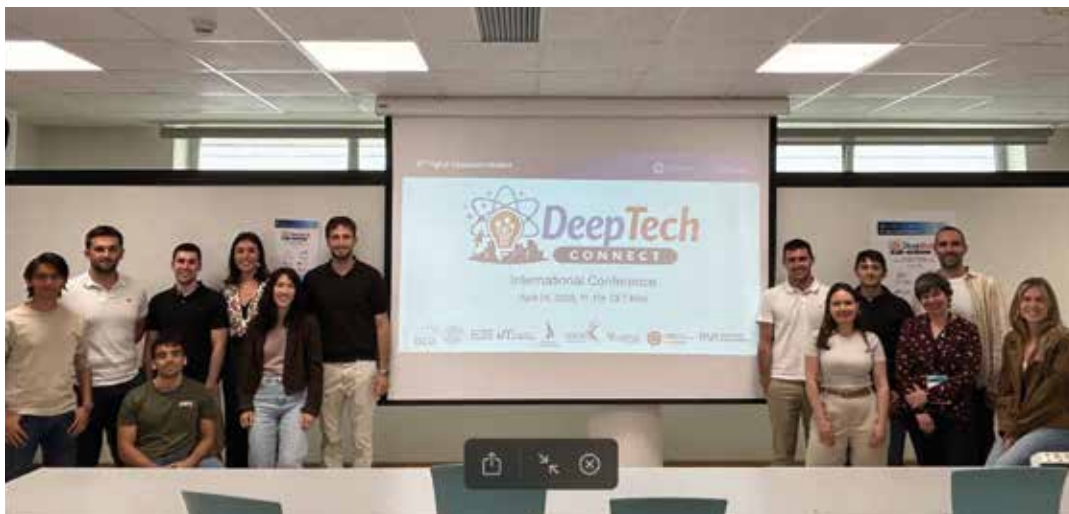
Grupo participante en la conferencia DeepTech Connect.

RECIENTEMENTE TUVO LUGAR LA PRIMERA EDICIÓN DE LA CONFERENCIA DEEPTech CONNECT, ORGANIZADA DE FORMA SIMULTÁNEA EN 8 PAÍSES EUROPEOS. EL EVENTO REUNIÓ UN TOTAL DE 77 PONENCIAS, CONSOLIDÁNDOSE COMO UN ESPACIO RELEVANTE PARA EL INTERCAMBIO DE CONOCIMIENTO EN EL ÁMBITO DE LA INNOVACIÓN TECNOLÓGICA Y EL EMPRENDIMIENTO.