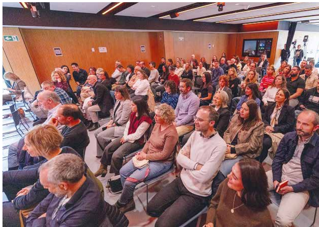
La 8ª edición de K-Foroa se celebró en IdeiEnea, en el campus de Aretxabaleta.

EN LA PRESENTE EDICIÓN, CELEBRADA EN IDEIENEA, EN EL CAMPUS DE ARETXABALETA, REPRESENTANTES DE LOS DEPARTAMENTOS DE COMUNICACIÓN DE LAS COOPERATIVAS HAN TRATADO LA NARRATIVA Y SU FUERZA.