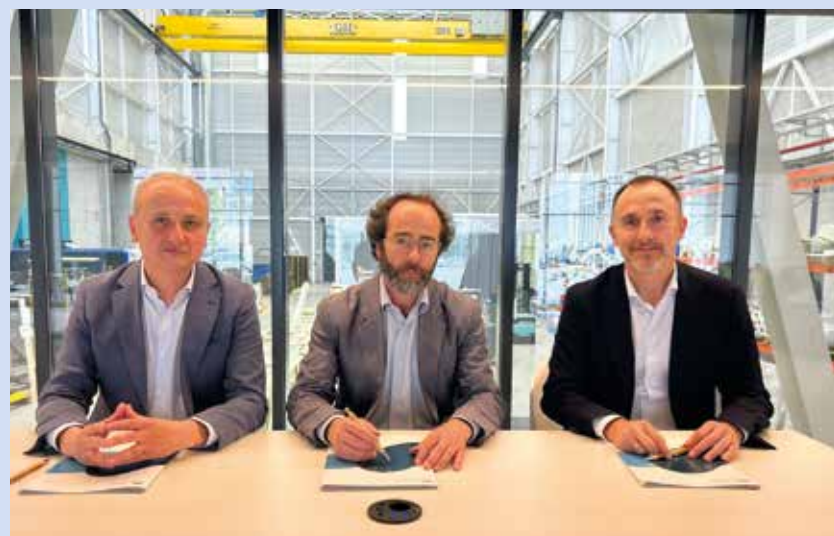
Firma del acuerdo de colaboración.

Por su parte, Kide cuenta también con más de medio siglo de experiencia en soluciones frigoríficas integrales. Con una amplia red de colaboradores e integrada en la Corporación Mondragon, la empresa ofrece cámaras frigoríficas, paneles aislantes, puertas, equipos y secaderos, manteniendo una clara vocación internacional y un firme compromiso con el desarrollo sostenible y el entorno.