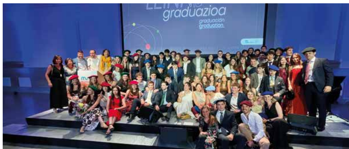
Alumnos de LEINN de Bilbao, Irún, Oñati y de LEINN Internacional.