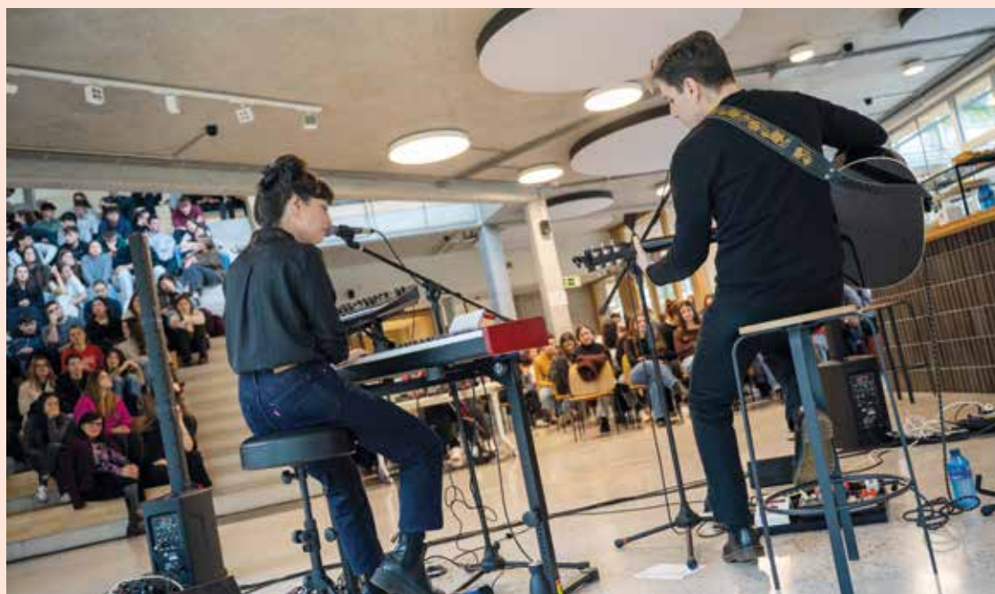
Acto celebrado en Eskoriatza con motivo del 50º aniversario de la Facultad.

University of Ioannina (Grecia), Gebze Technical University (Turquía), la University of East Sarajevo (Bosnia y Herzegovina) y Mondragon Unibertsitatea, junto con organizaciones como Vodena (Serbia). Esta red internacional refuerza el carácter colaborativo del proyecto y amplía las oportunidades de desarrollo conjunto en el ámbito de la deep tech.