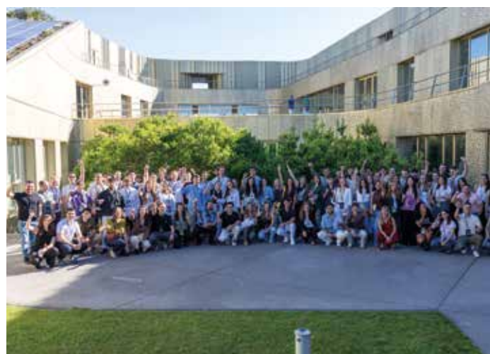
Nuevos jóvenes talentos de la gastronomía.

Basque Culinary Center - Facultad de Ciencias Gastronómicas | Basque Culinary Center ha presentado la cuarta edición de 100 Jóvenes talentos de la Gastronomía, una selección de profesionales menores de 30 años que componen una mirada multidisciplinar y actual del sector, perfiles que reflejan la amplitud de la gastronomía y que están contribuyendo a su transformación.