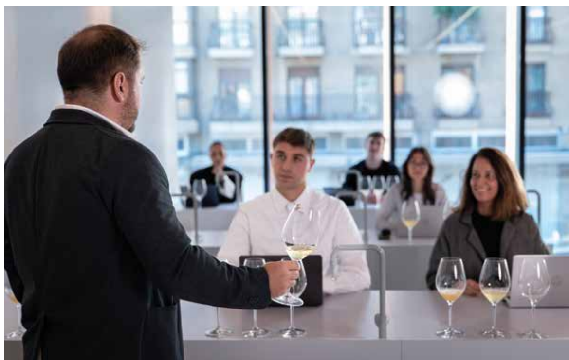
Máster para sumillers e innovación en el mundo de los líquidos.

EDA DRINKS & WINE AMPLÍA LA MATRÍCULA DE DOS NUEVOS MÁSTERES: MARKETING, COMERCIALIZACIÓN Y NEGOCIO DE VINO Y BEBIDAS; Y INNOVACIÓN MUNDIAL PARA SUMILLERS Y LÍQUIDOS. ADEMÁS, EN BREVE PRESENTARÁ UN NUEVO POSTGRADO.