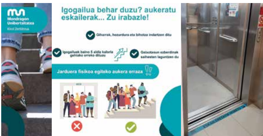
Los deportes y la función cognitiva tienen gran relación.

Así que está claro: la salud está en el movimiento. Recuerda que las escaleras no son sólo un camino, sino una oportunidad única para mejorar tu salud y bienestar. ¿A qué esperas? ¡Únete a hábitos de vida saludables! ¡Tu salud está en tus manos -o, mejor dicho, en tus pies-!