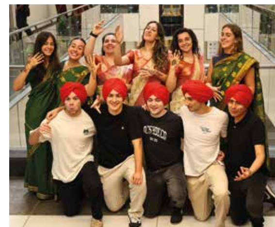
Alumnos de myGADE en la India.

LA INTERNACIONALIZACIÓN ES UNO DE LOS PILARES DEL GRADO EN ADMINISTRACIÓN Y DIRECCIÓN DE EMPRESAS DUAL (MYGADE) DE LA FACULTAD DE EMPRESARIALES DE MONDRAGON UNIBERTSITATEA.