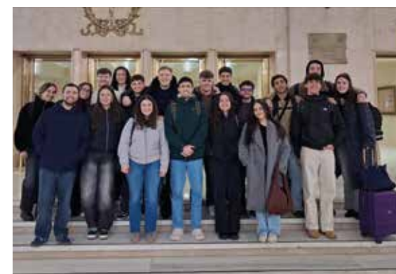
Alumnado del Máster en Tecnologías Biomédicas.

EL ALUMNADO DEL MÁSTER EN TECNOLOGÍAS BIOMÉDICAS HA REALIZADO UN LEARNING JOURNEY EN MADRID, UNA EXPERIENCIA FORMATIVA QUE COMBINA NEUROCIENCIA, BIOTECNOLOGÍA Y FABRICACIÓN 3D APLICADA AL ÁMBITO SANITARIO.