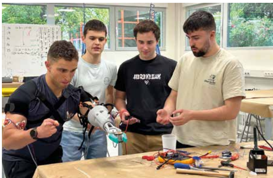
Varios de los promotores del proyecto Harreman.

EL PROYECTO HARREMAN IMPULSA EL DESARROLLO DE UNA PRÓTESIS PALPABLE FUNCIONAL PARA PARTICIPAR EN EL CONCURSO ESTATAL Y ACERCAR LA INGENIERÍA BIOMÉDICA A LAS NECESIDADES REALES DE LAS PERSONAS.