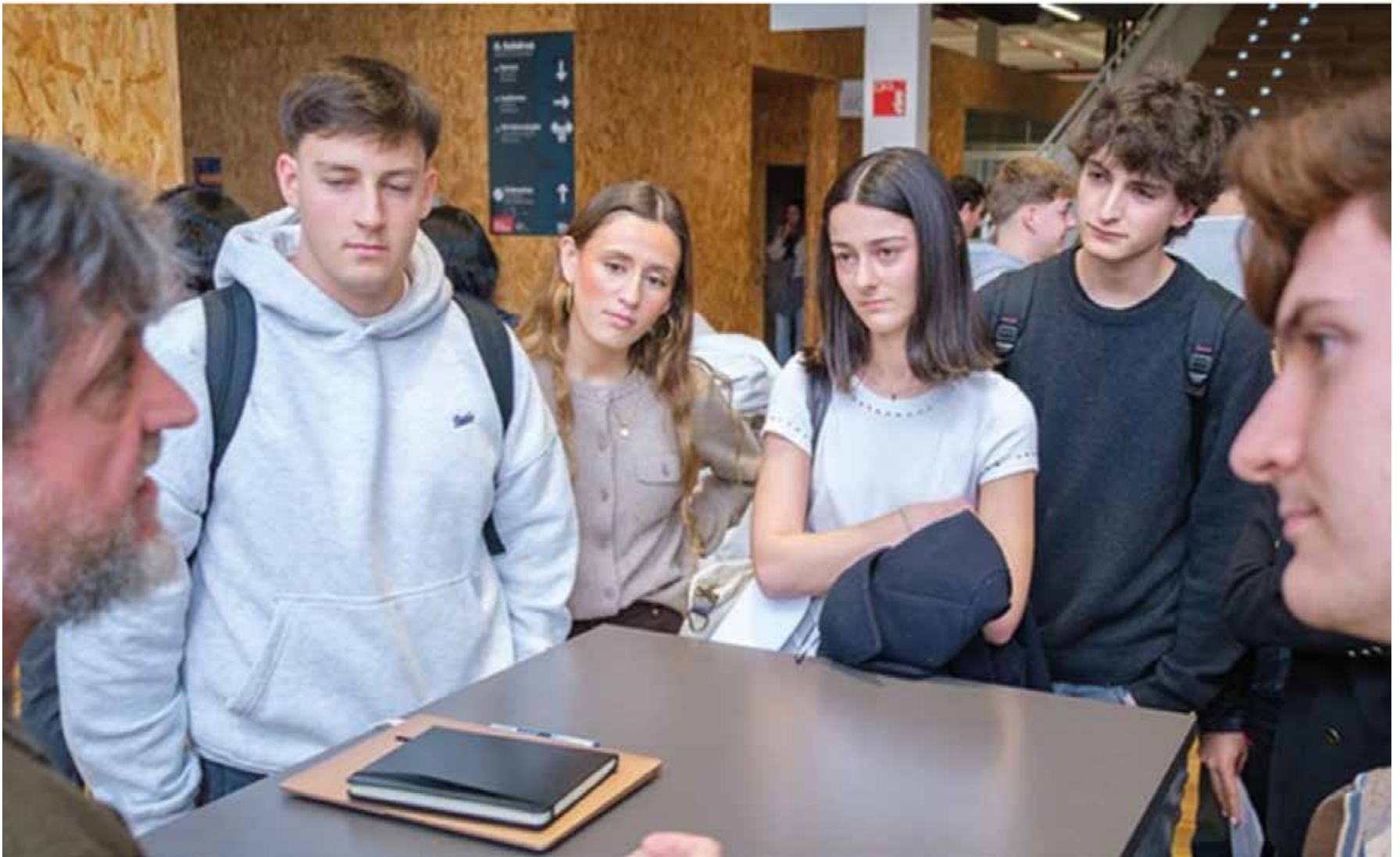
Alumnado conectando con empresas durante las jornadas.