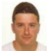
MIKEL MAZUELA Erdieroaleen konexioa seriean egiten denean sortzen den arazoari irtenbidea eman zaio eta topologia honi dagokion bus tentsioen oreka.

Los convertidores electrónicos de potencia juegan un papel fundamental en aplicaciones drive de Media Tensión. Las topologías multinivel permiten operar sin transformadores en Media Tensión, sintetizando una buena calidad de onda de salida. El convertidor multinivel 5L-MPC es una opción interesante para aplicaciones de 6.6kV. En esta tesis se ha dado solución a la problemática de conexión en serie de semiconductores y equilibrio de tensiones de bus inherentes a esta topología.