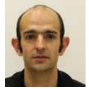
AITOR MADARIAGA Gainazalen integritatea eta nekearekiko bizitza Inconel 718ko osagai torneatuen ziklo baxuetan.

El mecanizado de componentes aeronáuticos es crítico. Si no se seleccionan las condiciones adecuadas, el comportamiento final puede verse afectado. El trabajo analiza la influencia de las condiciones de mecanizado en la integridad superficial y vida a fatiga de la aleación Inconel 718. Se ha propuesto un modelo local de fatiga que permite relacionar la integridad superficial y vida a fatiga de piezas mecanizadas.