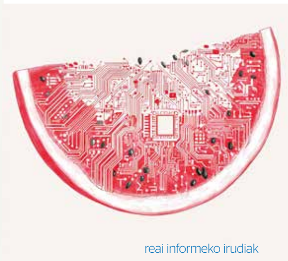
rei informeko irudiak

Trazabilitate adimenduna: mikrotxip jangarrien eta blockchainen erabilerak (adibidez, Parmigiano Reggiano gaztan) jatorria bermatzen du eta iruzurra aurretik antzeman; Supermerkatu prediktiboak: algoritmoek stock hausturak aurreratzen dituzte eta logistika doitzen dute klimaren edo kontsumo patroien arabera, laguntzaile digitalek denbora errealean eskaintzak pertsonalizatzen dituzten bitartean; eta Etxe konektatua: etxetresna elektriko