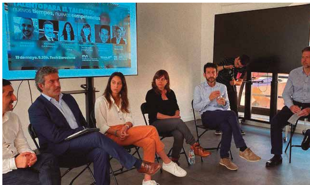
Profil desberdinez osatutako mahai-ingurua.

MONDRAGON UNIBERTSITATEA ETA TEAMLABS-EK ENPRESA EZBERDINEKIN BATERA TALENTUAREN BILAKETAK ETA PERTSONEN KUDEAKETAK AURKEZTEN DITUZTEN ERRONKAK AZTERTU DITUZTE BARTZELONAN