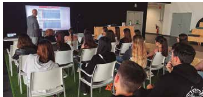
Graduko ikasleak EITBra egindako bisitan.

Bisita honek kasu erreal baten azterketa ekarri zuen, EITB taldearena zehazki, eta bertan ikusi ahal izan zuten oso garrantzitsua dela datuak integratzea soluzio mota zehatz horietarako. Bisita honek elkarlanerako aukera berriak irekiko ditu ziurrenik, dagoeneko gauzatzen ari direnetatik harago.