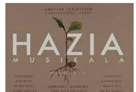
Hazia musikalaren kartel ofiziala.

oinarri hartuta, gure herriaren garapena gertutik ezagutzeko aukera eskaintzen da.