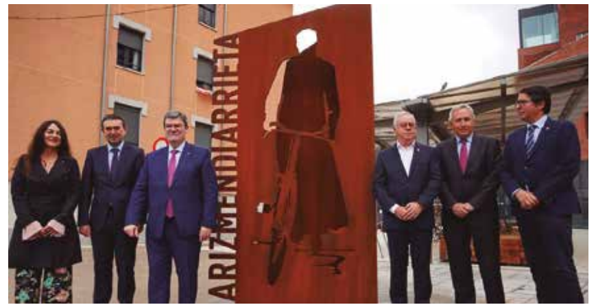
Eskulturaren inaugurazio ekitaldia.

BILBAO AS FABRIK CAMPUSAREN SARRERA KOKATU DA KOOPERATIBISMOAREN SORTZAILEARI ESKAINITAKO ESKULTURA BERRIA