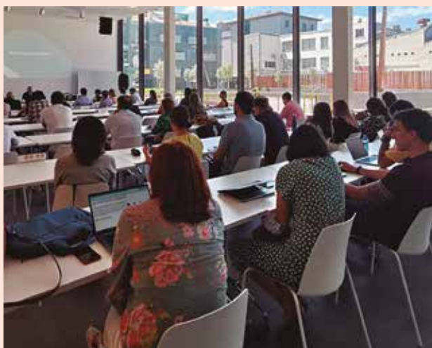
Publikoaren bertaratzeko arrakastatsua.

Enpresagintza Fakultatea | Mondragon Unibertsitatearen Enpresagintza Fakultateak hogeitahamar enpresa inguru bildu zituen jardunaldi bat antolatu zuen kudeaketa eta datuen analisisien alorrak etorkizun hurbilerako dituzten erronkak elkarbanatzeko helburuarekin. Sare honen asmoa zaintza aktiboa abian jartzea da, ingurunesoziolaboral berriaren talentuaren plangintza estrategikoan eragina duten faktoreak identifikatzeko.