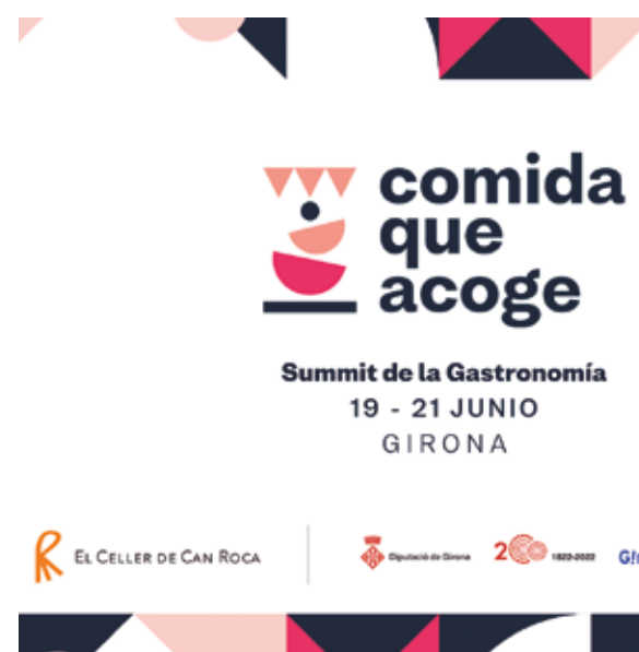
Cartel anunciador del evento.

Krisiak markatutako baina apustu egitera eta ekitera ausartzen direnentzat aukeraz betetako une batean, ‘Harrera egiten duen janaria’ Summit-ak gastronomia harrera-gune dinamiko gisa ikusteko gakoak partekatu nahi izan ditu: joerena, eta sormena eta berrikuntza ulertzeko modua.