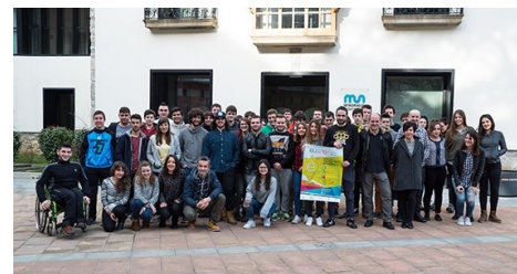
Uno de los grupos de estudiantes que tomarán parte en Euspot 2016.

Se ha puesto en marcha la quinta edición del concurso de spots en euskera Euspot. Tomando como tema del concurso impulso del turismo de interior en Gipuzkoa, hasta el 28 de abril los participantes podrán enviar spots de entre 20 y 30 segundos. En la presente edición, además de la Facultad de Humanidades y Ciencias de la Educación, el Ayuntamiento de Aretxabaleta y la agencia Arteman Komunikazioa, patrocinarán el concurso la Diputación Foral de Gipuzkoa y la compañía AudioNetwork.