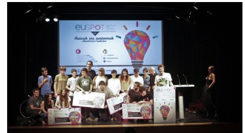
Irabazle guztiak taula gainean.