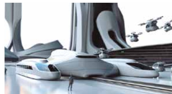
Prototipo del proyecto Ethos.

EL PROYECTO DESARROLLADO POR UN EQUIPO DEL CENTRO DE INNOVACIÓN DE DISEÑO CON LA EMPRESA CAF SE EXPONE EN EL MUSEO BILBAÍNO HASTA SEPTIEMBRE