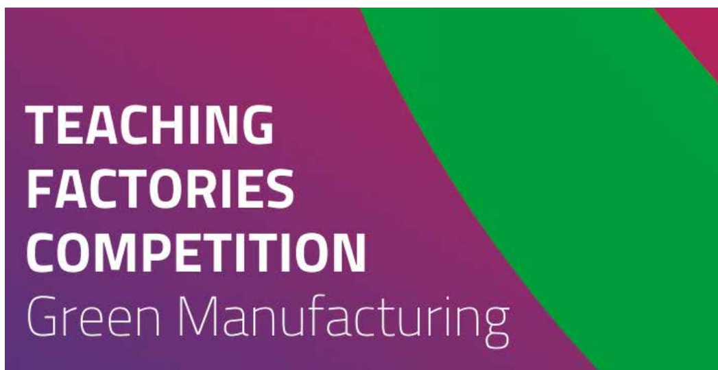
Cartel del concurso Teaching Factories Competition.

ALUMNOS DEL GRADO DE INGENIERÍA EN ECOTECNOLOGÍA DEL PROCESO INDUSTRIAL PARTICIPAN EN EL CONCURSO TEACHING FACTORIES DEL CONSORCIO EIT MANUFACTURING.