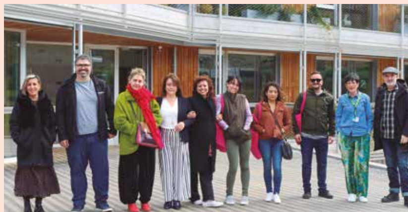
Recepción al alumnado internacional en el campus de Eskoriatza.

VISITA DE ESTUDIANTES DE DIFERENTES PROCEDENCIAS DEL MÁSTER UNIVERSITARIO EN COOPERATIVISMO Y GESTIÓN SOCIOEMPRESARIAL