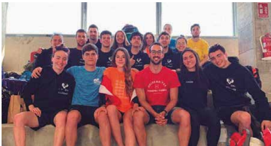
XXI. Especial Campeonato Universitario de Euskadi en Bilbao.

LA PANDEMIA DE LA COVID-19 HA AFECTADO A LA FORMA DE ORGANIZAR LAS COMPETICIONES DEPORTIVAS, QUE AUNQUE SE ADAPTARON DE MANERA POSITIVA, HAN VUELTO AL FORMATO HABITUAL