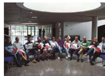
Proiektuan parte hartu duen taldea.

El programa ha implicado tanto al personal de las plantas de fabricación de Fagor Ederlan -que trabajan a rotación- como a una veintena de profesores universitarios. Los aspectos teórico-prácticos de este plan de capacitación han estado orientados a las capacidades en tecnologías clave para Fagor Ederlan, como fundición, mecanizado, sistemas de automatización y organización de procesos industriales.