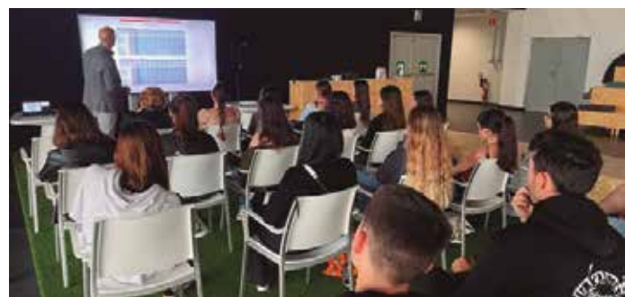
Estudiantes del grado atienden en su visita a EITB.

La visita supuso un análisis de un caso real, en este caso EITB, en el que han visto la importancia de la integración de los datos para este tipo de soluciones en concreto. Esta visita abre seguramente nuevas oportunidades de colaboración, añadidas a las que ya se están materializando.