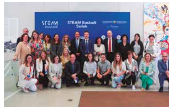
Acto de entrega de premios STEAM.

El objetivo del proyecto STEMotiv es impulsar la educación STEM y fomentar los estudios STEM en el alumnado y sobre todo en las niñas y ofrecer los medios para mejorar las competencias necesarias para ello. En esta segunda edición del proyecto obtenido por el concurso competitivo darán continuidad al trabajo de investigación iniciado el curso pasado y profundizarán en la formación del profesorado de las asignaturas STEM. Realizamos el proyecto STEMotiv junto a Vicomtech e Ikaflan Gipuzkoa.