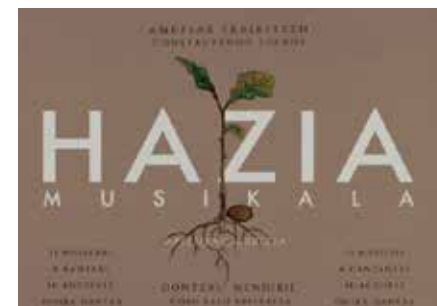
Cartel oficial del musical HAZIA.

la oportunidad de conocer de cerca el desarrollo de nuestro puebloa.