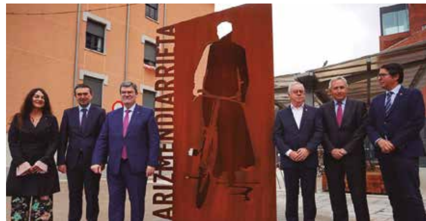
Acto de inauguración de la escultura.

LA ENTRADA DEL CAMPUS BILBAO AS FABRIK ACOGE LA NUEVA ESCULTURA DEDICADA AL FUNDADOR DEL COOPERATIVISMO