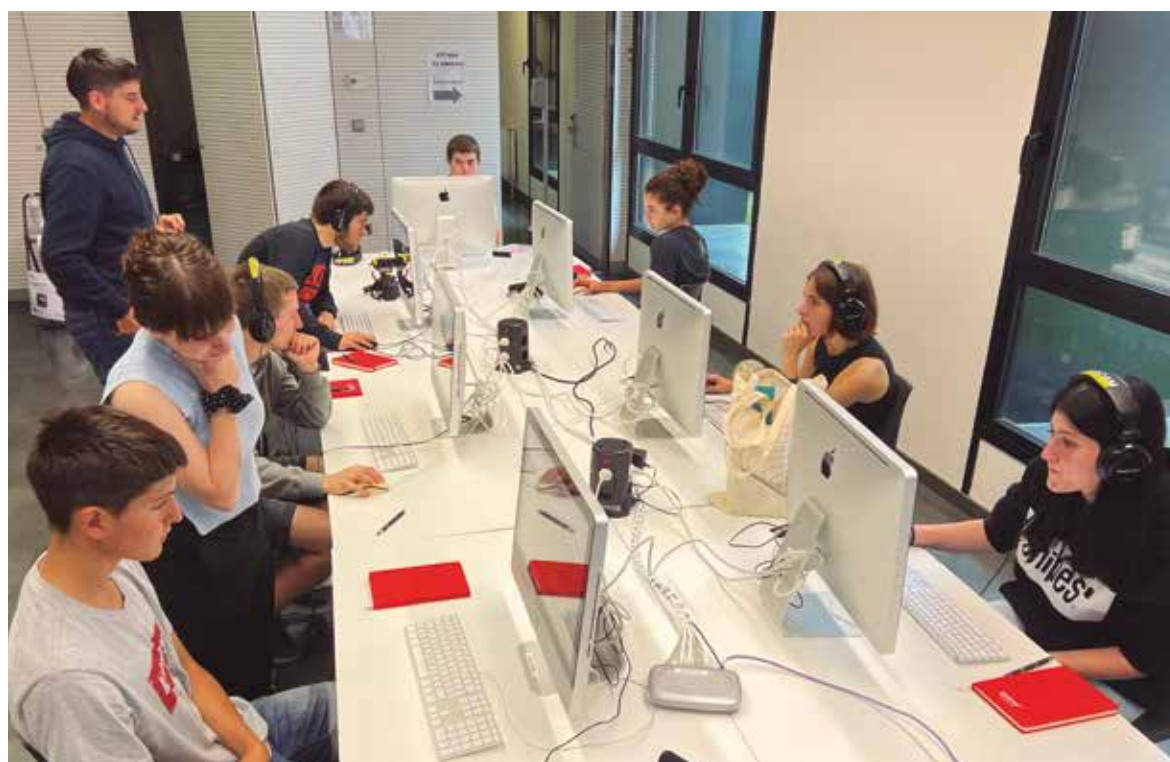
Jovenes entre 14 y 16 años podrán participar en el Campus de Comunicación

EL CAMPUS DIRIGIDO A LOS JÓVENES DE PRIMERO BACHILLERATO SE ORGANIZARÁ DEL 4 AL 15 DE JULIO EN DOS RELEVOS EL CAMPUS DE ARETXABAETA ACOGERÁ EL SEGUNDO CAMPUS DE COMUNICACIÓN