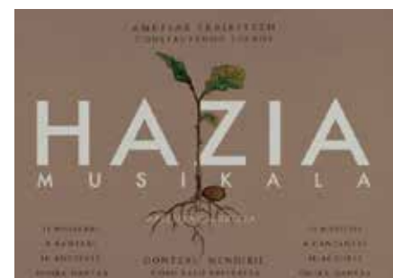
Hazia musikalaren kartel ofiziala.

oinarri hartuta, gure herriaren garapena gertutik ezagutzeko aukera eskaintzen da.