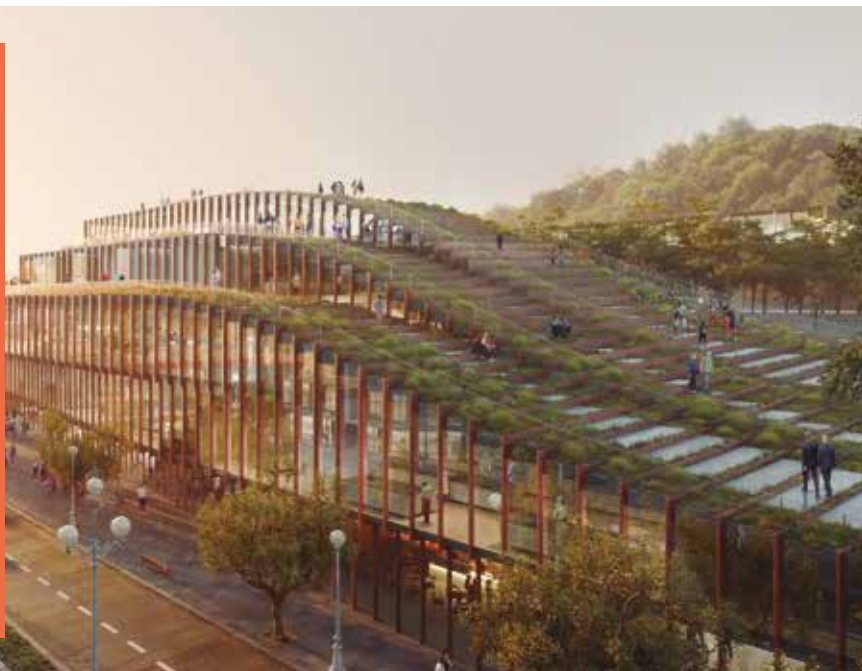
Proyección del futuro 'Olatuen bidea'.

El nuevo espacio se destinará a acoger actividades de investigación, innovación, experimentación, emprendimiento y formación.