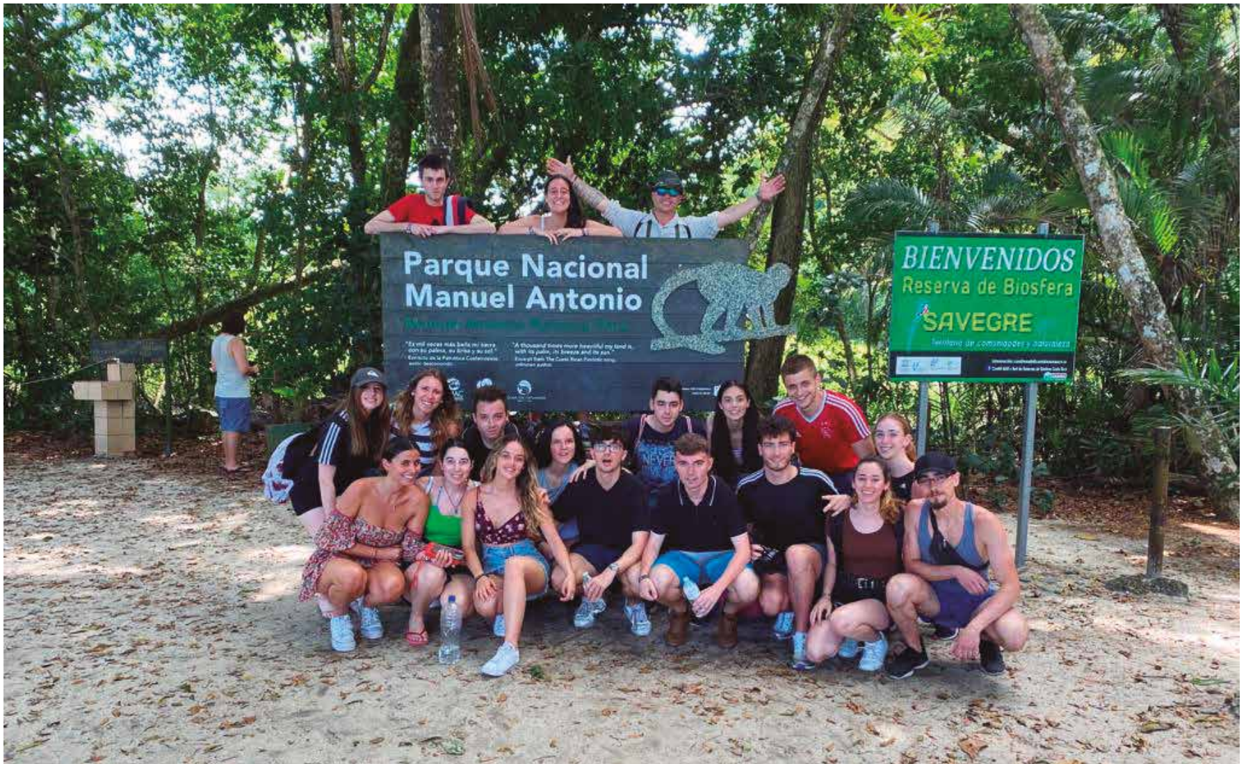
Alumnos y alumnas de tercer curso de myGADE en su experiencia internacional en Costa Rica.