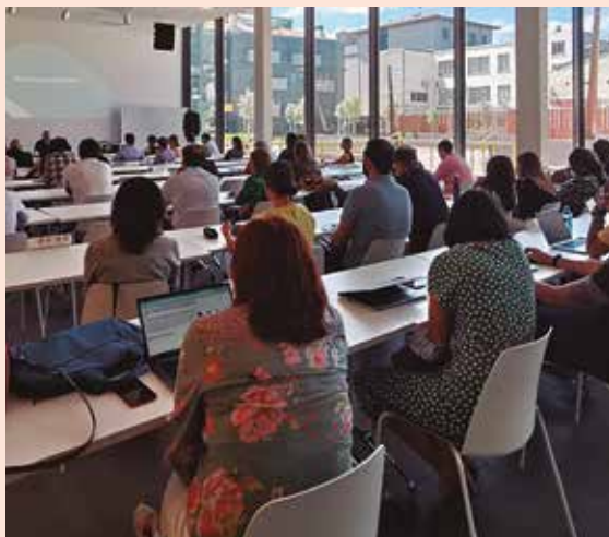
Éxito de asistencia del público.

Facultad de Empresariales | La Facultad de Empresariales de Mondragon Unibertsitatea organizó una jornada en la que participaron más de una treintena de empresas, con el objetivo de compartir los nuevos retos que el futuro inmediato depara en los ámbitos de gestión y data analytics. El objetivo de esta red es poner en marcha una vigilancia activa para identificar los factores que, en el nuevo entorno sociolaboral, impactan en la planificación estratégica del talento.