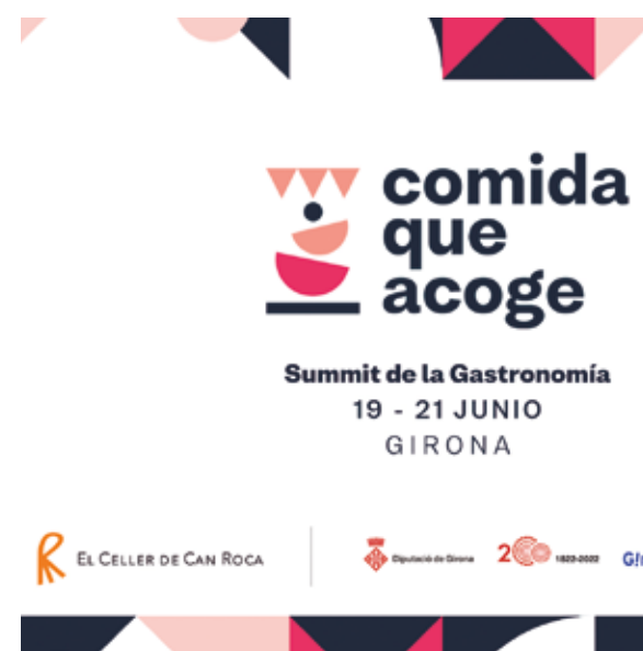
Cartel anunciador del evento.

Tras dos años de pandemia, en los que no se ha podido celebrar un encuentro presencial del Consejo, Basque Culinary Center volvió con fuerza con una cumbre de reflexión de alto nivel con la que abordó los retos y oportunidades del sector desde una mirada creativa. En un momento como el actual, marcado por la crisis, pero también plagado de oportunidades para quienes se atreven a apostar y emprender, el Summit “Comida que acoge” quiso compartir las claves para visualizar la gastronomía como dinámico espacio de acogida: de tendencias, y formas de entender la creatividad e innovación.