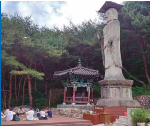
Estudiantes de MTA durante su viaje a Corea

La red MTA ha recorrido durante el 2022 más de 500.000 kilómetros a lo largo de 5 países.