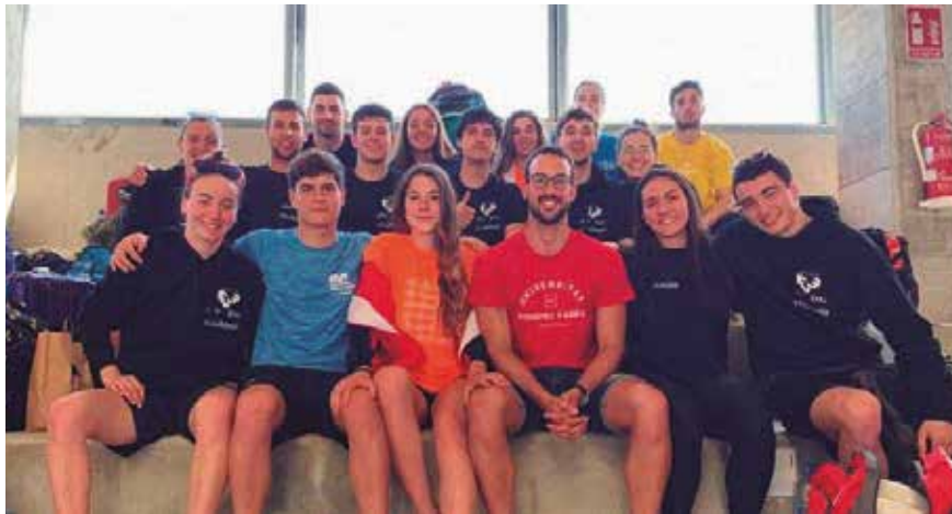
XXI. Euskadiko Unibertsitate txapelketa berezia Bilbon.

COVID-19AREN PANDEMIAK KIROL LEHIAKETAK ANTOLATZEKO MODUAN ERAGINA IZAN DU, ETA EGOKITZEA POSITIBOA IZAN ARREN OHIKO EREDURA ITZULI DIRA.