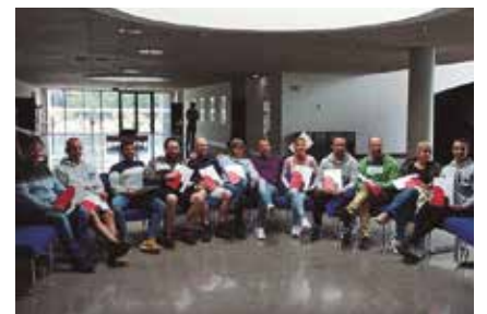
Proiektuan parte hartu duen taldea.

Programak Fagor Ederlanen fabrikazio plantetako langileak inplikatu ditu (txandaka lan egiten dutenak), eta baita unibertsitateko hogeitai irakasle ere. Gaikuntza plan honen alderdi teoriko-praktikoak Fagor Ederlanentzat funtsezkoak diren teknologietako gaitasunetara bideratuta egon da, hala nola galdaketa, mekanizazioa, automatizazio sistemak eta prozesu industrialen antolaketa.