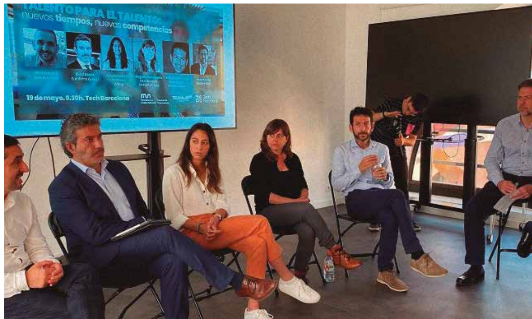
Una mesa redonda compuesta por distintos perfiles.

MONDRAGON UNIBERTSITATEA Y TEAMLABS ANALIZAN EN BARCELONA, JUNTO A EMPRESAS, LOS RETOS EN LA BÚSQUDA DE TALENTO Y LA GESTIÓN DE PERSONAS