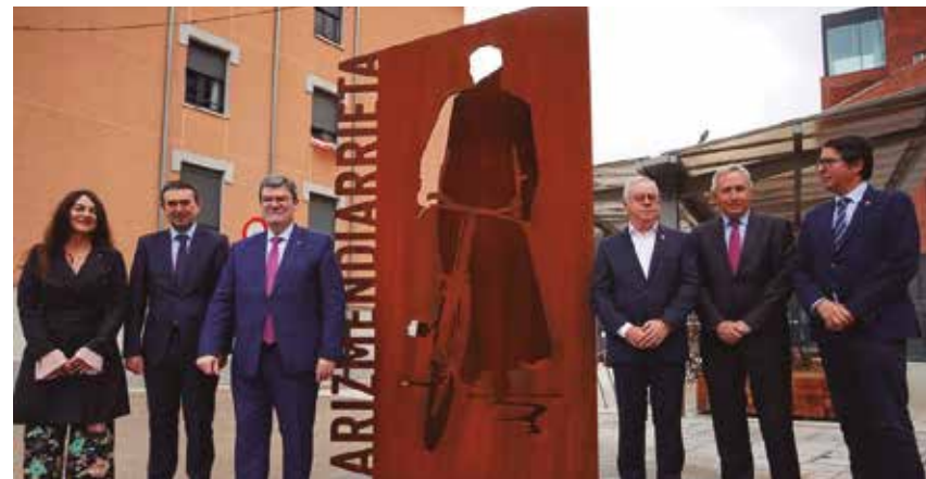
Eskulturaren inaugurazio ekitaldia.

BILBAO AS FABRIK CAMPUSAREN SARRERA KOKATU DA KOOPERATIBISMOAREN SORTZAILEARI ESKAINITAKO ESKULTURA BERRIA