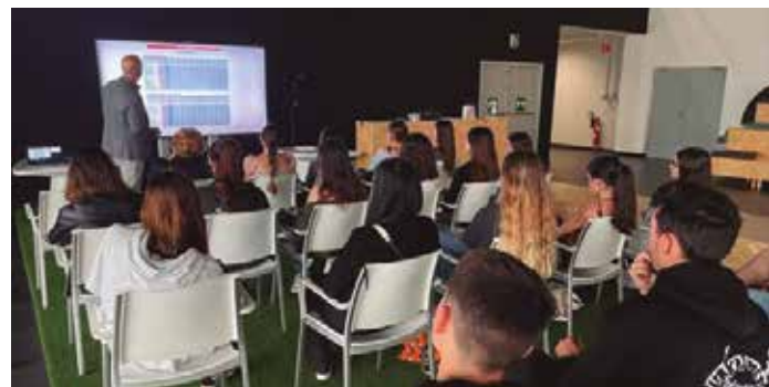
Estudiantes del grado atienden en su visita a EITB.

La visita supuso un análisis de un caso real, en este caso EITB, en el que han visto la importancia de la integración de los datos para este tipo de soluciones en concreto. Esta visita abre seguramente nuevas oportunidades de colaboración, añadidas a las que ya se están materializando.