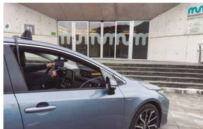
Prototipo utilizado en el proyecto InSecTT.

LAS ESCUELA POLITÉCNICA SUPERIOR PARTICIPA EN EL PROYECTO EUROPEO INSECTT, JUNTO A 52 SOCIOS DE 12 PAÍSES DE LA UNIÓN EUROPEA Y TURQUÍA.