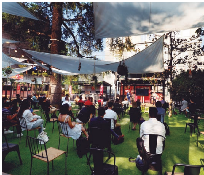
La jornada aglutinó a profesionales gastronómicos.