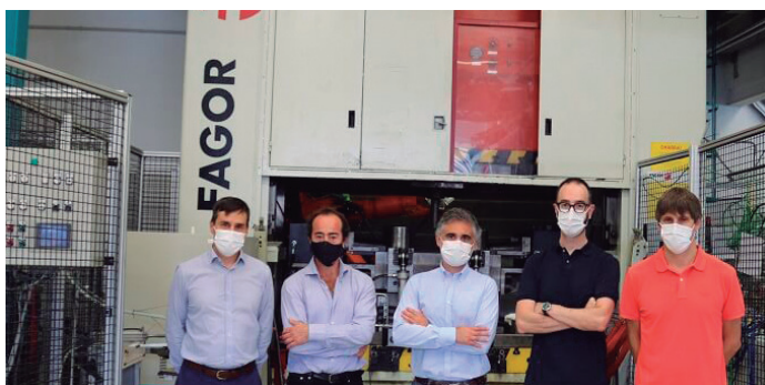
Lankidetzaren hitzarmena berri du.

Lankidetzak Industria 4.0ren garapena azpimarratuko du, urruneko ikuskapenerako eta datuak aztertzeko irtenbideekin. Era berean, sistema ziber-fisikoaren inguruko ikerketa sustatuko da, Fagor Arrasateren produktuen eraginkortasuna, fidagarritasuna, sendotasuna, adimena, autonomia eta elkarrekin-prestazioak hobetzeko.