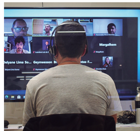
Online eskaintako saio sinkrono bat.

BRASILGO PARAÍBAKO HEZKUNTZA, ZIENTZIA ETA TEKNOLOGIAKO ESTATU IDAZKARITZAK ESKATUTA, ARLO EZBERDINAK JORRATZEN DITUZTEN IKASTAROAK ESKAINIKO DIRA.