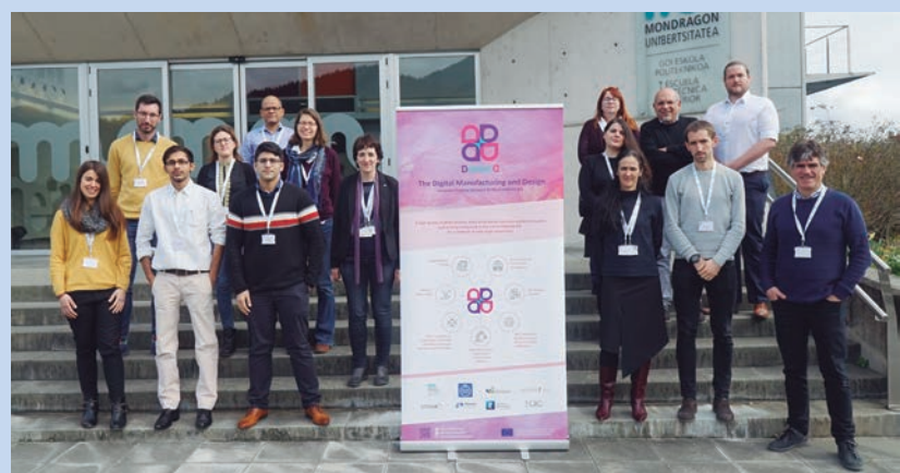
Participantes del proyecto DiManD.

La industria 4.0, también llamada la cuarta revolución industrial o la industria inteligente, es una nueva forma de organizar el trabajo y los recursos de producción. Uno de los principales desafíos para capacitar a futuros expertos y expertas en la Industria 4.0 son precisamente las habilidades multidisciplinares que estos necesitarán: ingeniería de fabricación, ingeniería de control informática y análisis de datos, ciberseguridad o interacciones hombre-máquina. Por ello, DiManD trabaja en formar a sus participantes en diversas áreas de conocimiento clave en la Industria 4.0, apoyados por la red internacional que forma parte del proyecto y de los expertos y las expertas. En este sentido, cada doctorando recibe formación individual de acuerdo con las necesidades de su tesis, así como formación dirigida a toda la red, tanto en el campo técnico como en temas transversales o de competencias indirectas: como propiedad intelectual y patentes, ciencia abierta, investigación e innovación responsables, emprendimiento, igualdad de género o habilidades de comunicación.