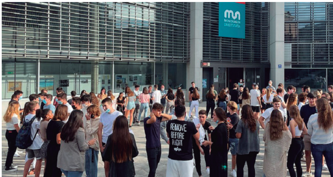
Encuentro de leinners en el laboratorio de Irun.

400 ESTUDIANTES HAN COMENZADO EL GRADO INTERNACIONAL LEINN INTERNACIONAL CON EL INICIO DEL NUEVO CURSO, CREANDO 23 NUEVAS TEAM COMPANIES, ASCIENDIENDO A 74 EL TOTAL EN LOS LABORATORIOS DE MONDRAGON TEAM ACADEMY