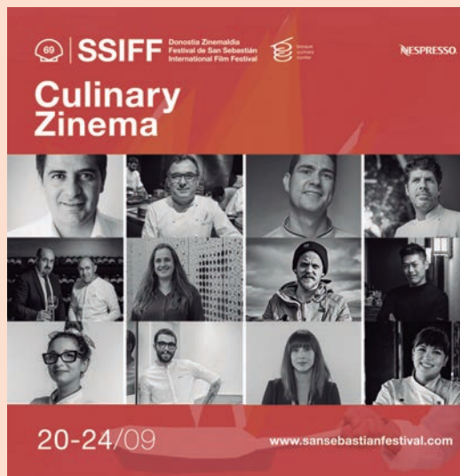
Cartel de la edición de este año.

Los envases reutilizables para alimentos representan la mejor opción ambiental en comparación con envases de un solo uso, pero: 1) debe asegurarse que los materiales utilizados son de bajo impacto ambiental, 2) se debe disponer de la infraestructura adecuada para la recogida, limpieza y redistribución de los envases reutilizables, 3) se debe incentivar a los consumidores y consumidoras para el retorno de los envases reutilizables, y 4) se requiere la implementación de sistemas de gestión de residuos adecuados.