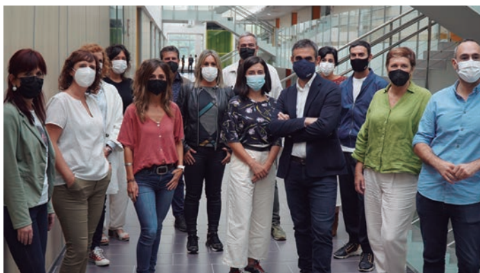
Presentación del programa 'Teknopolis' en Mondragon Unibertsitatea.

Escuela Politécnica Superior | La presentación de la 24ª temporada de Teknopolis tuvo lugar en Mondragon Unibertsitatea, en las instalaciones del parque tecnológico Garaia. En septiembre se estrenó en ETB la nueva temporada del programa Teknopolis en la que participa, un año más, Mondragon Unibertsitatea. El programa nos acerca la innovación, la tecnología y la información científica del País Vasco y de todo el mundo; y para esa labor, cuentan con los diferentes proyectos de investigación y transferencia que se realizan en la Escuela Politécnica Superior. En esta nueva temporada del programa, se emitirán varios reportajes sobre proyectos que se están realizando