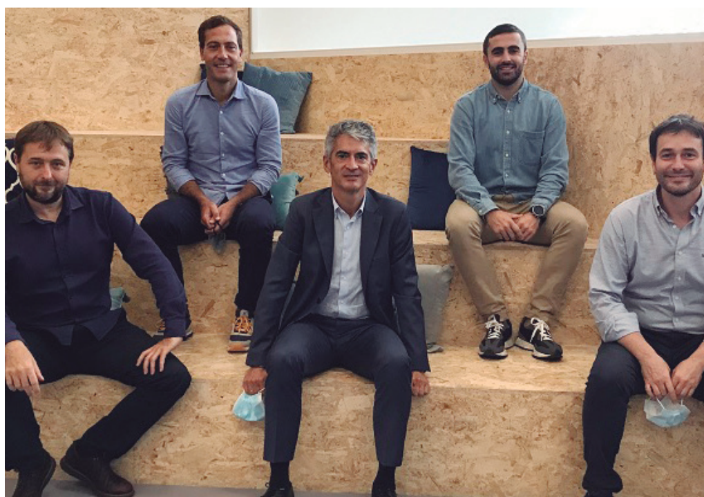
Agentes de ambas entidades han firmado el acuerdo para la creación de nuevas startups.

LA FACULTAD DE EMPRESARIALES DE MONDRAGON UNIBERTSITATEA Y AMBAS VENTURE BUILDERS HAN FIRMADO UN ACUERDO PARA CREAR UN MARCO PARA LA CREACIÓN DE NUEVAS STARTUPS DENTRO DE LOS PROGRAMAS DE INCUBACIÓN Y ACELERACIÓN DEL GRADO LEINN