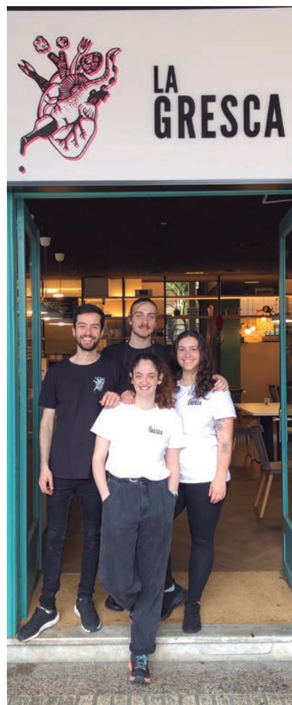
Los cuatro emprendedores.