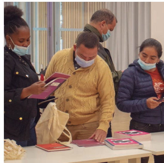
Kolonbiar taldea Euskal Herrira egindako bisitan.

Euskal Herrian egiten ari diren hiru aste-ko egonaldian, ordezkari kolonbiarrek