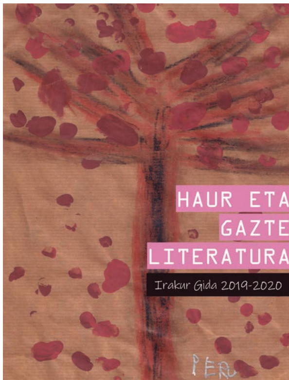
2019-2020 urteetako gidaren azala.

Gidaren hitzaurrean dioten moduan, 2019-2020ko gida "talde baten lan jarraituaren eta liburu askoren irakurketaren emaitza da. Guraso, irakasle eta bibliotekariarentzat lagungarri izan nahi du". Lan egiteko moduari dagokionez, zera diote: "2019-2020 urteetan euskaraz publikatu dena irakurri dugu, gure irakurketak kontrajarri ditugu eta hizkuntza-aren erabilpena, kalitate literarioa eta gaiari ematen zaion tratamenduaren arabera, besteak beste, baloratu ditugu". Liburuen zerrenda orokorraren ondoren sailkapen bat egiten da: liburu gomendagarriak eta oso gomendagarriak. Azken horiei erreseina bat gehitzen zaie. Gida hau egiteko, haur eta gazte literaturarekin lotutako 13 lagunek hartu dute parte, tartean, liburu zainak, eskoletako irakasleak eta fakultateko adituak.