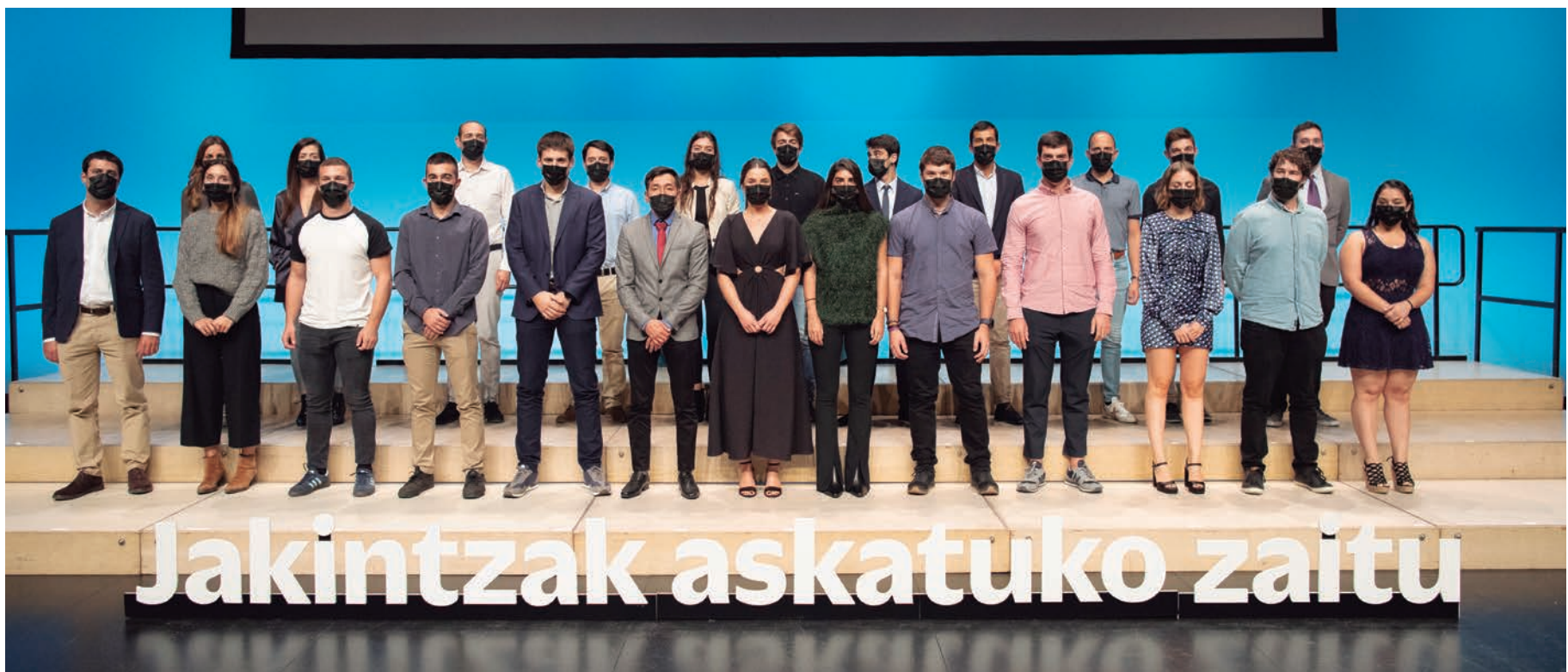
Acto de entrega de diplomas en el Kursaal.

LA ESCUELA POLITÉCNICA SUPERIOR ORGANIZÓ EN EL PALACIO KURSAAL DE DONOSTIA DOS ACTOS CONSECUTIVOS EN LOS QUE SE ENTREGARON LOS DIPLOMAS DE GRADO, MÁSTER Y DOCTORADO DE LAS PROMOCIONES 2019 Y 2020.