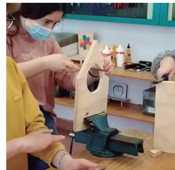
Zumaienako ikasleak STEM proiektuan lanean.

MONDRAGON UNIBERTSITATEKO HUMANITATE ETA HEZKUNTZA ZIENTZIEN FAKULTATEKO IKERTZAILEEKIN BATERA, PROIEKTUAN PARTE HARTU DUTE IKASLAN GIPUZKOA ETA VICOMTECH ERAKUNDEEK