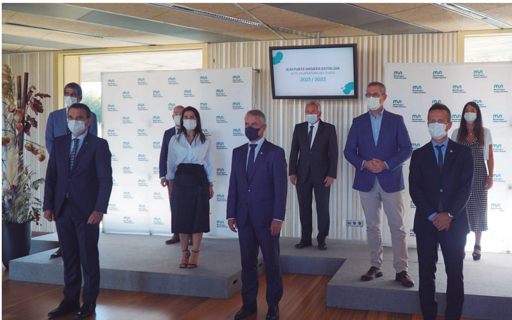
Mondragon Unibertsitateko hainbat arduradunekin batera, Iñigo Urkullu lehendakariak parte hartu zuen ekitaldian, Basque Culinary Centerren.