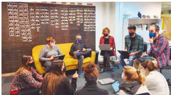
Bartzelonan egindako lehen workshop presentziala.

Hezkuntza berrikuntza sustatu nahi duten ikastetxeei bereziki zuzendutako programa zazpi modulutan banatuta dago; horren baitan daude hezitzaile zein bideratzaile eginkizunak eta baita ere ekipoen erraztaile zein proiektuen diseinua.