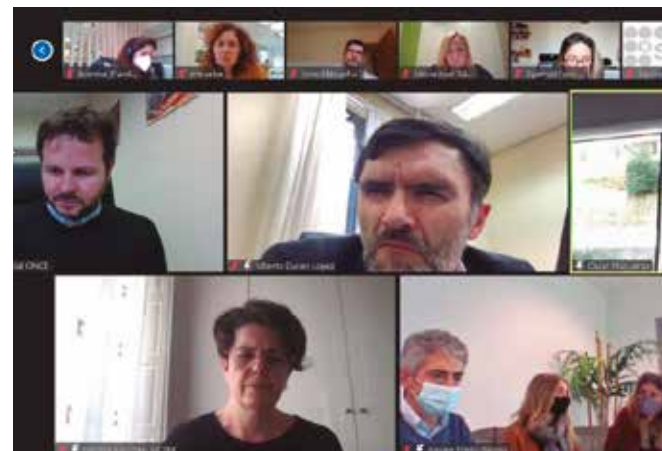
Inbertsio inklusiboko ikastaroko parte-hartzaileak eta hizlariak.

ONCE FUNDAZIOAK, LABORAL KUTXAK, MONDRAGON UNIBERTSITATEKO ENPRESAGINTZA FAKULTATEAK ETA MADRILGO CARLOS III UNIBERTSITATEAK GIZARTE-INBERTSIOARI BURUZKO IKASTARO BAT ABIARAZI DUTE, GIZARTE-ERAGINA IZANGO DUEN INBERTSIOEI BURUZKO PRESTAKUNTZA EMATEKO.