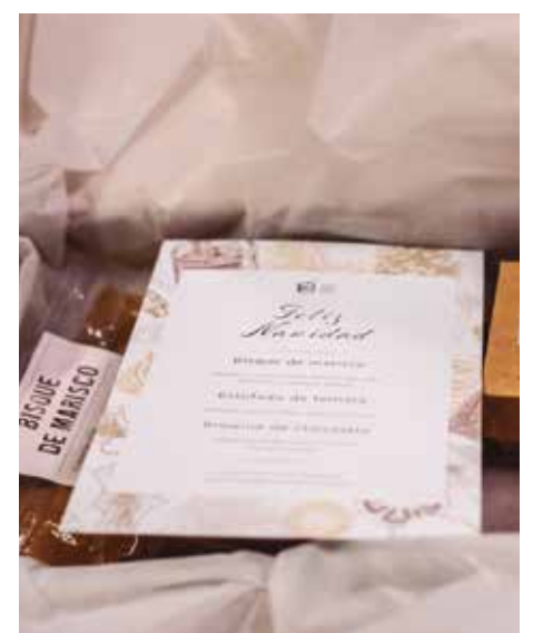
Mila menu eskeni ziren.

Ekimen honen helburua gastronomía ardatz izanik egungo pandemiak eragindako behar sozialei erantzutea izan zen, beharrian gehien duten pertsona-taldeekin harreman solidarioak eraikitzeaz gain.