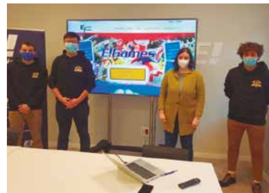
Kroma leinner taldeak Erandion aurkeztutako ekitaldia.

ASTRABUDUAN ETA ALTZAGAN KOKATUTAKO BI KARPETAN BIDEO-JOKOAN OINARRITUTAKO LEHIAKETA ANTOLATU DU LEINN EKINTZAILE TALDE BATEK.