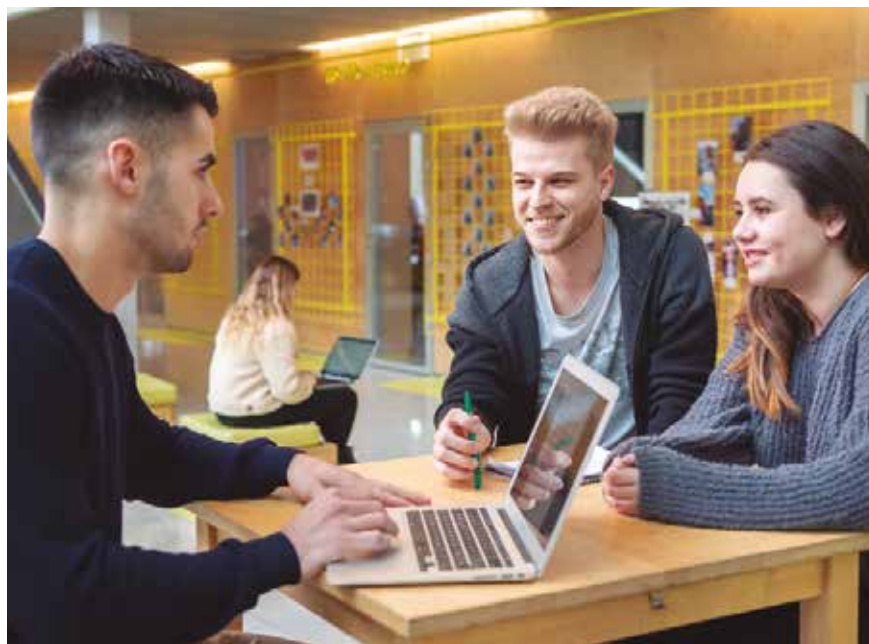
Enpresagintza Fakultateko ikasleak.

Gainera, languztiaikasleekin batera egiten da, haien egunerokotasunari aplikagarria izango den plan bat garatu ahal izateko.