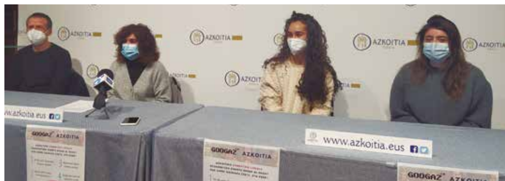
Leinnerrak, ekimenaren bultzatzaileak, Googaz 3.0 ekimenaren aurkezpen ekitaldian.

LEINNER-EK HAINBAT UDALERRITAN BULTZATUTAKO LEHIAKETA BATEK ESTABLEZIMENDUEN EGOERA AZTERTU ETA HOBEKUNTZAK PROPOSATZEN DITU.