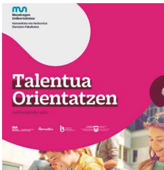
Funtzionamendua azaltzen duen gida ateratu dute.

Galdetegi bat du oinarrian "Talentua orientatzen" tresnak. Ondoren, Big Data eta adimen artifizialaren bidez, ikasleen erantzunak lan merkatuko kompetentziekin eta beharrek gurutzatu eta ikasleei beraien interesekin eta kompetentziekin bat datozen ikasteko aukerak aurkeztuko zaizkie. Gainera, behin galderak erantzunda, etorkizunerako hautaketa posibleak eskainiko zaizkie ikasleari. Hau da, ikaslearen adostasuna lan merkatuko beharrek eta kompetentziekin uztartutako hainbat informazio jasoko du ikasleak, esaterako: bere profilerako egokitzen den eskaintza akademikoa, ikastetxeetara dagoen distantzia eta lan merkatuko egoera.