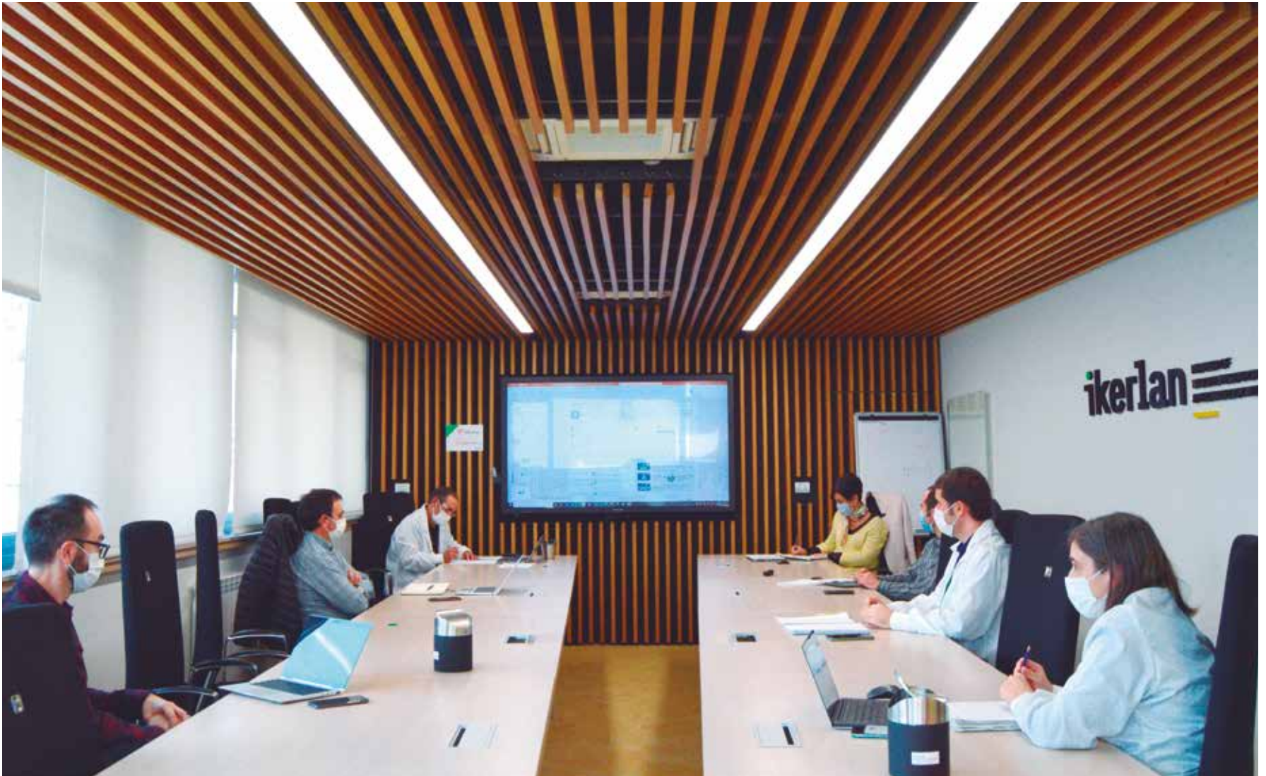
Goi Eskola Politeknikoak eta Ikerlan-ek bi erakundeen arteko lankidetzaren areagotzeko erreminta berriak sortu dituzte.