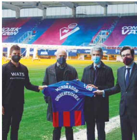
Hitzarmena Ipuruan sinatu zuten.

Horren baitan dago, baita ere, beka programa kirol talde horietako kirolarientzat zein horietan parte hartzen duten bestelako langileentzat; eta bi programatako kideei zuzendutako praktika eskaintza ere.