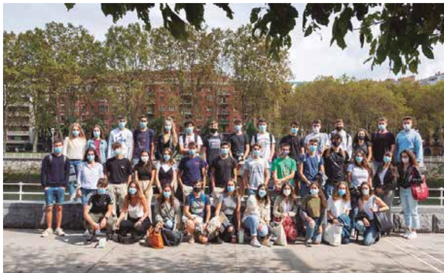
Business Data Analytics graduko ikasleak.

Business Data Analytics graduko ikasleak izango dira ekimen honetan parte hartuko dutenak.