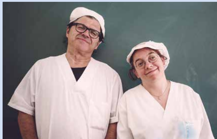
Fagedak ekoizten ditu, besteak beste, Katalunian gehien saltzen diren jogurtak.