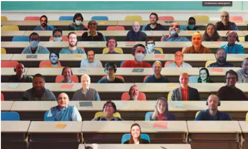
Seabat proiektuari hasiera eman dion bilerako taldearen argazkia.

Goi Eskola Politeknikoa | Tamaina handiko itsas garraioan baterien erabilera izugarri areagotuz doa, nahiz eta, adibidez, automozioaren elektrifikazioarekin alderatuta oraindik ere teknologia berrizat har dezakegun. Merkatuaren tendentzia itsasontzi hibridoetara begira dago eta epe luzeagoan full electric izango direnei, baina oraindik ere baterien sistema oso garestia da.