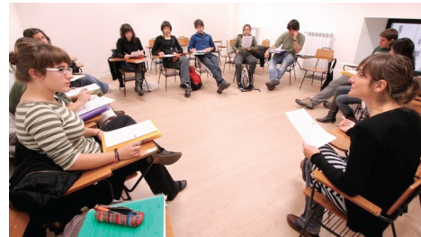
Los másteres comenzaran a impartirse en octubre de 2014.

En todos los casos, previa a la formalización de la matrícula, los interesados deberán preinscribirse accediendo a la página que la universidad a dispuesto en el siguiente sitio web: Preinscripciones .