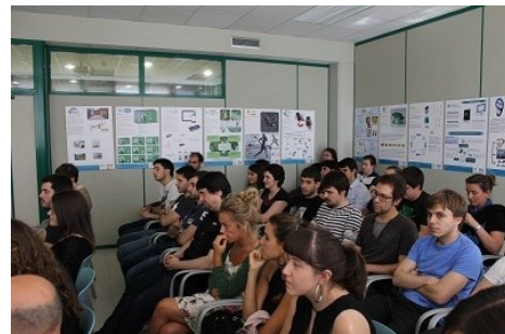
Premios KIMUBERRI AISE 2014