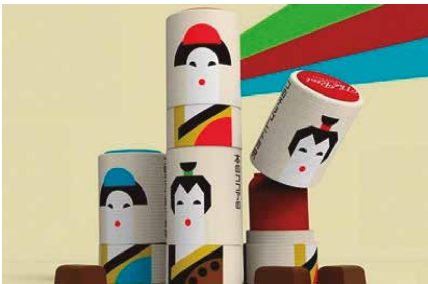
Diseño ganador del reto de la empresa Natra.

RESPONDIENDO A DOS RETOS HAN OBTENIDO DOS PREMIOS PRINCIPALES Y DOS ACCESIT EN LA XI EDICIÓN DE LOS PREMIOS NACIONALES DISEÑO Y SOSTENIBILIDAD DE ENVASE Y EMBALAJE