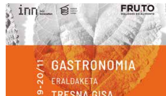
Imagen de la jornada.

EL BASQUE CULINARY CENTER Y FRUTO ORGANIZAN UNA JORNADA INTERNACIONAL DE GASTRONOMÍA Y SOSTENIBILIDAD EN TIEMPOS CARGADOS DE RETOS. BASQUE CULINARY CENTER Y FRUTO.