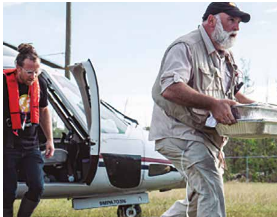
Premiado por su capacidad para responder a los retos creados por la pandemia.