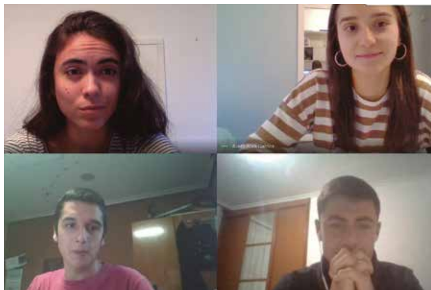
Miembros del Consejo de Estudiantes de la Escuela Politécnica Superior.

EL CONSEJO ESTUDIANTIL DE LA ESCUELA POLITÉCNICA SUPERIOR HA DONADO A MUNDUKIDE 15.900€ QUE NO PUDIERON UTILIZARSE EN ACTIVIDADES DEL CURSO 2019/2020