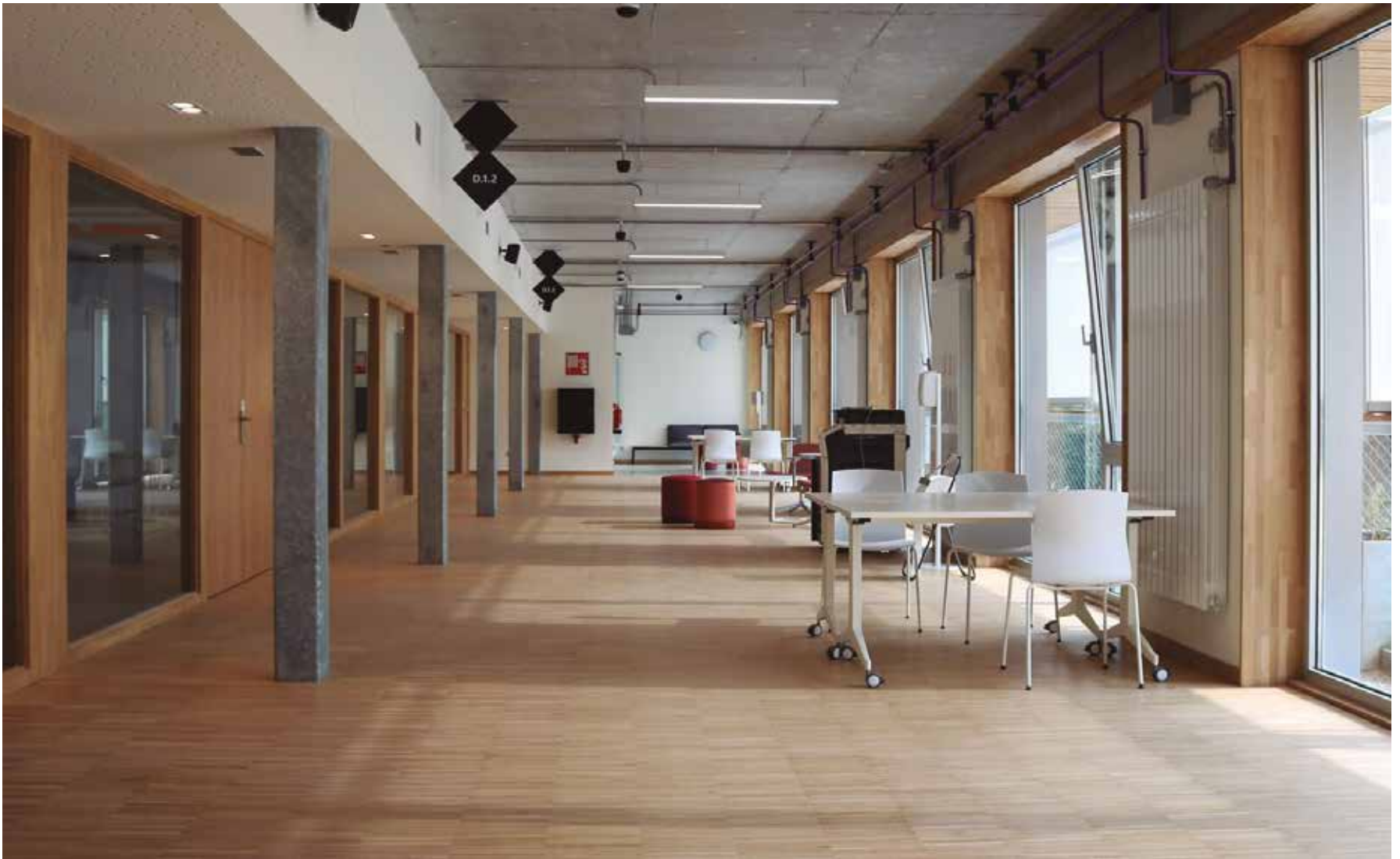
El nuevo edificio cuenta con modernos espacios.