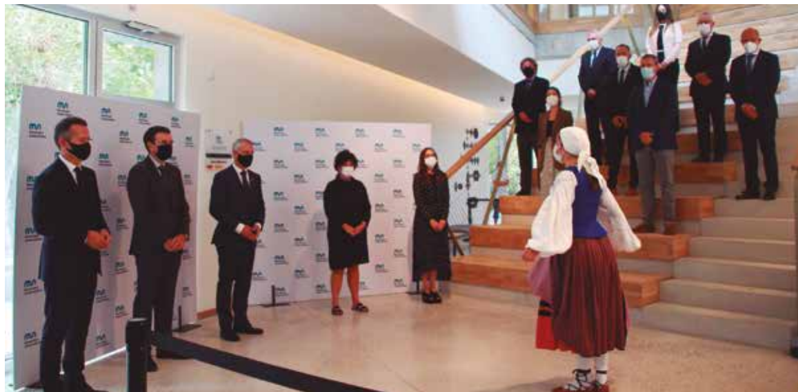
Recibimiento del acto de apertura del curso académico

MONDRAGON UNIBERTSITATEA CELEBRÓ EN EL NUEVO EDIFICIO DORLETA DEL CAMPUS DE ESKORIATZA EL ACTO DE APERTURA DEL CURSO 2020/2021 QUE SE PREVÉ INFLUENCIADO POR LA COVID-19.