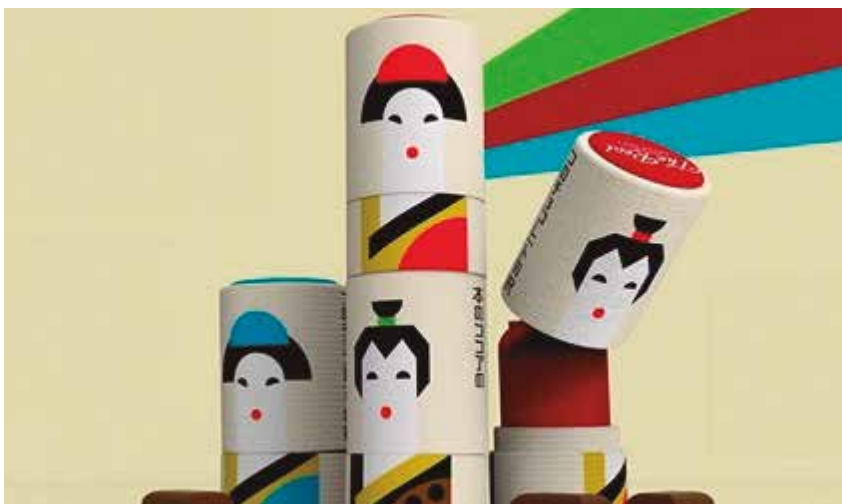
Natra enpresaren erronka irabazi duen diseinua

ONTZI ETA ENBALAJEEN DISEINU ETA IRAUNKORTASUNEN SARI NAZIONALEN XI. EDIZIOAN ERRONKA EZBERDINETAN BI SARI NAGUSI ETA BI ACCESIT ESKURATU DITUZTE.