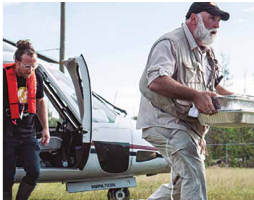
Pandemiak sortutako erronkei erantzuteko izan duen gaitasunagatik izan da saritua.