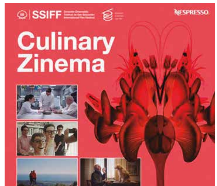
Cartel de la décima edición de ‘Culinary Zinema’.

De cara a conformar un espacio seguro durante la celebración del festival, todas las cenas fueron diseñadas bajo un estricto protocolo de seguridad e higiene frente a la COVID-19. Por ello, los profesionales que participaron en las cenas llevaron EPIs específicas de protección, hubo dispensadores de gel hidroalcohólico en los diferentes espacios y se habilitaron varios flujos de entrada para las personas asistentes.