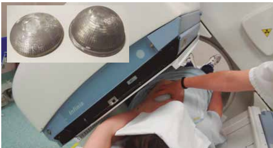
La solución patentada interviene en el proceso de detección de cáncer.

LOS SECTORES MÉDICO E INGENIERO SE ALÍAN PARA MEJORAR LA VISUALIZACIÓN DE LAS CÉLULAS DAÑADAS POR EL CÁNCER DE MAMA AUMENTANDO LA PRECISIÓN DE LA DETECCIÓN Y REDUCIENDO LAS INTERVENCIONES EN LA PACIENTE.