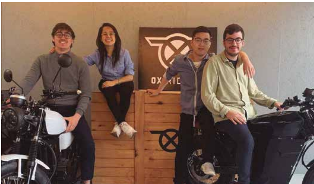
El equipo The OX Riders está a punto de lanzar su producto.

THE OX RIDERS, UN EQUIPO FORMADO EN EL GRADO LEINN INTERNACIONAL DE MONDRAGON UNIBERTSITATEA, HA ELABORADO UN PROYECTO DE MOVILIDAD ELÉCTRICA QUE PREVÉ ENTREGAR SUS PRIMEROS EJEMPLARES A PARTIR DE 2021.