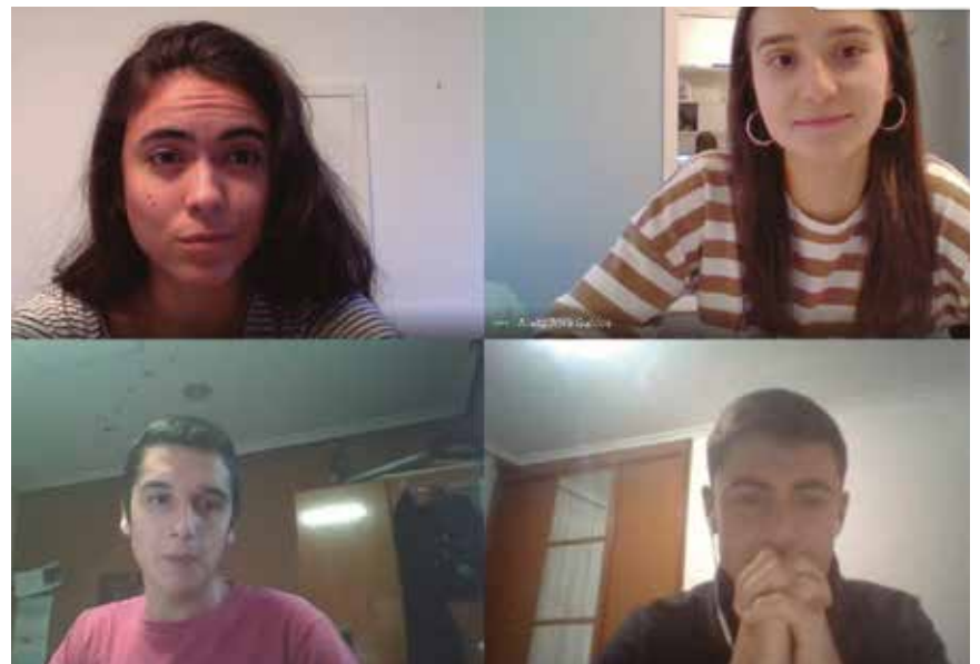
Goi Eskola Politeknikoko Ikasle Kontseiluko kideak.

GOI ESKOLA POLITEKNIKOKO IKASLE KONTSEILUAK 2019-2020 IKASTURTEAN AKTIBITATE KULTURA EKINTZETAN ERABILI EZIN IZAN ZUTEN 15.900€KO DIRU-POLTSA MUNDUKIDERI DONATU DIO.