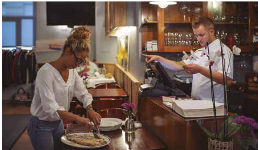
‘El Vaskito’, un restaurante donde la carta cambia a diario.

¿Qué balance harías de lo vivido hasta ahora? Bueno, diría que aún estamos asentándonos. Ya hemos recibido el primer golpe y cometido los primeros errores. Todo sirve para aprender y continuar mejorando, y yo soy una persona muy inquieta a la que le gusta aprender nuevas cosas y seguir mejorando. Por lo tanto hasta ahora la experiencia la califico como muy positiva, y aunque el futuro siempre es incierto, me gustaría seguir aprendiendo de ella.