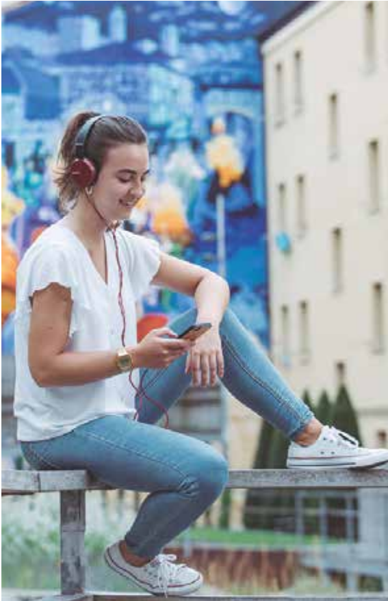
Gure podcast-a Spotify-n entzungai dago dagoeneko.

SPOTIFY AUDIO EDUKIEN PLATAFORMAN EZAGUTZA POADCAST BIDEZ ZABALTZEKO KANAL BERRIA UNIBERTSITATEAK DIGITALIZAZIORAKO DITUEN ERRONKEN BAITAN KOKATZEN DA.