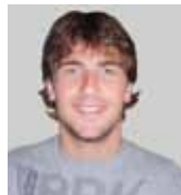
UNAI IRAOLA Biltegitratze sistemetan optimizazio elektro-termikoa aztertzen da, litiozko baterietan oinarrituta.

Este trabajo se centra en los sistemas de almacenamiento basados en células electroquímicas, concretamente en las baterías de litio, ya que su alta densidad de energía y su vida útil las hace adecuadas para aplicaciones de tracción y de almacenamiento en red eléctrica.