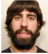
JOANES BERASATEGI El comportamiento de los amortiguadores magneto-reológicos es diferente según los parámetros y condiciones.

Motelgailu magneto-erreologikoak bibrazioen atenuazioa optimizatzeko erabiltzen dira. Tesi honetan motelgailu hauen portaera aztertu da. Horretarako, lehenik konposaketa ezberdineko fluido magneto-erreologikoak formulatu eta entseatu dira. Fluido hauek diseinu ezberdineko motelgailuetan erabili dira, motelgailuari lan baldintza ezberdinak ezarritik. Honela, parametro hauek motelgailuaren portaeran duten eragina aztertu da.