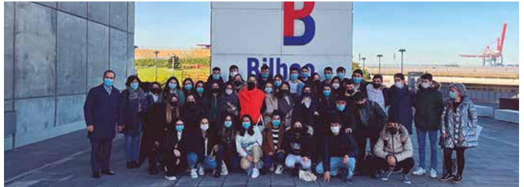
Business Data Analytics graduko ikasleak Bilboko portuan.

BUSINESS DATA ANALYTICS (BDATA) GRADUKO IKASLEEK BILBOKO PORTUAN 2022AN AURREIKUSTEN DEN AKTIBITATEA PUBLIKATU DUTE