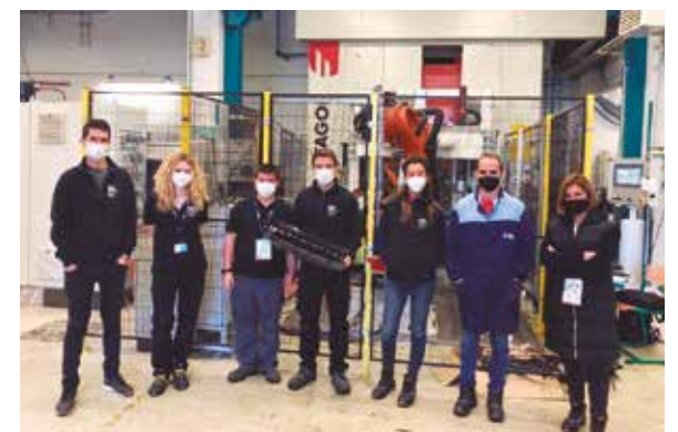
Elkarlanean ari da garatzen proiektua.

LAY2FORMeko diziplina anitzeko bazkideen osagarritasuna lau dimentsioetan lan egiteko erabili da; materialen, prozesuen, sistemen eta produktuen ingeniaritzan.