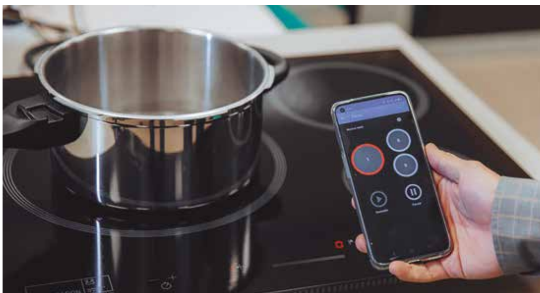
Kitchen Eye intuiziozko funtzionamendua du.

GOI ESKOLA POLITEKNIKOKO SOFTWAREAREN ETA SISTEMEN INGENIARITZAKO IKERKETA TALDEAK ETA DISEINU BERRIKUNTZA ZENTROAK LANKIDETZAN JARDUN DUTE MONDRAGON COMPONENTES-EK IKUSPEGI MURRITZUA DUTEN PERTSONENTZAKO DISEINATUTAKO BITROZERAMIKA BATEN EREDUAN