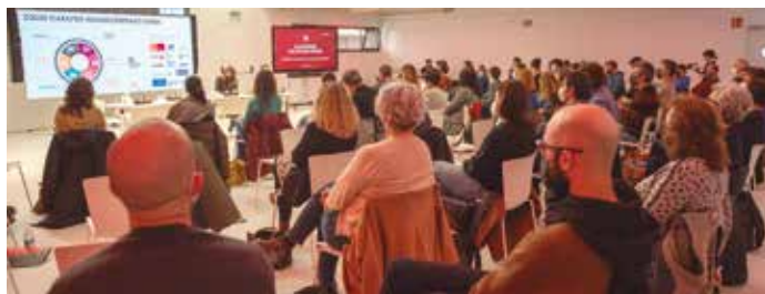
Arantzazulab-en egin zen jardunaldia.

KoopFabrikan parte hartu zuten, beste batzuren artean, LANKI Kooperatibismoaren Ikertegiak eta Olatukoop Ekonomia Sozial eta Eraldatzailea Sareak.