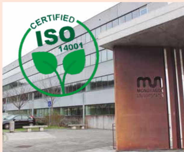
Goiru egoitzako sarrera.

Euskal Kulturgintzaren Transmisioa aditu titulua, 9. edizioan ere esku hartuko dut Sarrionandiak. Aditu hori 2022ko irailaren 24an hasiko da.