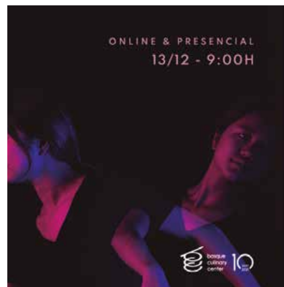
“Host” online eta aurrez aurre egin zen.