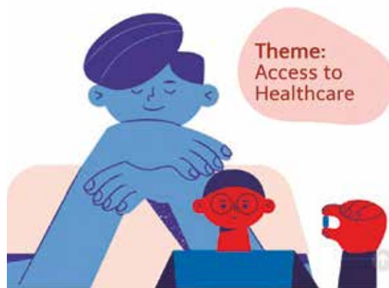
Africa Basque Challenge ekitaldiaren irudia.