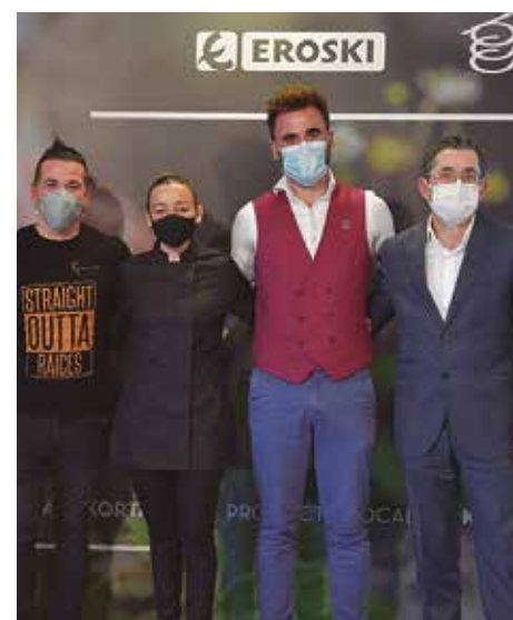
Tres alumni fueron premiados.