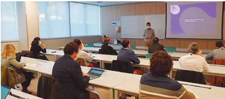
Deep Dive jardunaldia Goi Eskola Politeknikoan.

GOI ESKOLA POLITEKNIKOAK DEEP DIVE JARDUNALDIAK ANTOLATU DITU, UNIBERTSITATEAK DITUEN EKIPAMENDUA ENPRESEI EZAGUTARAZTEKO. TOPAKETAK SPRIK SUSTATUTAKO BDIH (BASQUE DIGITAL INNOVATION HUB) INIZIATIBAREN BARNEAN KOKATZEN DIRA.