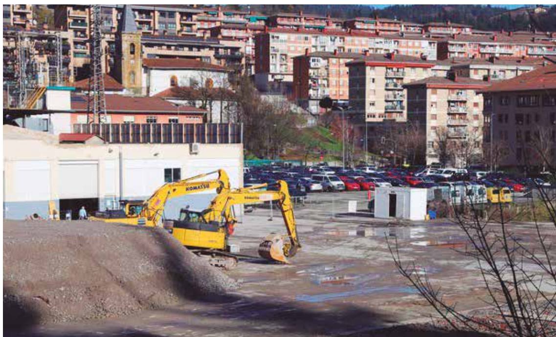
Gautxori eremuko lanak.

GAUTXORI EREMUAREN URBANIZAZIO LANAK AURRERA DIHARDUTE, 2023KO IRAILERAKO BUKATZEKO AURREIKUSPENAREKIN. BERTAN KOKATUKO DA MONDRAGON UNIBERTSITATEAREN HIREKIN PROIEKTUA, EKINTZAIETZA TEKNOLOGIKOAREN BITARTEZ INDUSTRIAREN EMISIOAK MURRIZTERA BIDERATUTAKO DA PROIEKTU BERRIA.