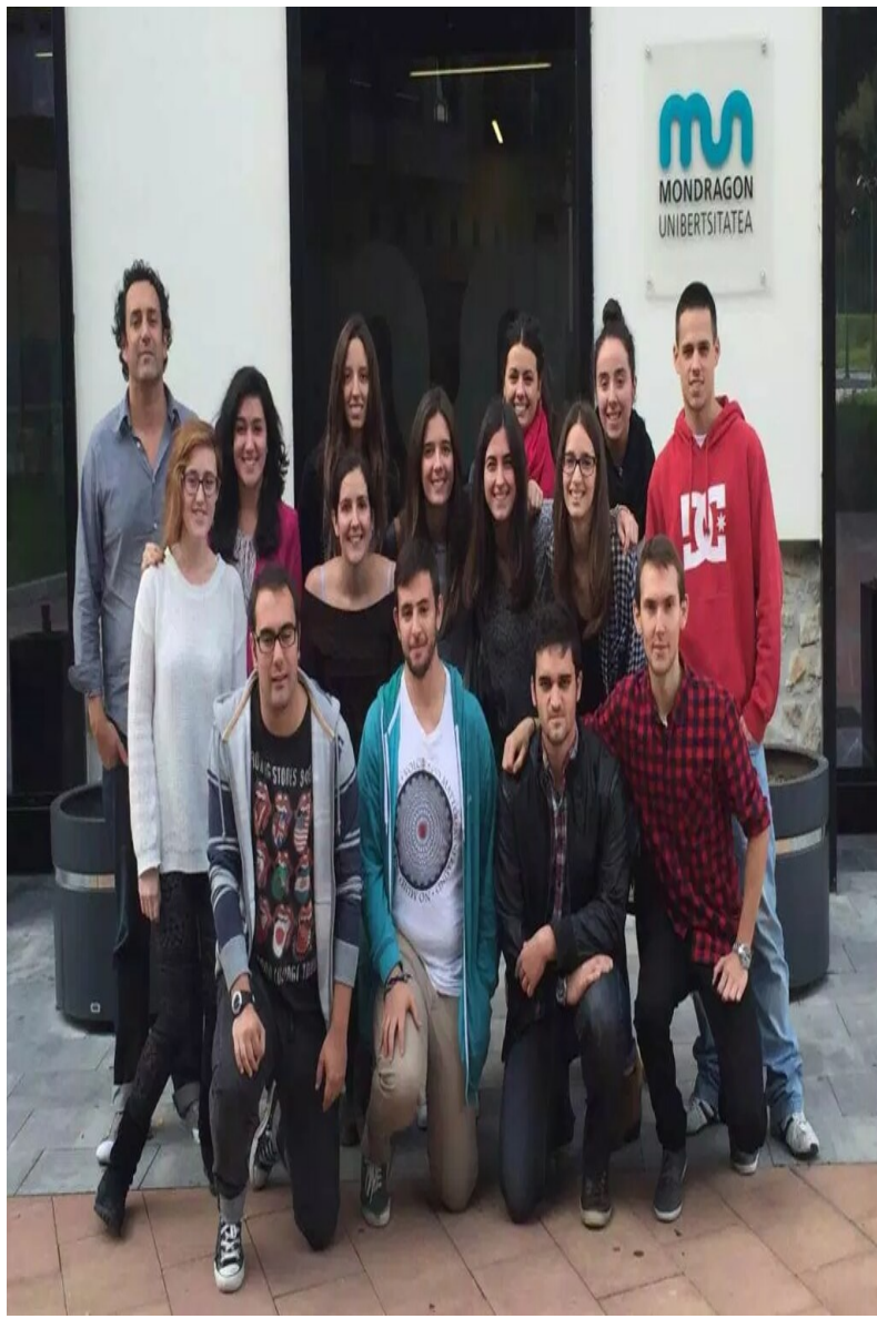
Grupo de estudiantes organizadores de Huhezinema 2016.

Las bases del concurso, las especificaciones para tomar parte y toda la información de ediciones anteriores está recogida en el sitio web del concurso: www.huhezinema.com